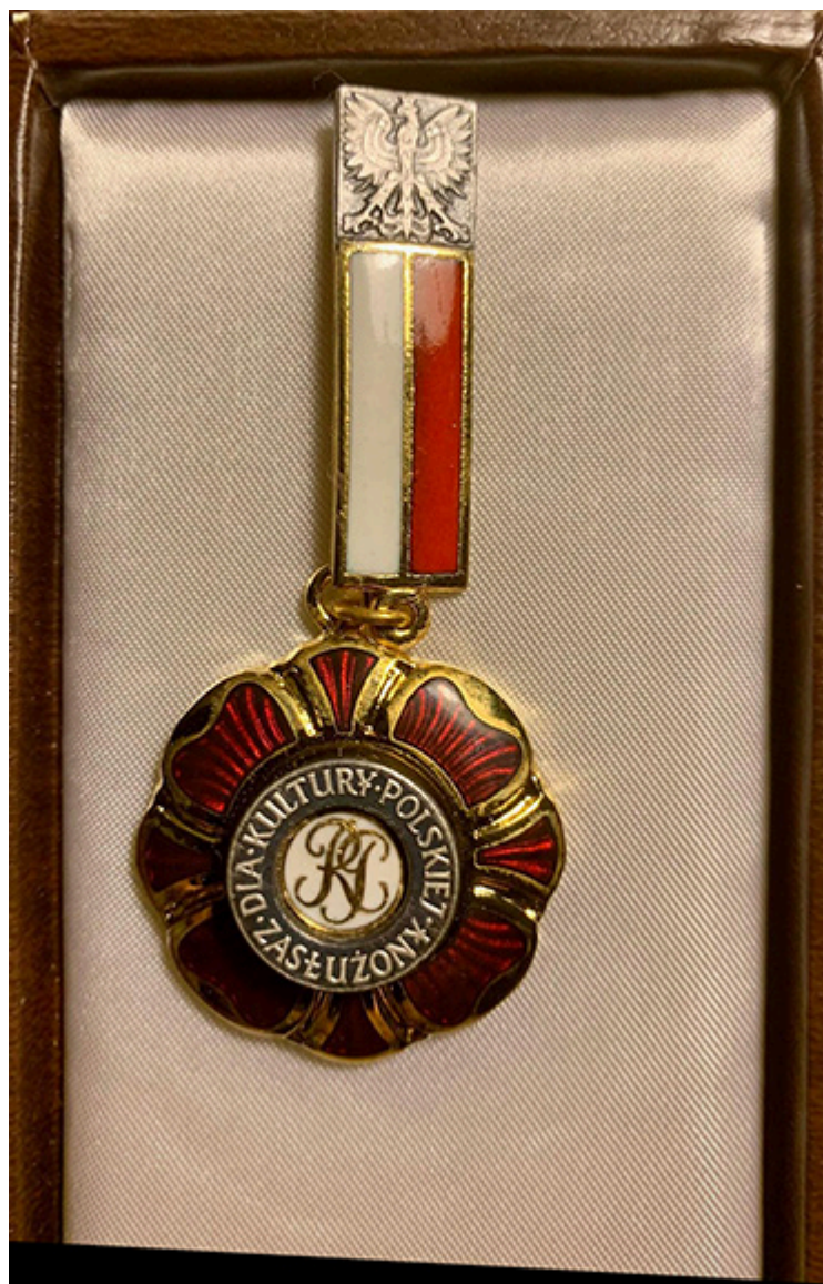
Medal przyznany przez Ministra Kultury i Dziedzictwa Narodowego „Zasłużony dla Kultury Polskiej”