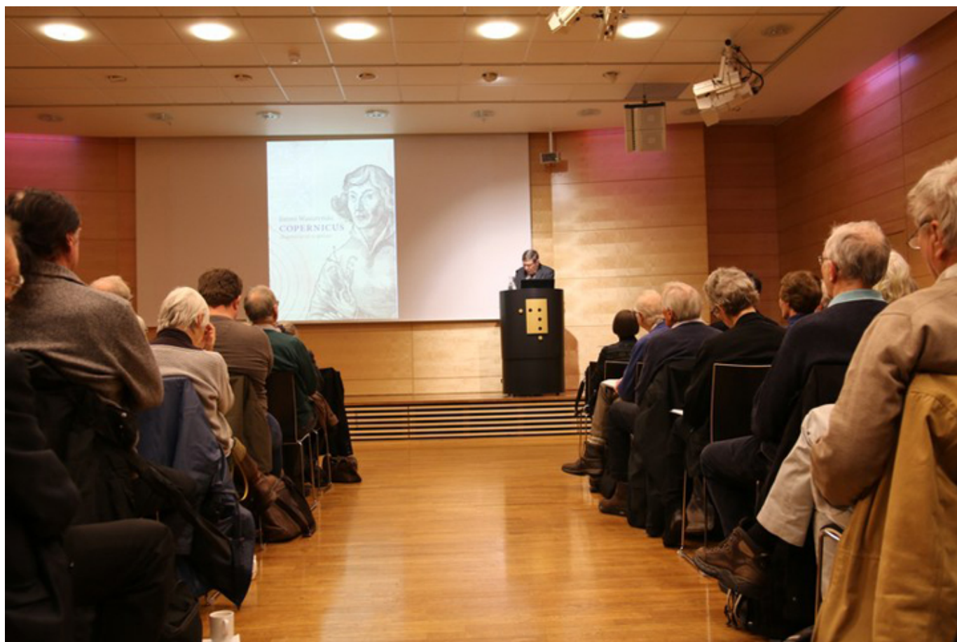
Biblioteka Narodowa w Oslo 25 stycznia 2018 r., fot. M. Tomczyk-Maryon.

25 stycznia 2018 r. w Bibliotece Narodowej w Oslo odbyła się promocja książki Jeremiego Wasiutyńskiego „Copernicus - skaperen av en ny himmel” (Kopernik - twórca nowego nieba). Duża sala wykładowa była szczelnie wypełniona polską i norweską publicznością. Nieczęsto zdarza się, aby tego rodzaju impreza spotkała się z tak żywym zainteresowaniem. Jednak co najmniej trzy powody przyciągnęły słuchaczy. Powód pierwszy: osoba autora. Powód drugi: sama książka. Powód trzeci: jej tłumaczenie na język norweski.