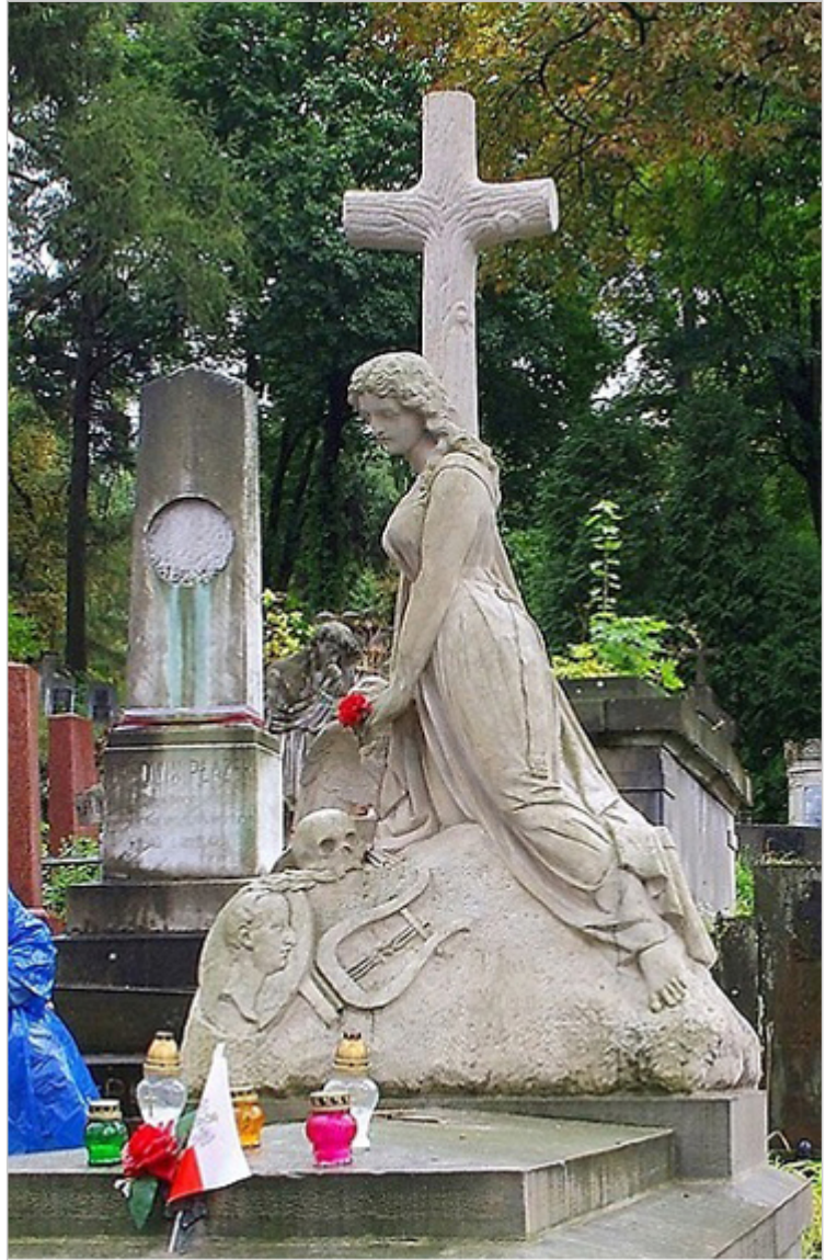
Pomnik nagrobny Artura Grottgera.