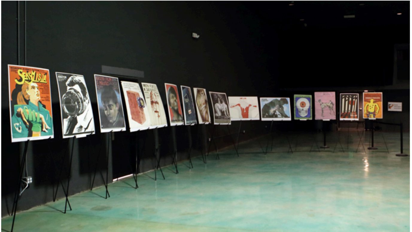
Wystawa plakatów filmowych z kolekcji Michała Poniza, fot. Marek Proga.