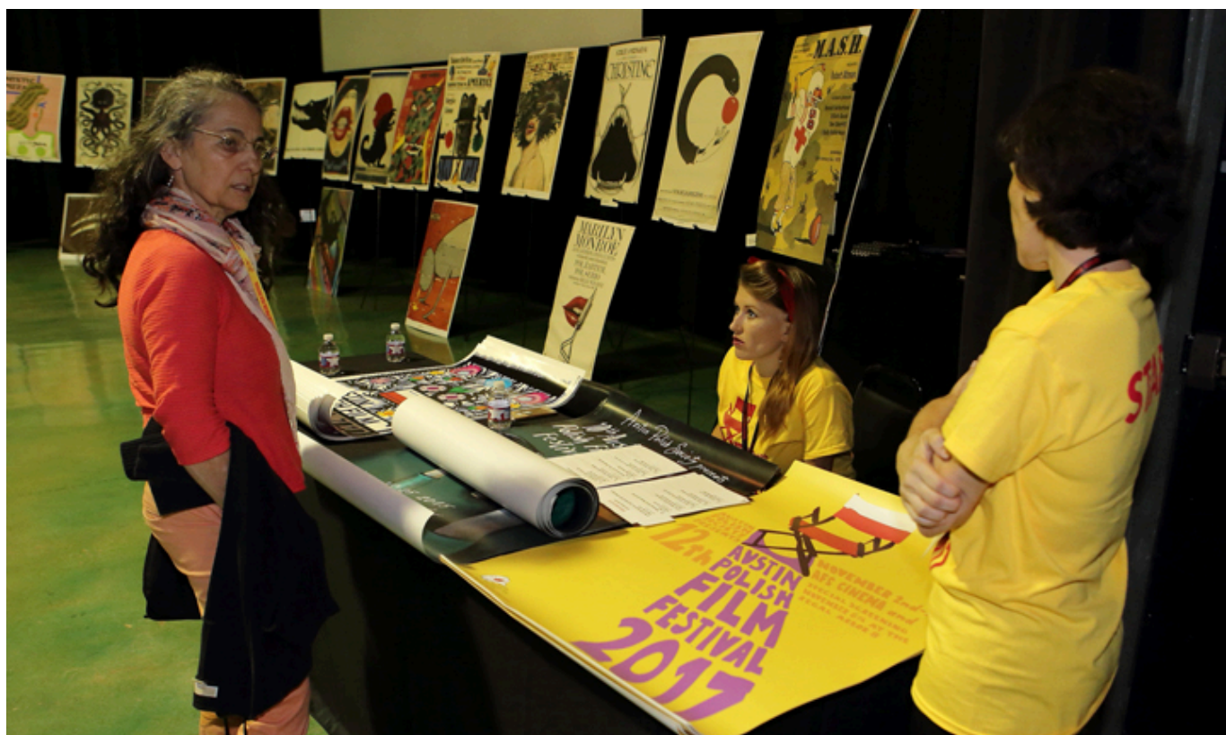
Sprzedaż plakatów festiwalowych, fot. Marek Proga.