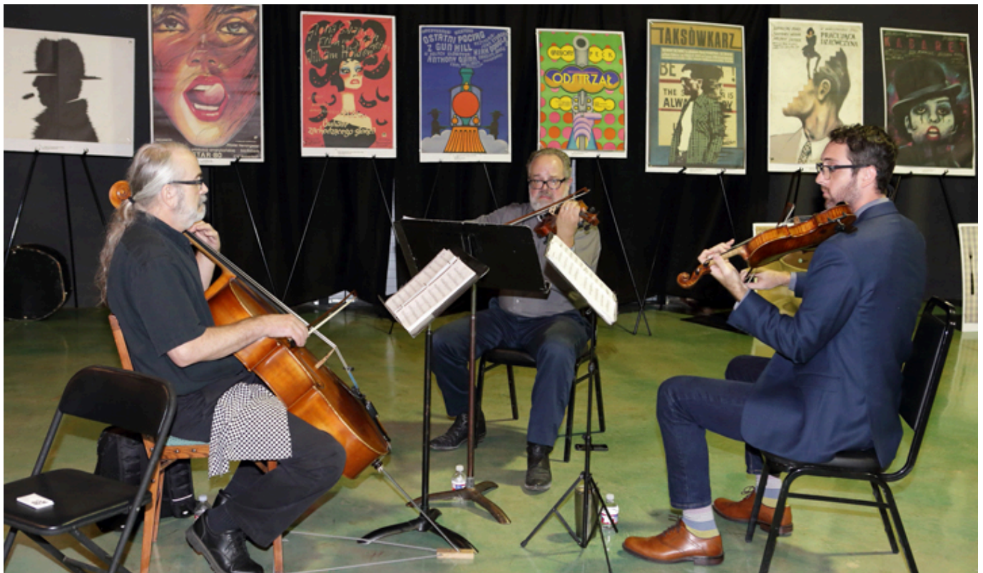
Koncert na otwarcie Festiwalu, fot. Marek Proga.