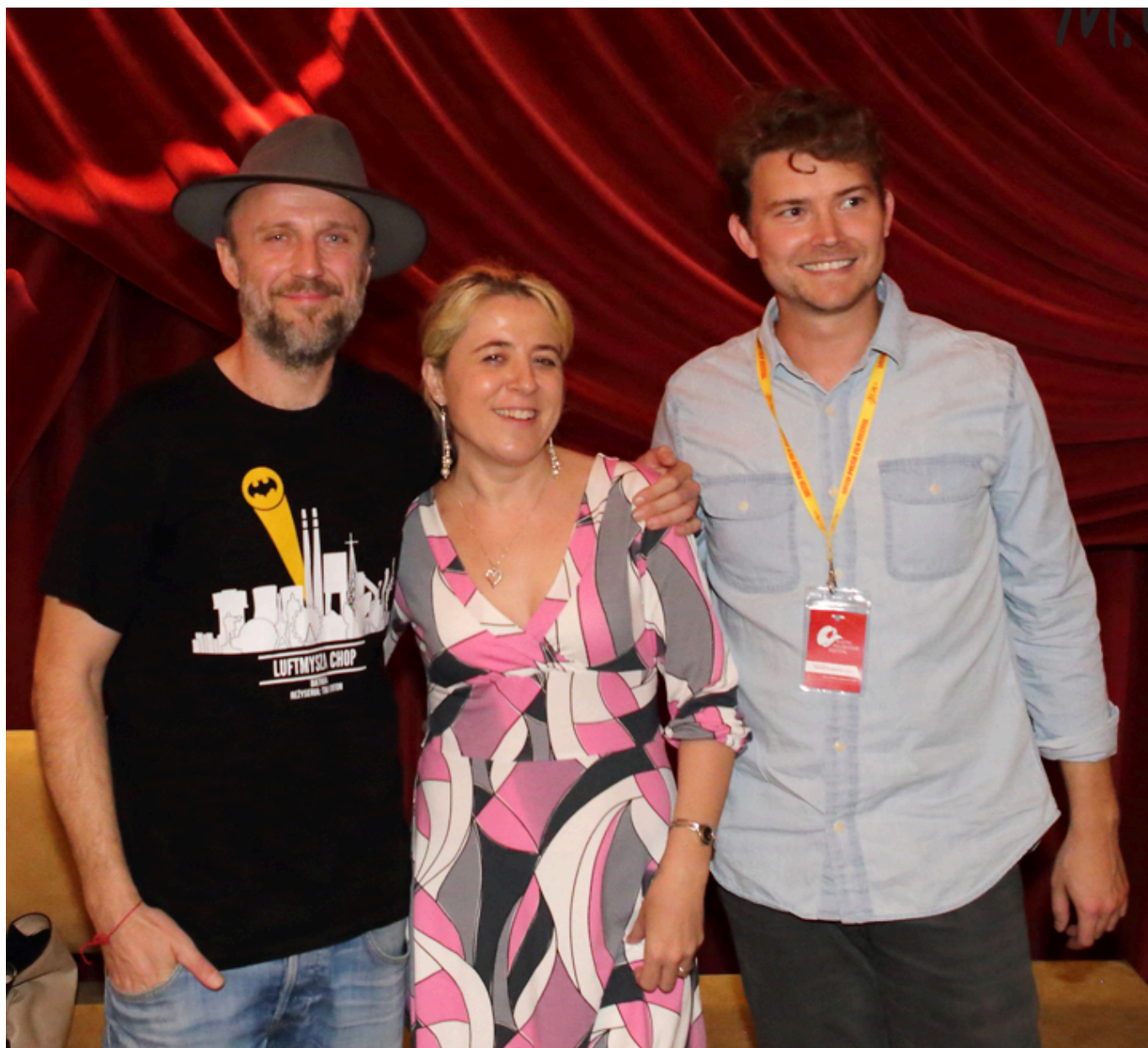
Od lewej: Łukasz Simlat, Karolina Camara i Richard Karpala