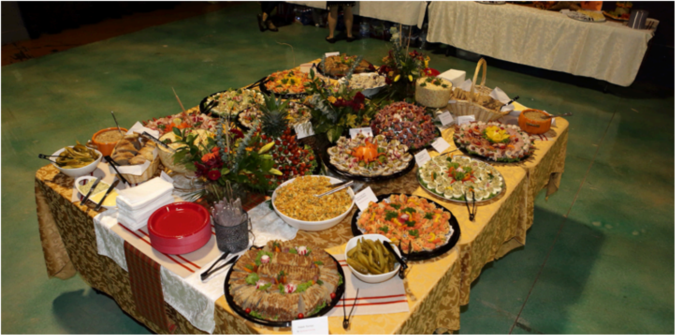
Apolonia Catering przygotowała wysmienite polskie jedzenie, fot. Marek Proga.