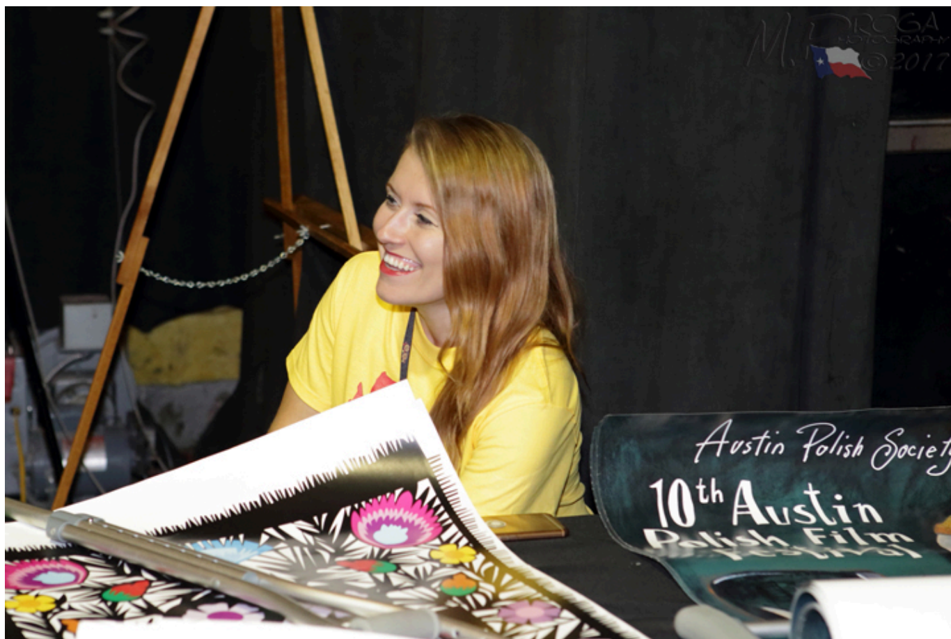
Wolonatruszka obsługująca Festiwal w żółtej koszulce, fot. Marek Proga.