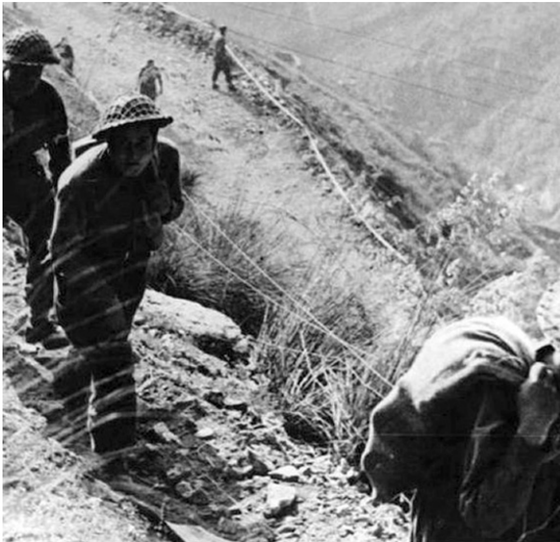
Polska Armia pod Monte Cassino, fot. Narodowe Archiwum Cyfrowe, sygn. 37-645-2, za Pinterest.

Nazajutrz obiecywałem sobie od wczesnego rana siedzieć na podsłuchu. Tam przybyliśmy o 10.20 - prawie o tej samej właśnie minucie gen. Anders otrzymał meldunek, że przed paru minutami patrol 12 pułku ułanów wszedł do klasztoru Monte Cassino. Okazało się także, że w nocy i nad ranem wzięto Albanetę, 595 i 567. W chwilę potem widzieliśmy gen. Andersa udającego się na nabożeństwo, które z tego tytułu zarządził.