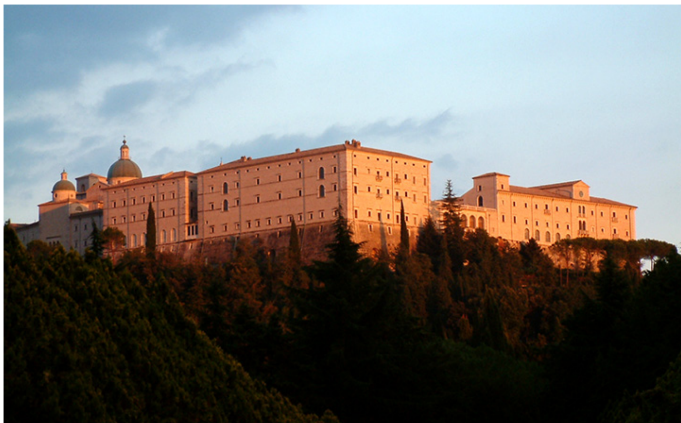
Monte Cassino