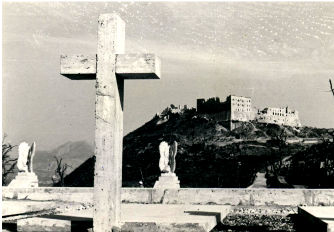
1946 rok. Ruiny klasztoru Monte Cassino - krzyż nagrobny na Polskim Cmentarzu Wojennym, fot. T. Zajczkowski.

Szliśmy ostrożnie dziwując się, że to tak daleko i wysoko. W dwu miejscach natrafiliśmy na skrzyżowanie, ale w końcu stanęliśmy na szczycie, na którym wznosiła się nad okolicę iglica imponującego pomnika ku czci żołnierzy 3 Dywizji Strzelców Karpackich. Okazało się, że byliśmy na wzgórzu Albaneta, o które toczyły się krwawe walki, w których oprócz Polaków brali udział żołnierze oddziałów brytyjskich, amerykańskich, indyjskich i Gurków. Na tej „górze ofiarnej” przy świetle latarki