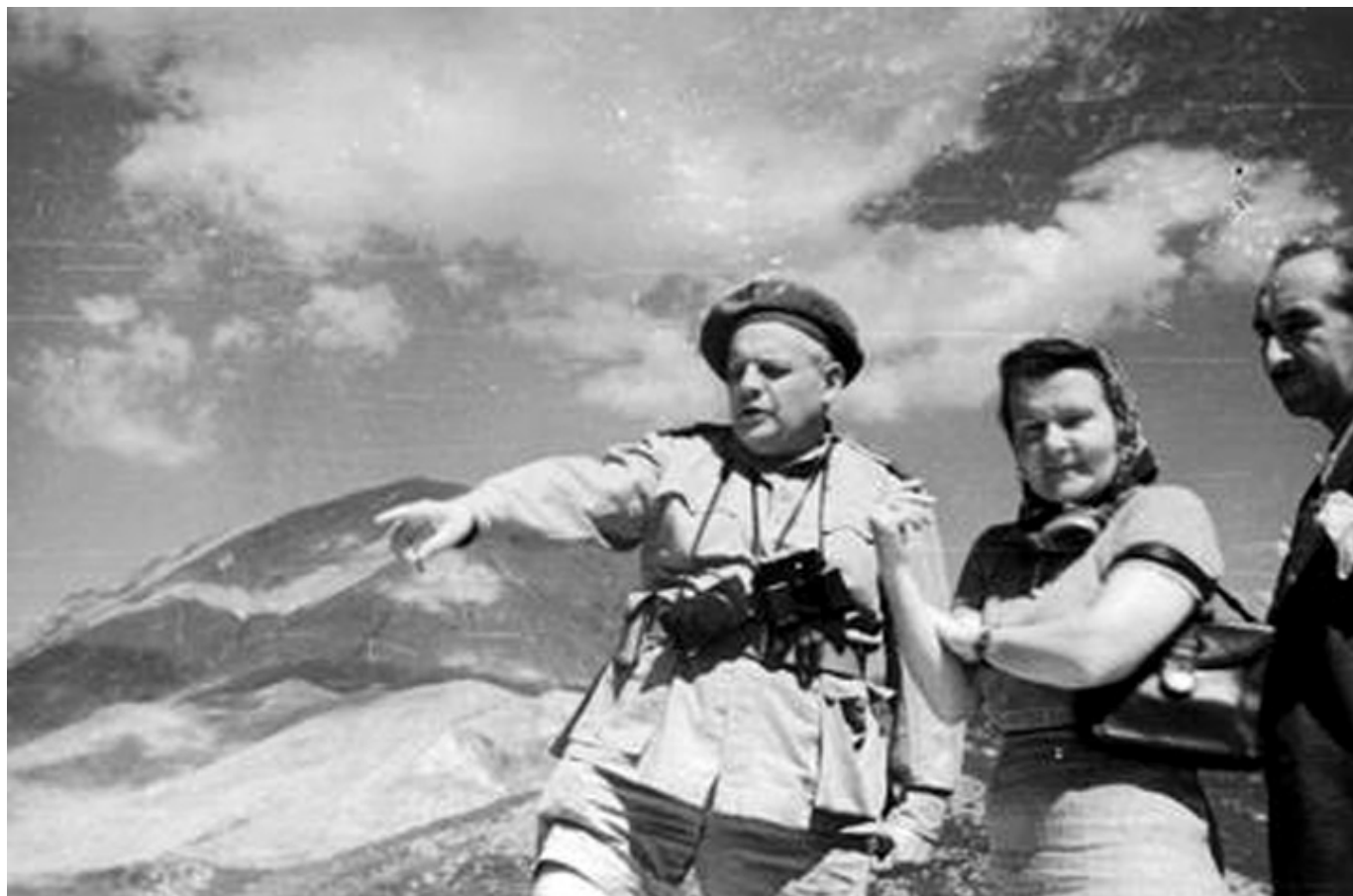
Melchior Wańkowicz, korespondent wojenny 2 Korpusu Polskiego Melchior Wańkowicz (1. z lewej) w towarzystwie nierozpoznanych osób, na szczycie „Widma”. W tle Monte Cairo, fot. Narodowe Archiwum Cyfrowe.

W miarę jednak upływającego czasu nastroje wyraźnie rzedły, chociaż nic konkretnego nie mówiono. Dowiedziałem się, że najciekawiej jest siedzieć w schronie podsłuchu radiowego i tam też przeważną część dnia spędziłem. Zostałem tam już Wańkowicza, który mając niezawodny instynkt dziennikarski utknął w tym podsłuchu od rana, siedział kamieniem pilnie notując. To słuchanie jest rzeczywiście fascynujące, ale mimo bardzo jeszcze dobrego tonu czołgistów wyczuwało się wyraźnie, że optymizm poranny był trochę przedwczesny. Koło południa Niemcy odebrali San Angelo, po paru godzinach nasi znowu tam częściowo wleźli, ale oczyszczenie wzgórza się nie udawało, straty od moździerzy były coraz większe, Karpacka też nie mogła ruszyć dalej. Batalion 6 majora Różyckiego dotarł na 200 m od Albanety i dalej nie mógł się ruszyć. Płynęły długie godziny bez oczekiwanego sukcesu. Przychodzi zapowiedź: o godz: 13.40 piechota rusza do natarcia na Albanetę, tymczasem okazuje się, że w ogniu nie może się ruszyć. Staje się