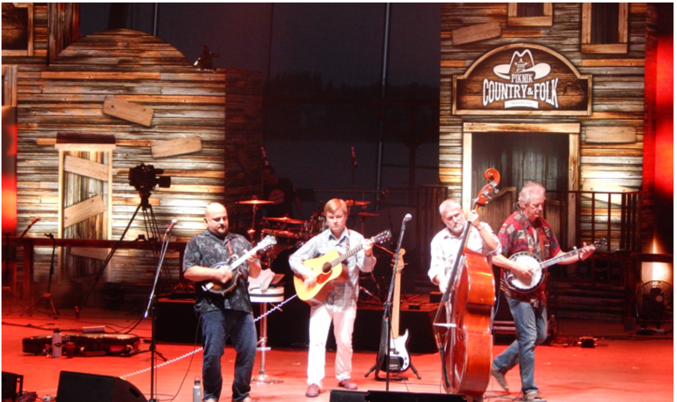
Bluegrass z USA czyli znakomici Frank Solivan & Dirty Kitchen.