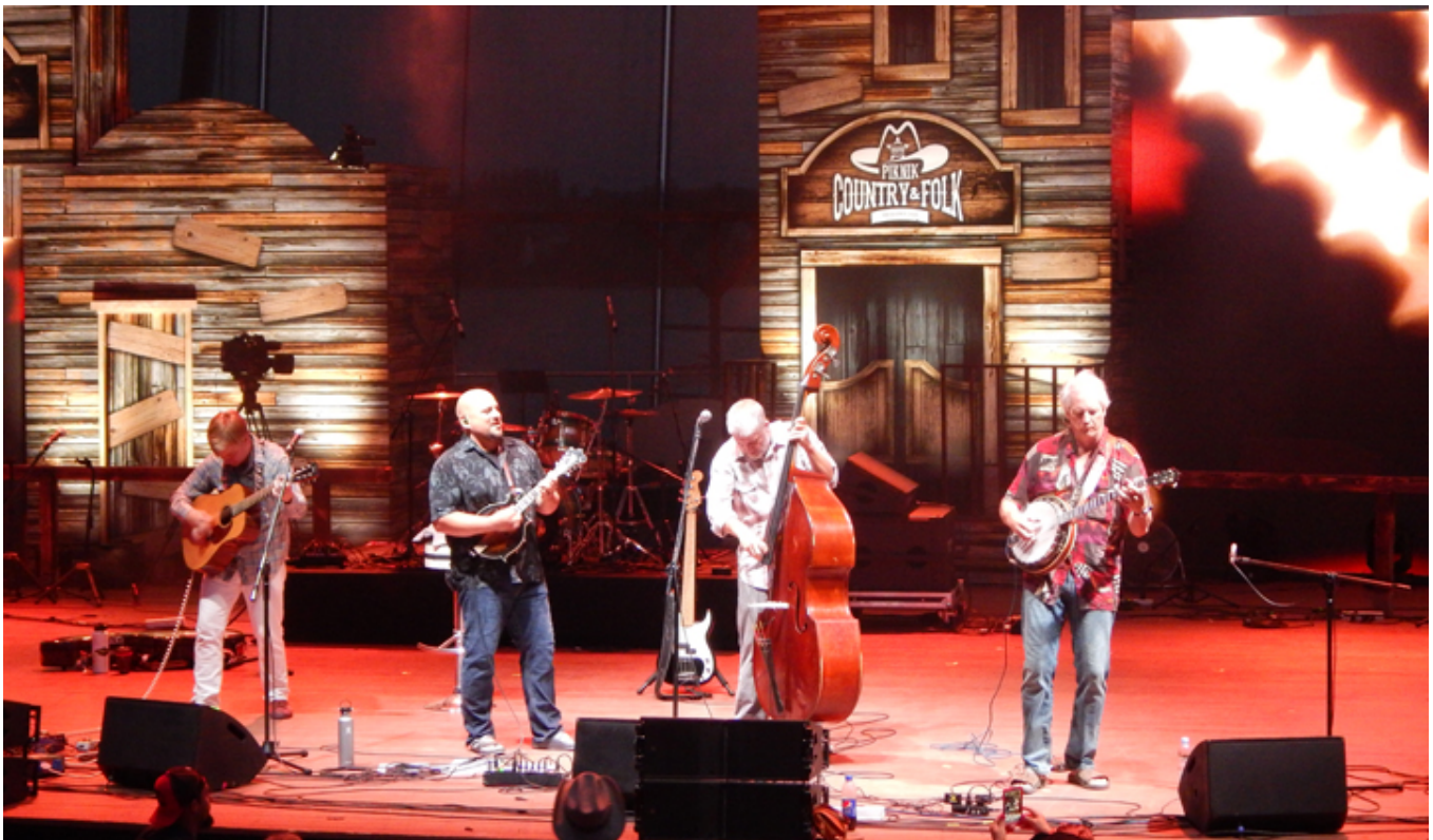
Bluegrass z USA czyli znakomici Frank Solivan & Dirty Kitchen.