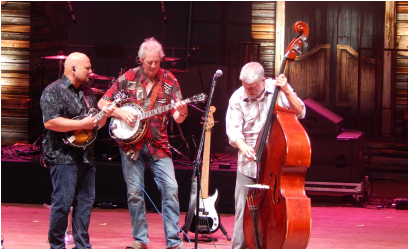
Bluegrass z USA czyli znakomici Frank Solivan & Dirty Kitchen.