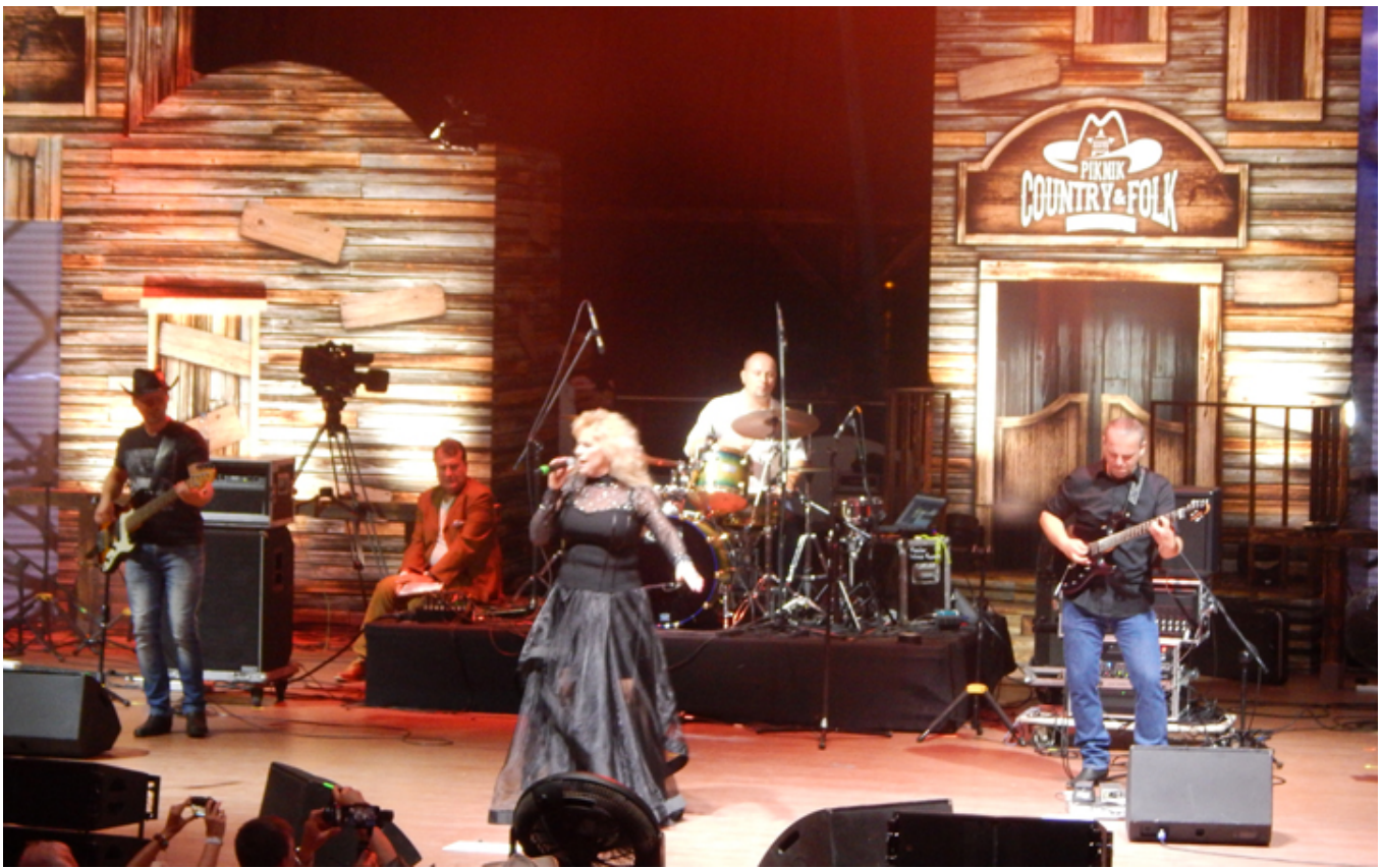
Dama Polskiego country music - Alicja Boncol, koncert z okazji 25-lecia działalności artystycznej.