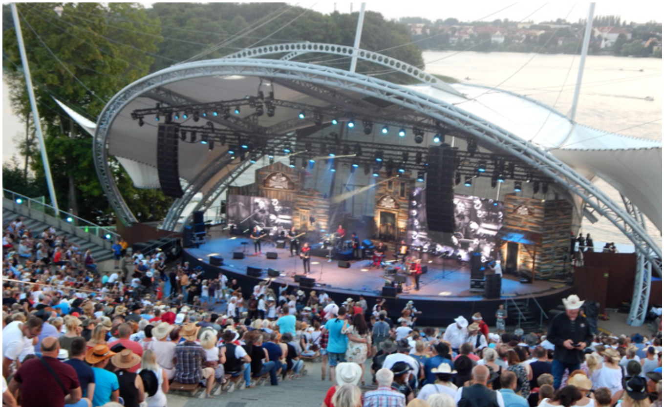
Scena główna - amfiteatr nad jeziorem i koncert w sobotę (28 lipca) wieczorem.