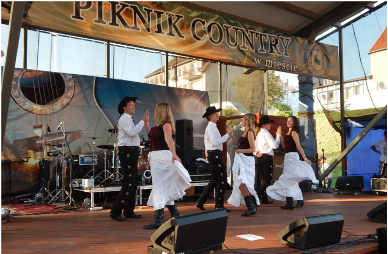
Na małej scenie w mieście, wystąpiła między innymi Grupa Taneczna Strefa Country PL.