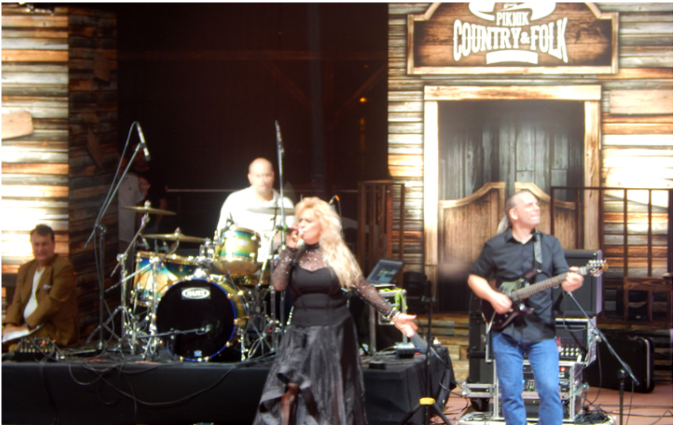
Dama Polskiego country music - Alicja Boncol, koncert z okazji 25-lecia działalności artystycznej.