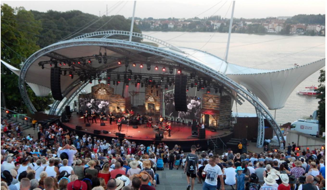
Scena główna - amfiteatr nad jeziorem i koncert w sobotę (28 lipca) wieczorem.