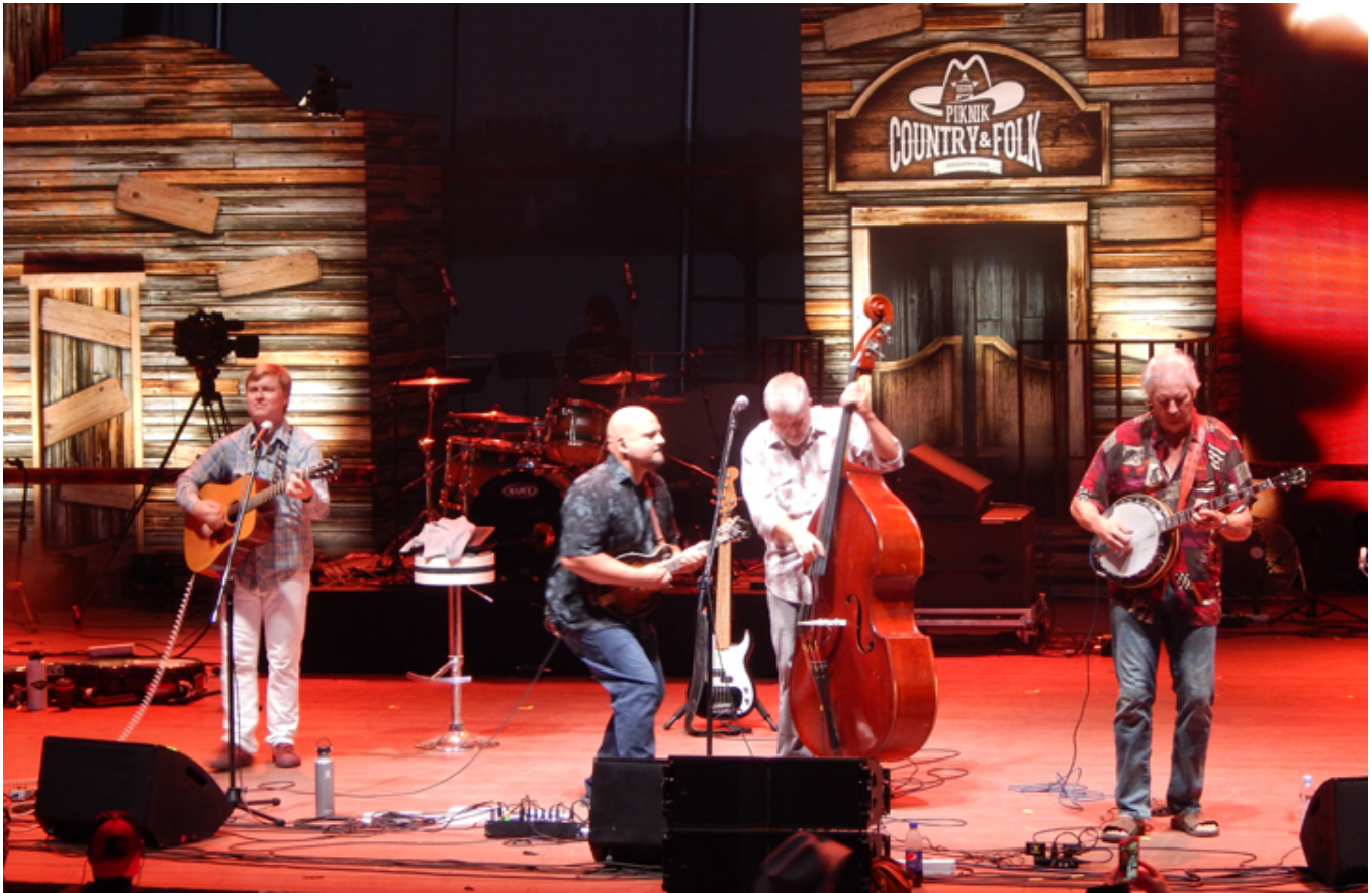
Bluegrass z USA czyli znakomici Frank Solivan & Dirty Kitchen.