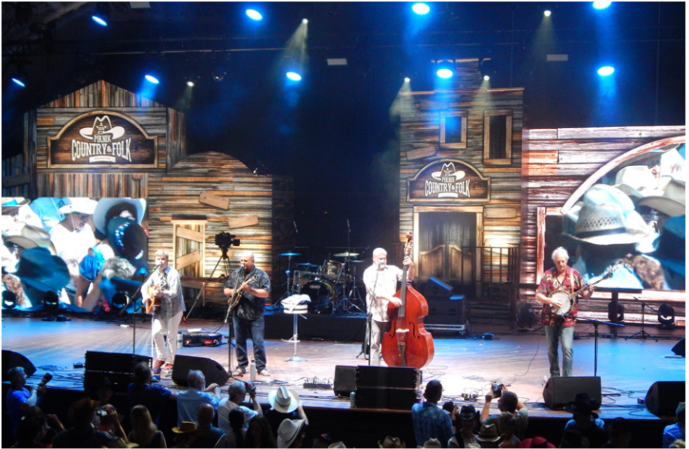
Bluegrass z USA czyli znakomici Frank Solivan & Dirty Kitchen.