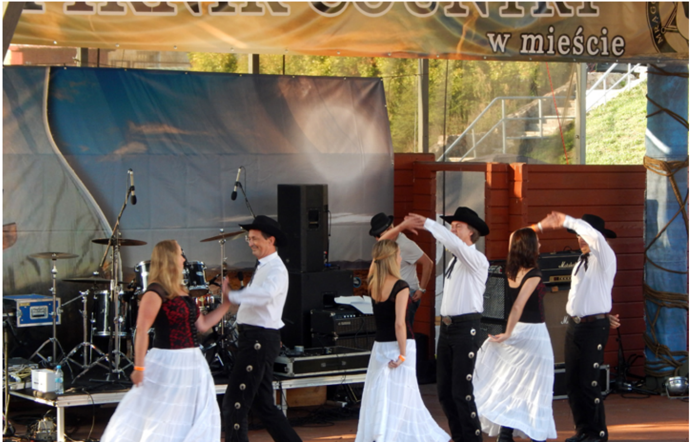
Na małej scenie w mieście, wystąpiła między innymi Grupa Taneczna Strefa Country PL.