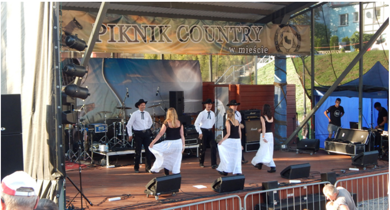
Na małej scenie w mieście, wystąpiła między innymi Grupa Taneczna Strefa Country PL.