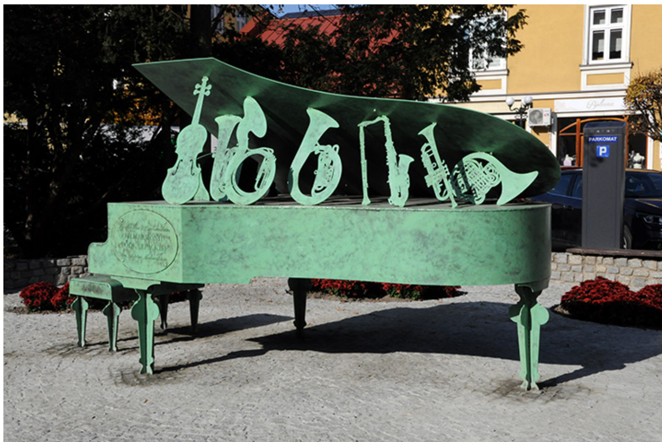
Pomnik poświęcony 60-tej rocznicy Dni Muzyki Kameralnej w Łańcucie