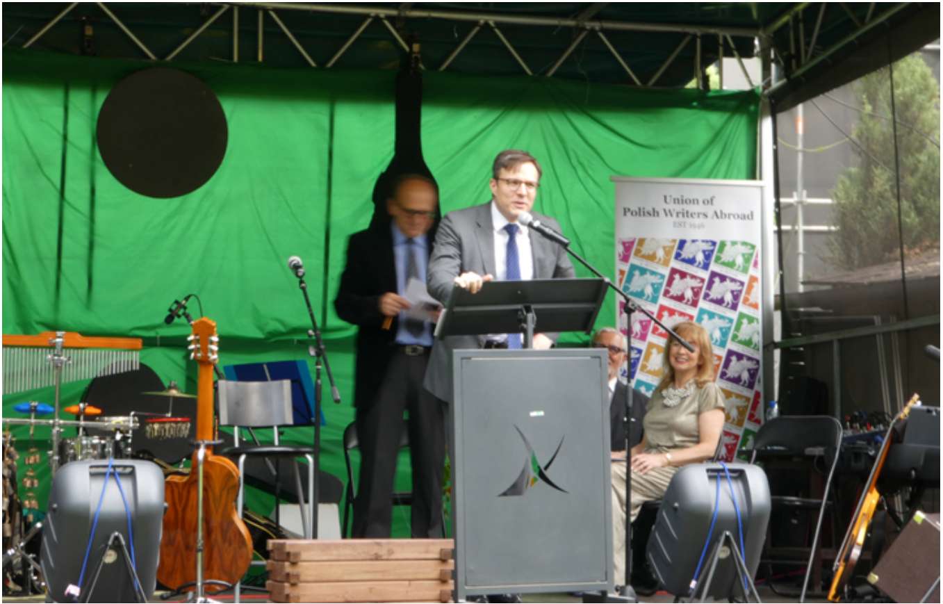
Wystąpienie Leonardo Cleavera de Athayde, Ministra z Ambasady Federacyjnej Republiki Brazylii, fot. Andrzej Sokołowski.