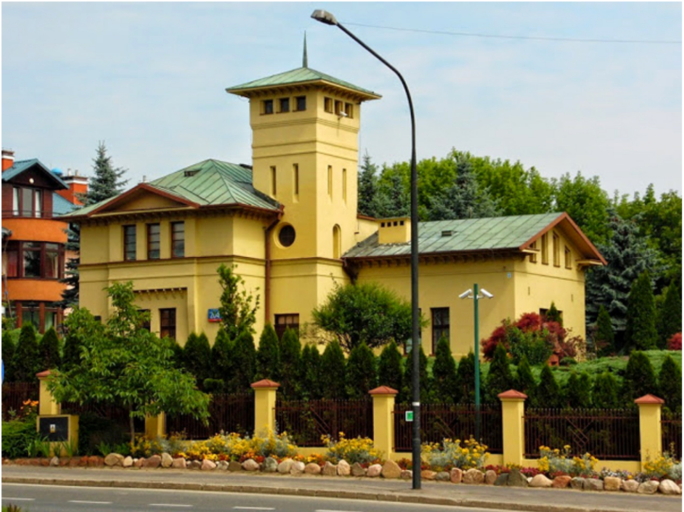
Muzeum Historii Polskiego Ruchu Ludowego mieści się w budynku według projektu Lanciego przy Al. Wilanowskiej 204 w Warszawie.