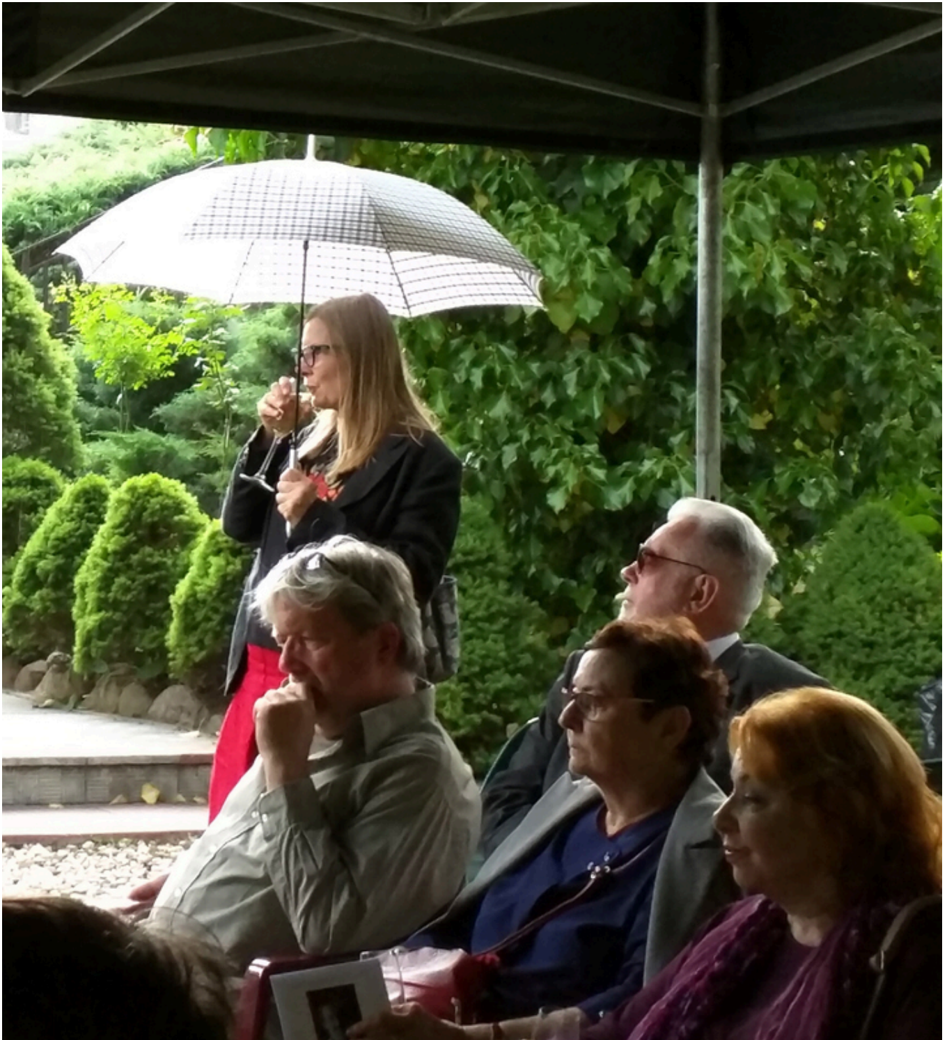
Deszcz sprawił niemiłą niespodziankę, ale nie przeszkodził w uroczystości, fot. Jacek Gwizdka.