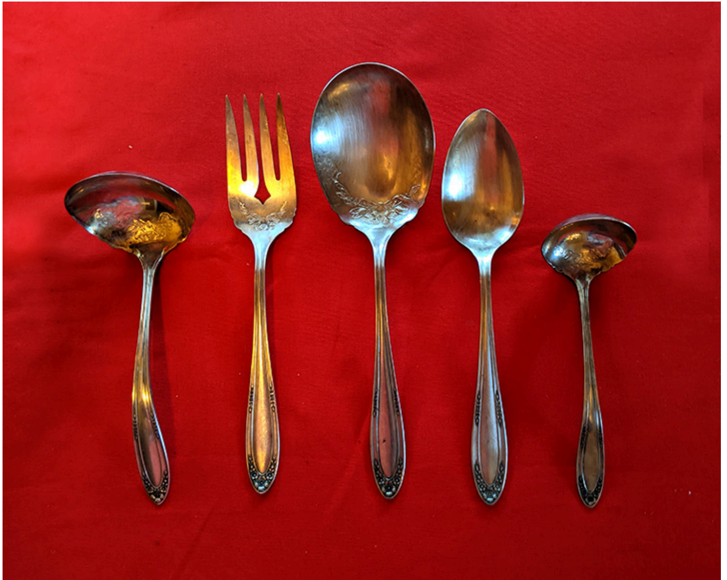
Zestaw srebrnych sztućców Oneida Community „Modjeska” do podawania