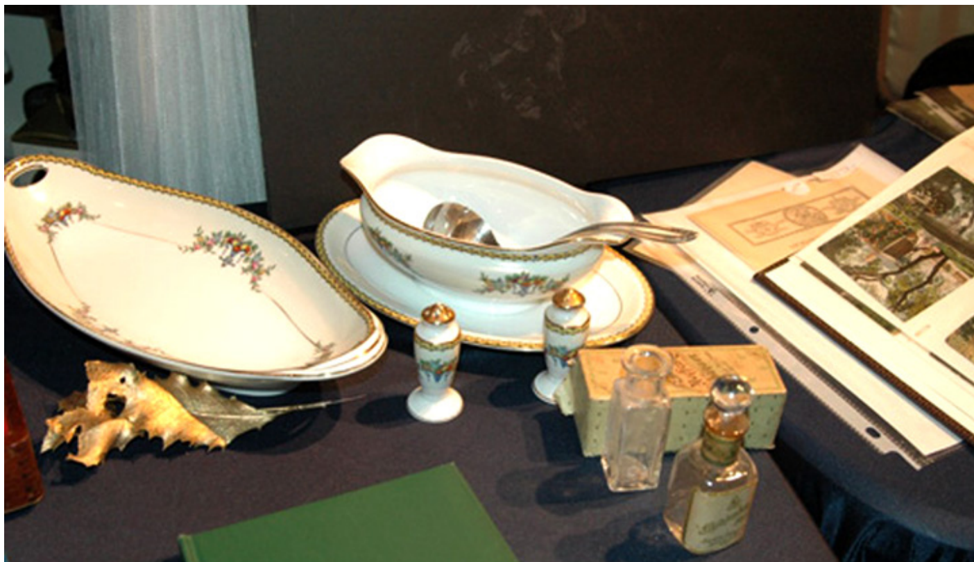
Kolekcja własna przedmiotów związanych z Heleną Modrzejewską, wieczór autorski w Galerii Ryszarda Drucha w Trenton, NJ