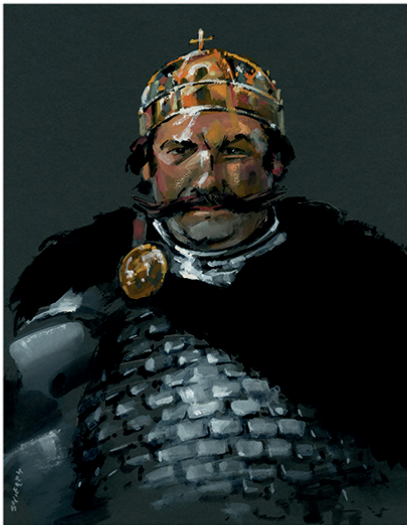
■ Bolesław Chrobry

rysy twarzy. Nadszedł więc czas, by stworzyć nowy poczet, a ściślej rzecz biorąc namalować go. - Jedyną osobą, do której mogłem się zwrócić z takim zadaniem był mój profesor, Waldemar Świerzy, któremu zawdzięczałem tak wiele. To był mój sposób na spłacenie długu. Jako uczeń poprosiłem swojego mistrza o wykonanie tak wielkiego zadania. O tym jak wielkie jest to zadanie jeszcze nie zdawałem sobie sprawy - opowiada Andrzej Pągowski, pomysłodawca projektu.