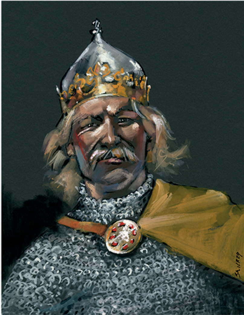
■ Bolesław Krzywousty