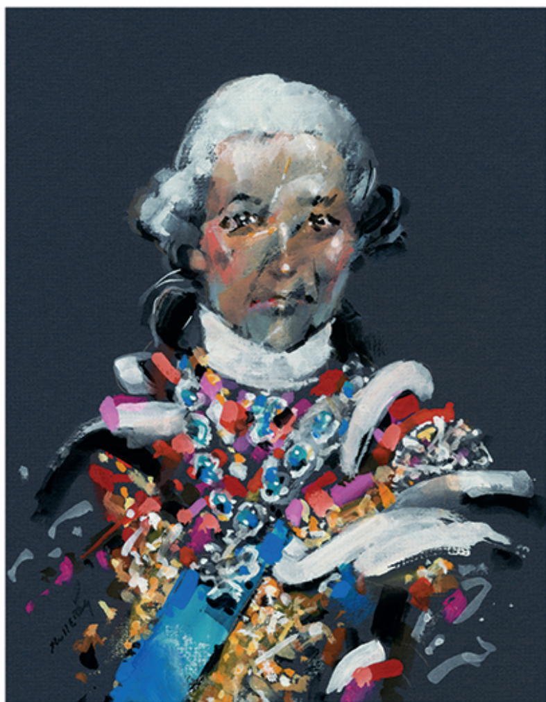
Stanisław August Poniatowski