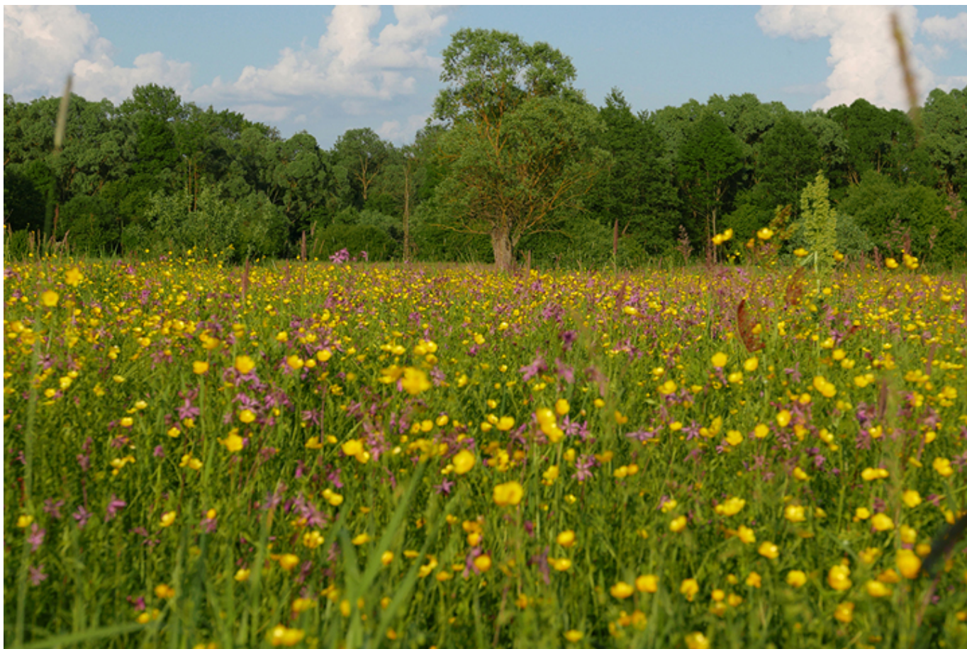
Mościce