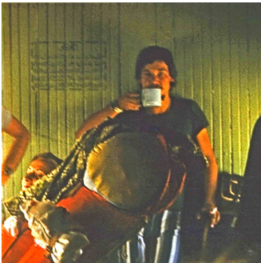
Iran, Zahedan, sierpień 1978 r.