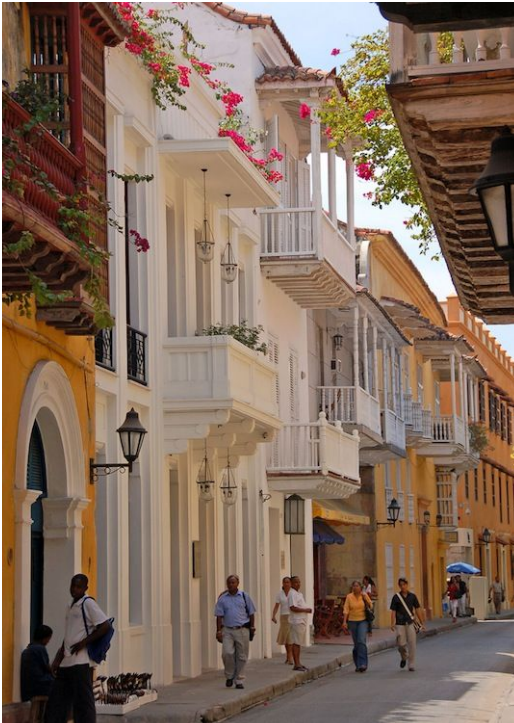
Cartagena de Indias

Lot z Barranquilli do Cartagena de Indias trwa pół godziny i ani się obejrzeliśmy, jak znaleźliśmy się w tym arcyciekawym kolonialnym mieście otoczonym siedemnastowiecznymi murami obronnymi, bastionami i systemem fortec, z których najpotężniejsza, przypominająca jakąś wielką piramidę, zwie się Castillo de San Felipe de Barajas (Zamek św. Filipa z Barajas) na cześć królów hiszpańskich o tym