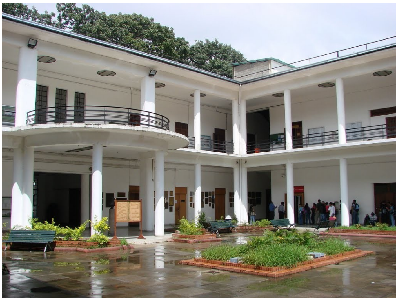
Wyższy Instytut Pedagogiczny w Caracas

Wszystko, co opisałem w niniejszym rozdziale rozegrało się zaledwie w ciągu trzech miesięcy: w maju, czerwcu i lipcu 1972 roku, W sierpniu byłem pochłonięty załatwianiem pracy w Instytucie Pedagogicznym oraz poszukiwaniem mieszkania dla nas obojga po ślubie. Chodziło o to, by zamieszkać jak najbliżej Instytutu. Udało mi się znaleźć trzypokojowe mieszkanie w sześciopiętrowym budynku o nazwie El Marqués (Markiz), przy Avenida Libertador (Alej Wyzwoliciela, czyli Bolívara) na osiedlu La Paz (Spokój), w dzielnicy El Paraíso (Raj), tej samej, w której znajduje się Instytut Pedagogiczny. I to był jedyny plus, bo ostatnie dwie nazwy własne miały, jak się potem okazało, bardzo niewiele wspólnego z rzeczywistością, a zarówno ów Markiz, jak i Wyzwoliciel pewno wiecznie przewracają się do dziś w grobie na myśl, że spotkał ich wielce wątpliwy zaszczyt w owej oazie „rajskiego spokoju”. Nigdy w życiu nie mieszkałem w bardziej hałaśliwym miejscu!