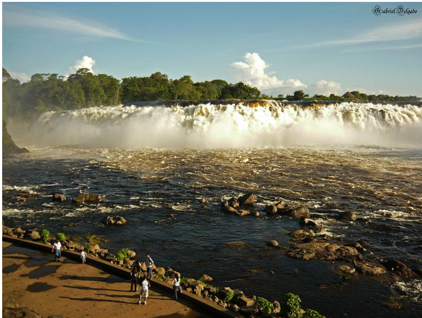
Park La Llovizna

się masy wody tworzą wokół bezustannie padający drobny deszcz. W programie było nawet zwiedzanie nowoczesnej huty żelaza SIDOR, w specjalnych białych kaskach, a jakże! W pobliżu, w Masywie Gujańskim, znajdują się bardzo bogate złoża rudy żelaznej.