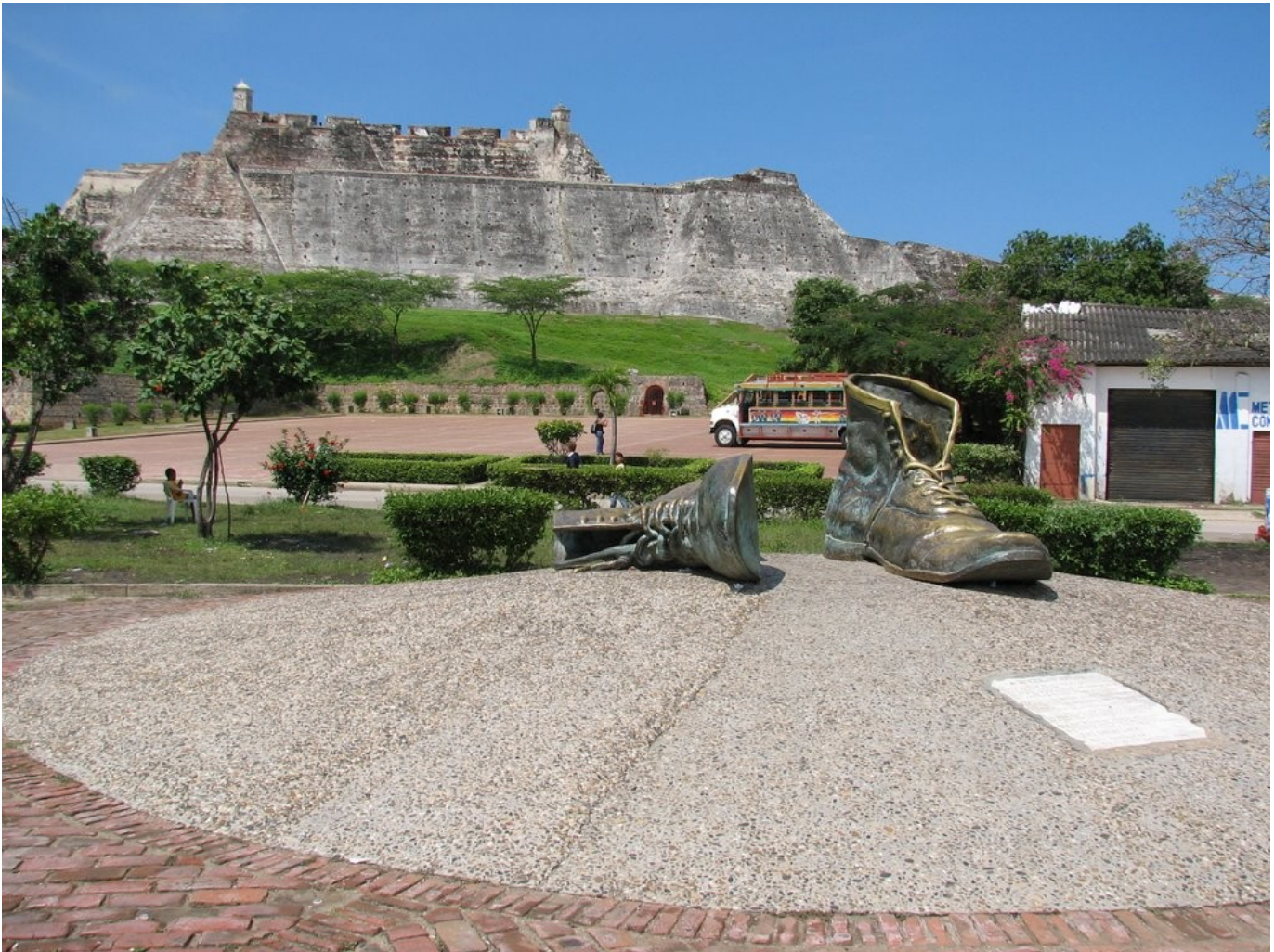
Cartagena, Forteca Św. Filipa z Barajas, pomnik Starych Butów.