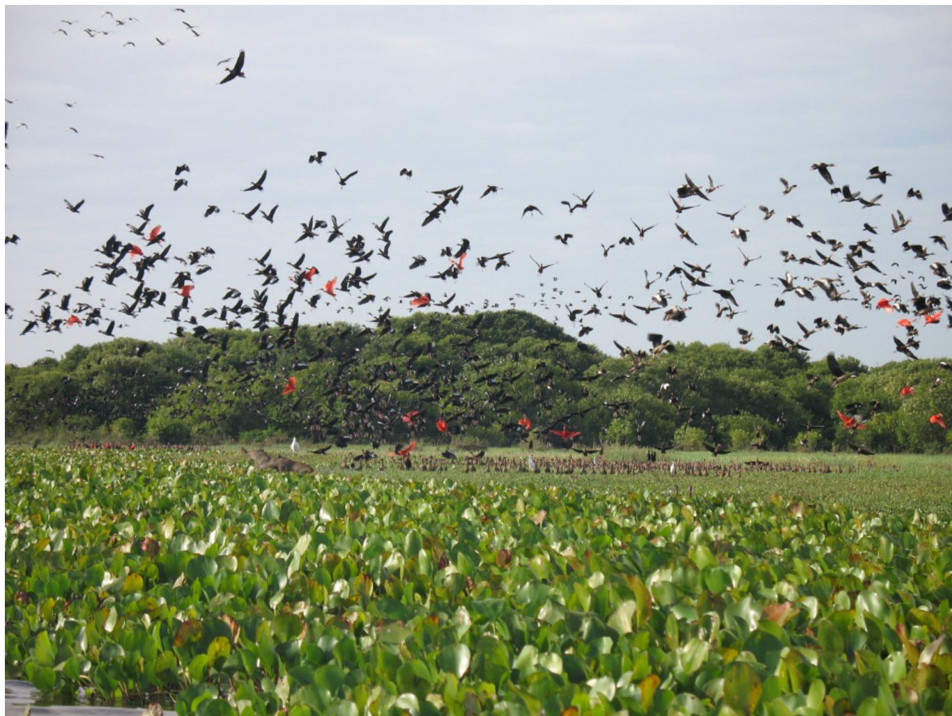
Los Llanos, Venezuela

Wciąż myślałem o powrocie na moje Wielkie Równiny i jakoś mniej więcej w tym okresie wybrałem się sam do stolicy stanu Guárico, San Juan de los Morros, gdzie odwiedziłem Dom Kultury, a potem dotarłem w okolice El Sombrero i pewien przypadkowo spotkany farmer argentyńskiego pochodzenia oprowadził mnie trochę po swoich włościach. To wtedy zobaczyłem na gałęzi drzewa długiego, intensywnie zielonego pięknego węża, który w Wenezueli zwany jest verdegallo , verdegay (zieleniec) albo lora (zielona papuga), a jego łacińska nazwa brzmi Leptophis ahaetulla . Osiąga prawie dwa metry długości i nie jest jadowny.