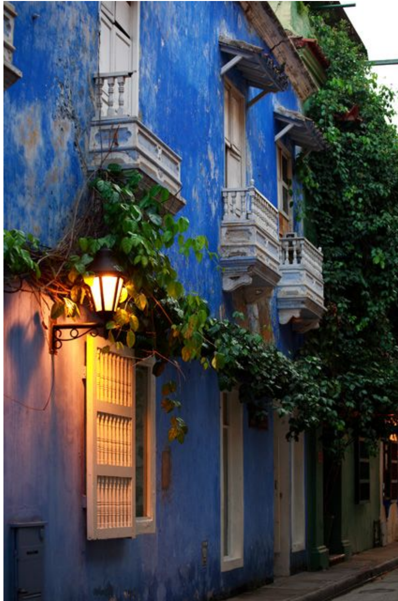
Cartagena de Indias