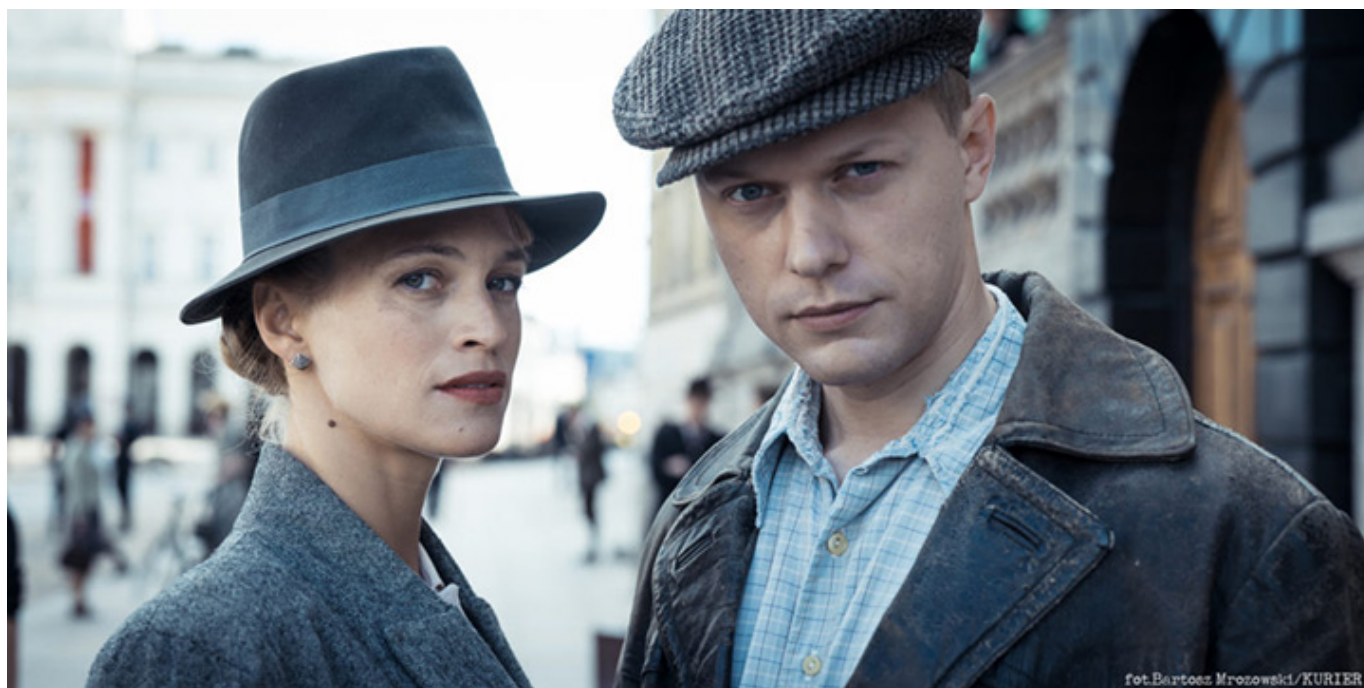
Kadr z filmu „Kurier”, fot. Bartosz Mrozowski.

Film ten ma być przede wszystkim dobrą przygodą, rozrywką, z elementami kina akcji czy kina szpiegowskiego. Wspomniała Pani o Indiana Jonesie. To jest według mnie dobre porównanie, bo w „Kurierze” jest dużo lekkich scen, robionych z dużym poczuciem humoru. Jest też wiele wymyślonych epizodów, jak na przykład wątek związany z agentką Doris.