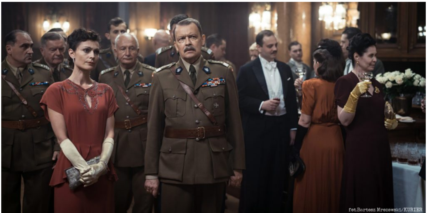
Kadr z filmu „Kurier”, To bardzo dojrzała wypowiedź.

W pewnym sensie. Główny bohater dostaje rozkaz, z którym się nie zgadza. Kreuje sobie antytezę i dąży do celu, żeby realizować ten drugi scenariusz. Ta sytuacja pokazuje zresztą, jak skłócona była wtedy władza. Później, kiedy Nowak-Jeziorański spotyka młodych ludzi już uzbrojonych i orientuje się, że powstania nie da się zatrzymać, dochodzi do wniosku, że trzeba się poddać losowi i na spotkaniu z dowódcami AK wypowiada opinię, która tak naprawdę zgadza się z tym pierwszym rozkazem. Ta opinia jest „post-powstańcza”, to znaczy ten dialog nie miał historycznie nigdy miejsca w takiej formie, to już jest powiedziane z perspektywy. Ale merytorycznie wszystko się zgadza.