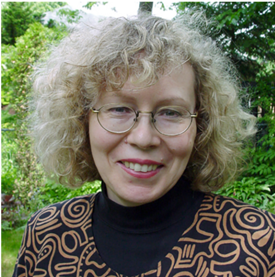
Ewa Stachniak