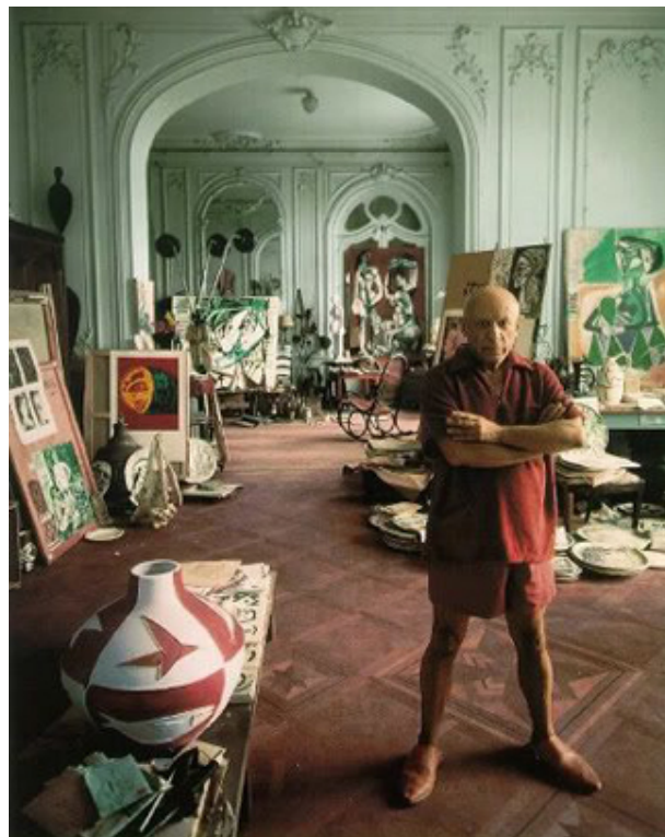
Pablo Picasso w swojej pracowni, fot. pinterest.

ROZMYŚLANIA O PIĘKNIE, SZTUCE I ARTYSTACH