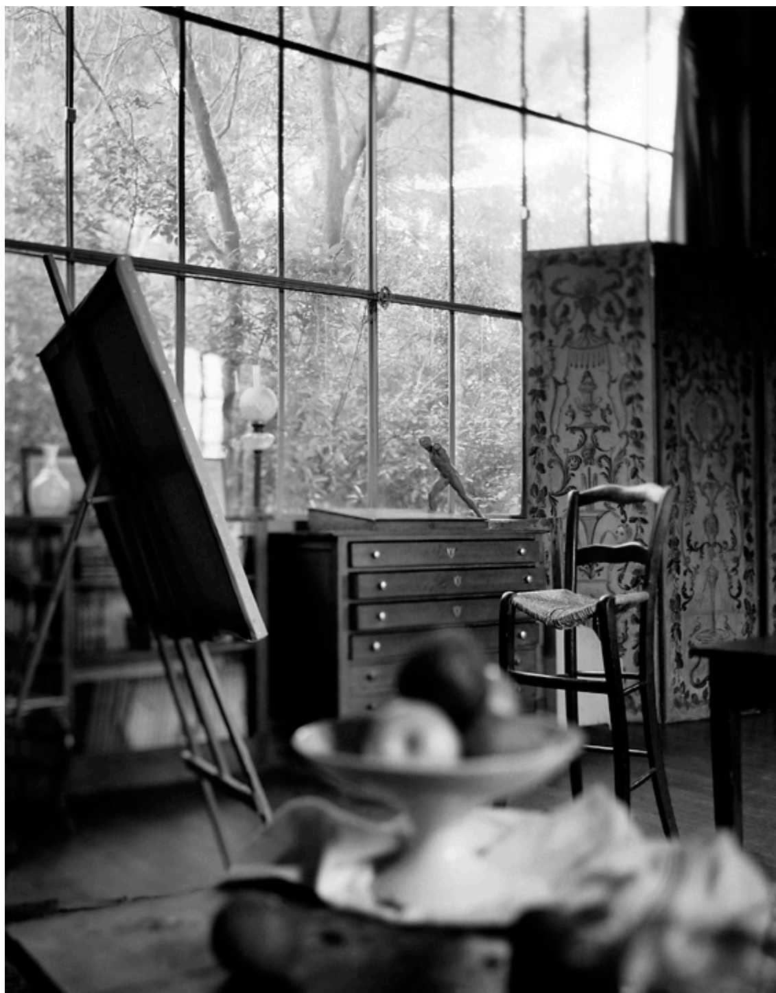
Atelier Paula Cézanne'a, w Prowansji, fot. Neil Folberg.