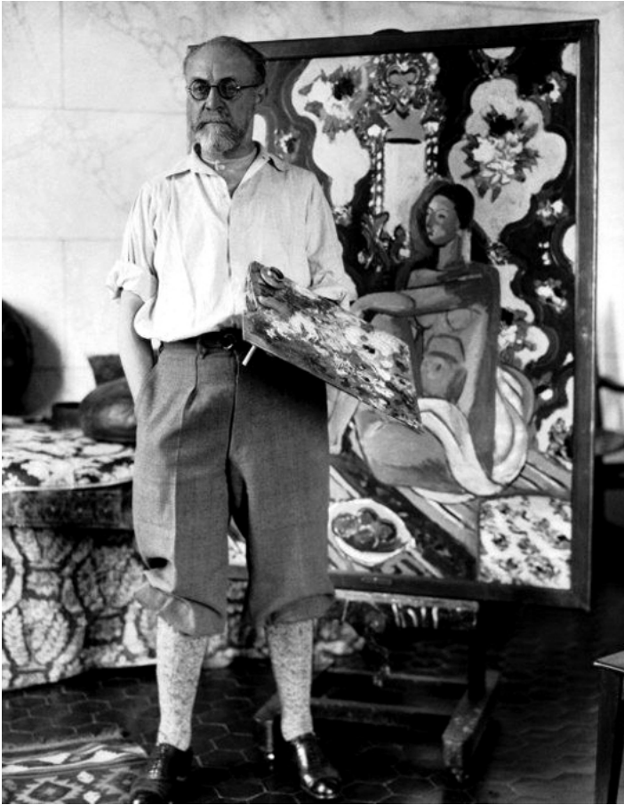
Henri Matisse w swojej pracowni

W tym procesie wędrówki, rozwoju, poszukiwania siebie przez zadawanie fundamentalnych pytań, pomagają nam właśnie artyści, którzy niepokoją nas, chcą z nami dialogować przez swoje dzieła, chcą nam coś opowiedzieć. Spotkanie z dziełem sztuki nie zawsze jest „miłością od pierwszego wejrzenia” – wymaga skupienia, by odszyfrować kod, w jakim przekazał nam twórca swoją koncepcję, wymaga wysiłku, by zrozumieć i nawiązać dialog z pracą.