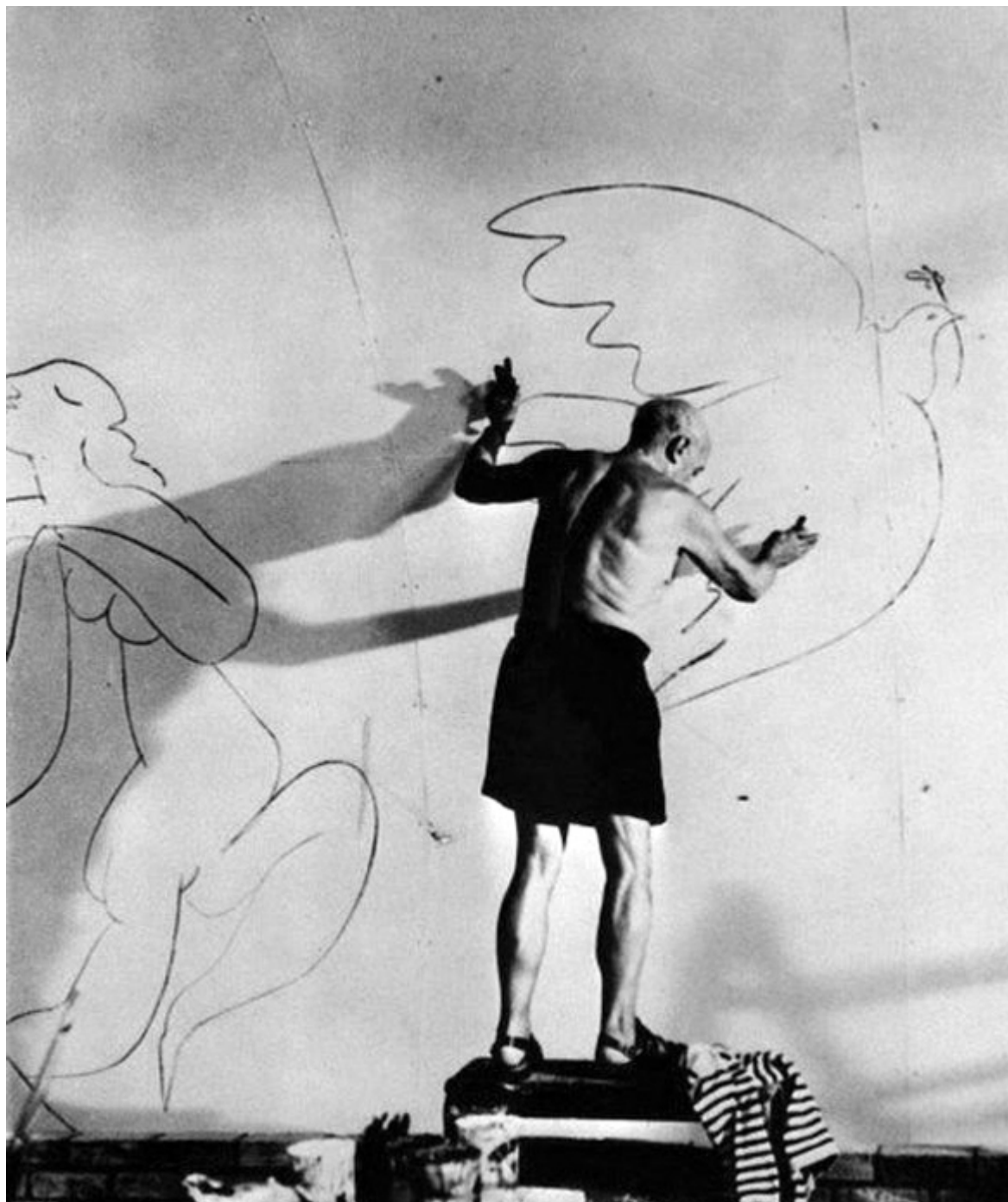
Pablo Picasso przy pracy, fot. pinterest.