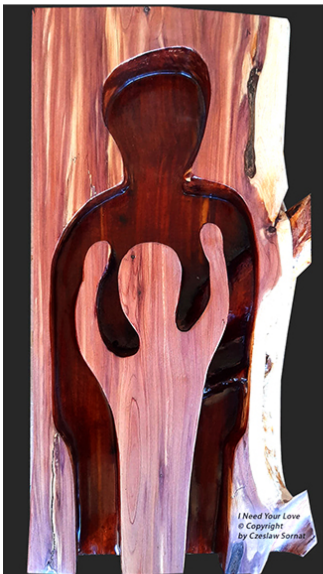
I Need Your Love © Copyright by Czeslaw Sornat