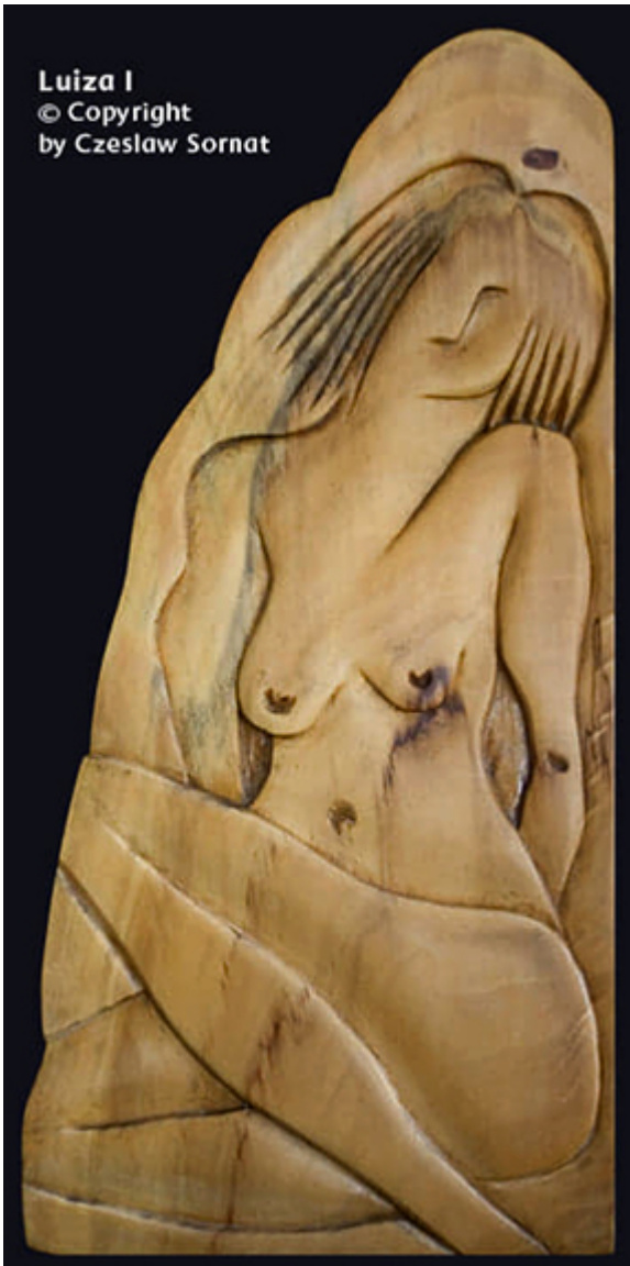
Luiza I