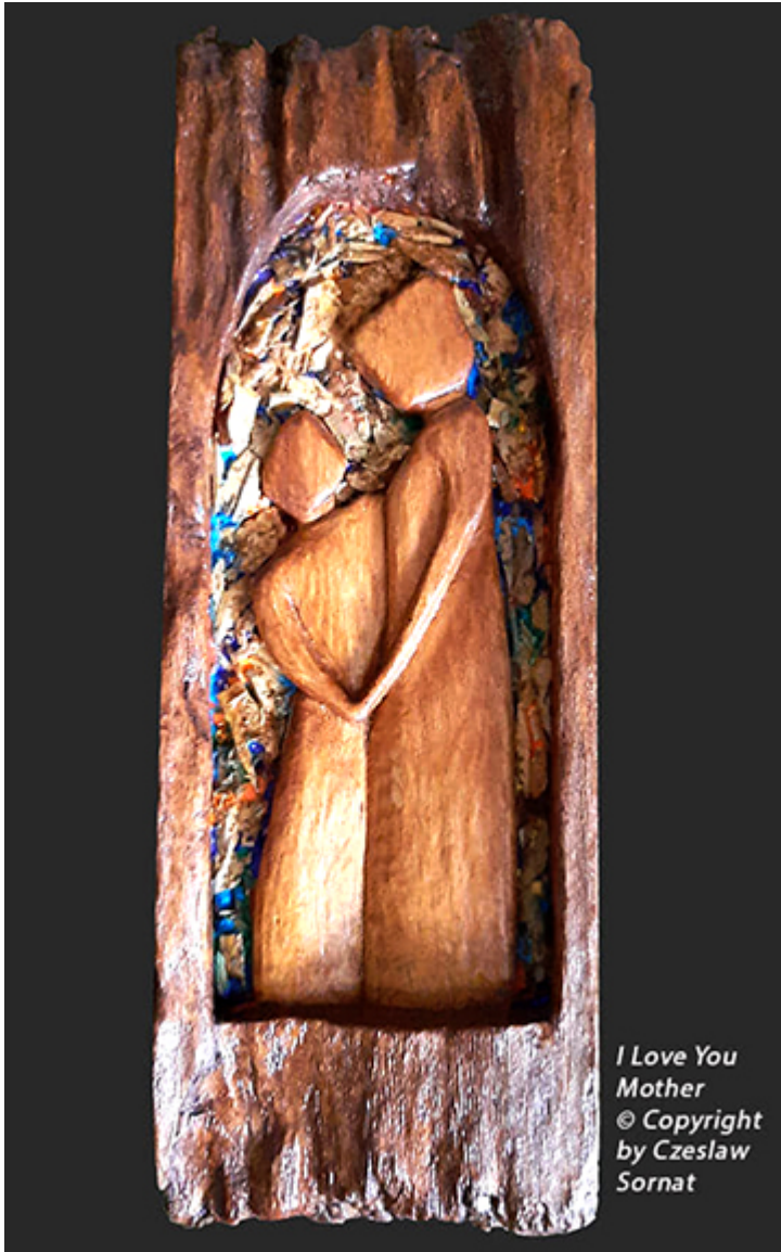
I Love You Mother