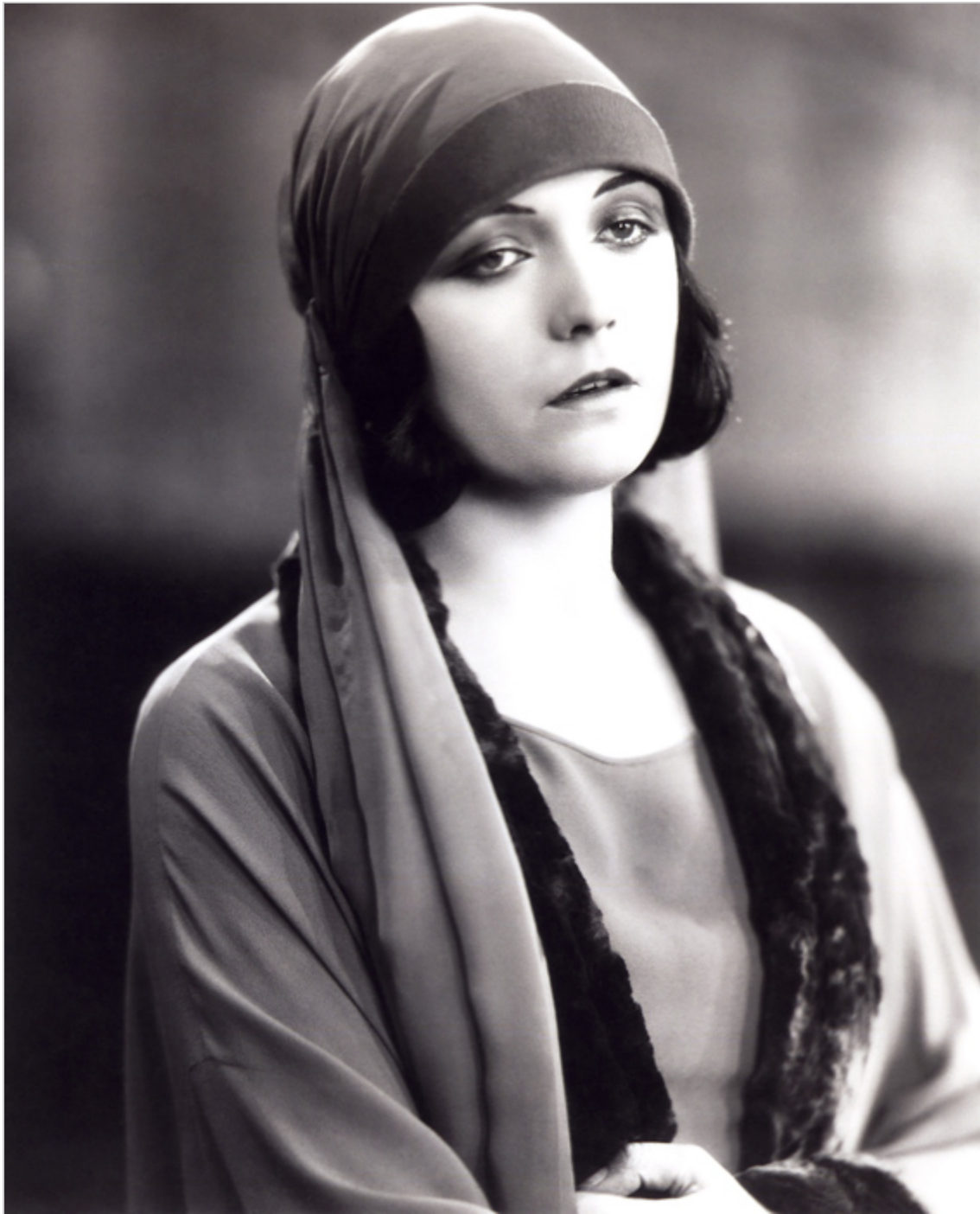
Pola Negri, 1920 r.

Partnerami Poli było wielu wybitnych polskich aktorów w tym: Józef Węgrzyn, Junosza Stępowski i Władysław Grabski. Polę zauważyła również alfa i omega światowego filmu, wytwórnia