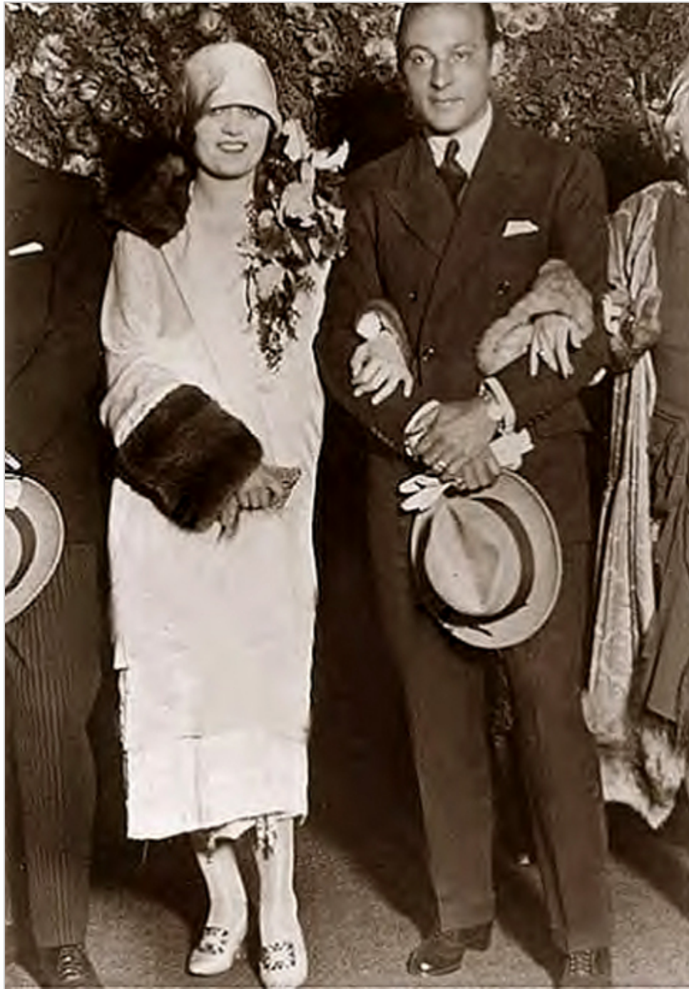
Pola Negri i Rudolf Valentino

Przyjęła zaproszenie na jeden z niezliczonych bali maskowych. Brylował tam Rudolf Valentino - idol i bożyszcze kobiet. - Może