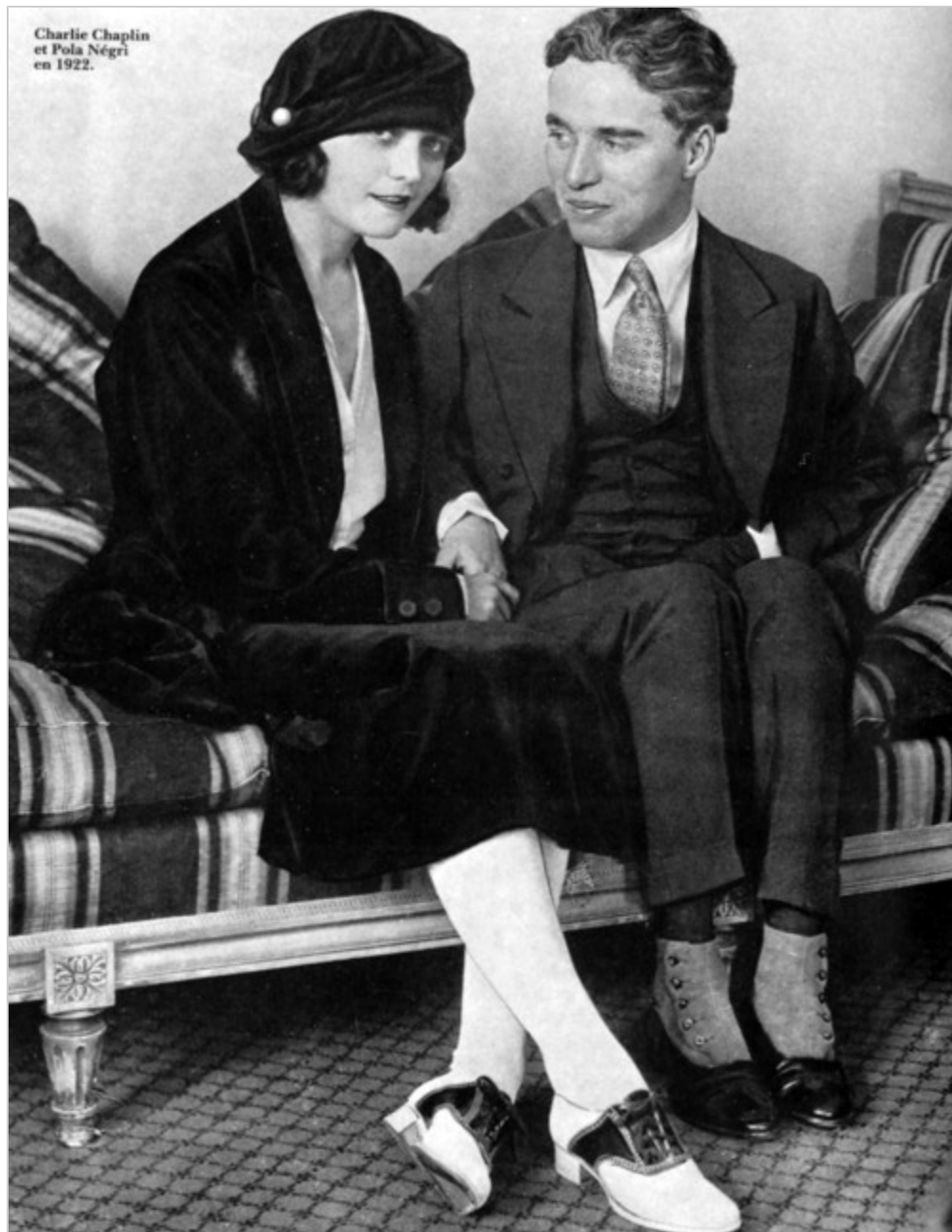
Pola Negri i Charlie Chaplin 1922 r.

W 1923 roku Pola miała wypadek samochodowy. Zderzyła się z limuzyną Chaplina. Jeszcze tej samej nocy Chaplin wysłał pod jej dom orkiestrę Hawajską. Błyskawicznie stali się najślawniejszą parą Ameryki. „Król komików” nie miał łatwego charakteru. Był