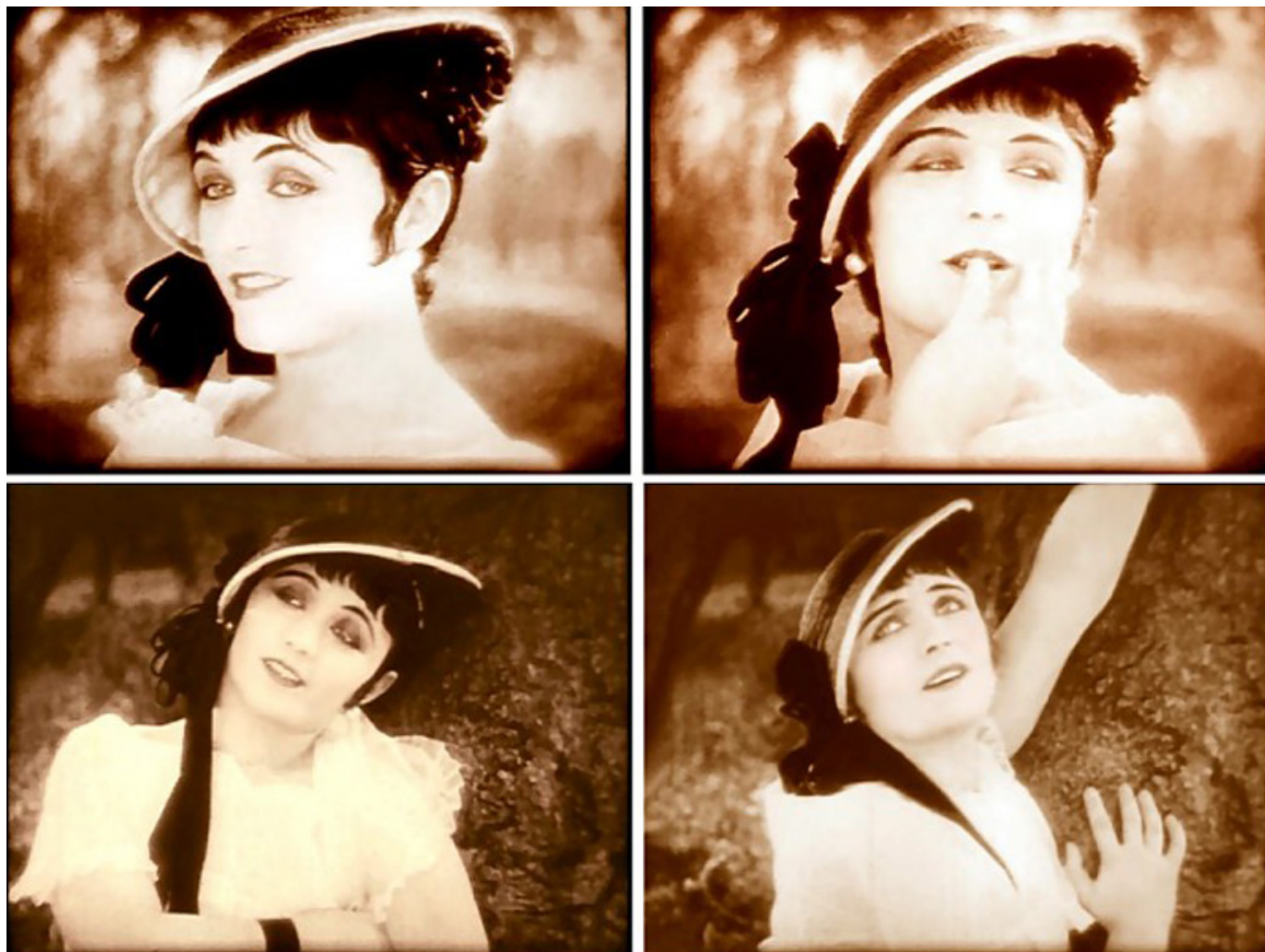
Pola Negri w filmie „A Woman of the World” (1925 r.)

A sytuacja Poli nie przedstawiała się różowo. Nie miała po co wracać do Hollywood. Na „wdowę po Rudolffie” nie czekały żadne kontrakty. Krach na giełdzie dobił Polę finansowo. W okna zastukało ubóstwo. I wtedy na pomoc Poli Negri ruszyła III Rzesza. Właśnie opuściła Niemcy Marlena Dietrich. UFA na gwałt potrzebowała nowej gwiazdy. Hitler uwielbiał Polę jeszcze z czasów przedkanclerskich.