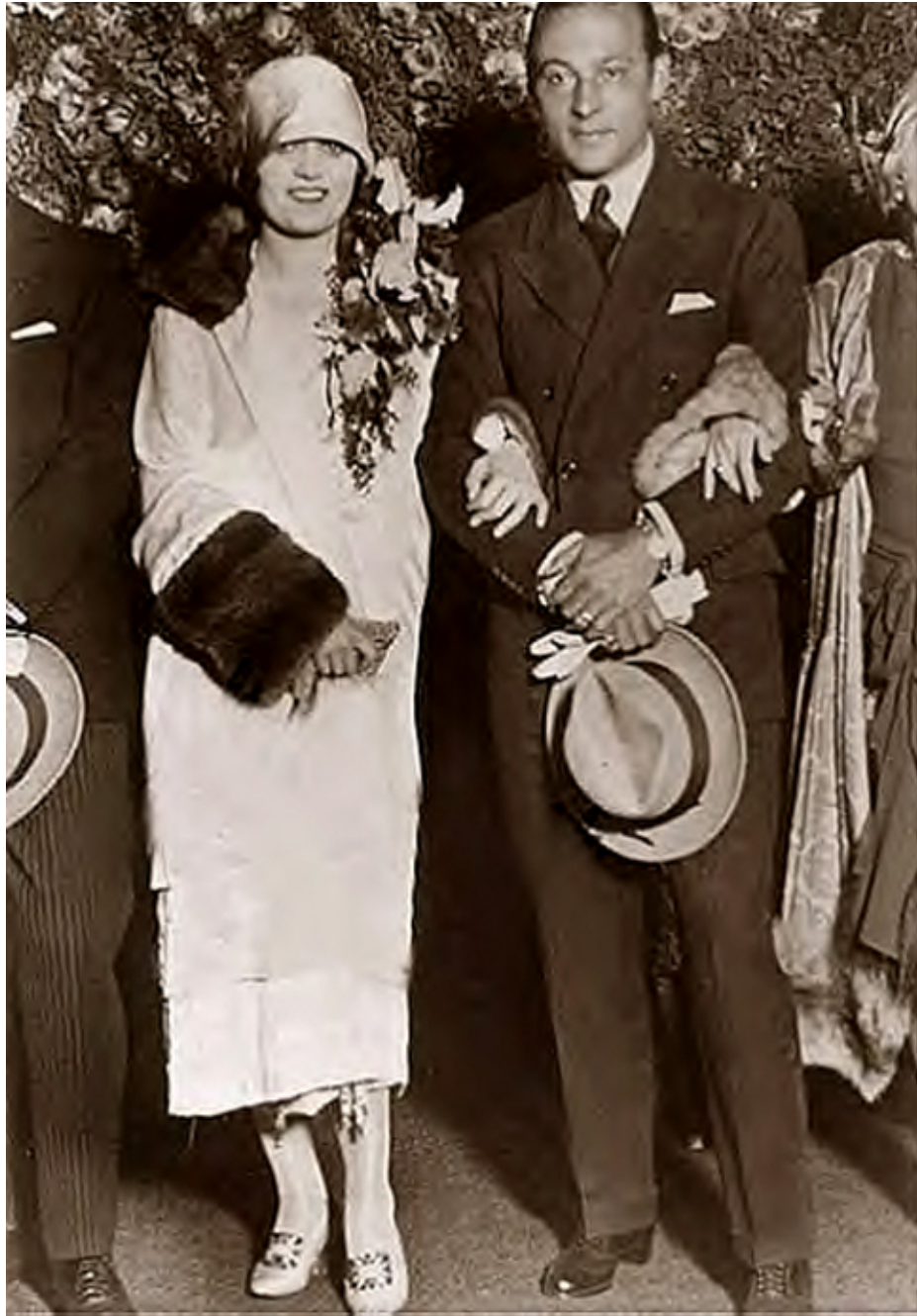
Pola Negri i Rudolf Valentino

Przyjęła zaproszenie na jeden z niezliczonych bali maskowych. Brylował tam Rudolf Valentino – idol i bożyszcze kobiet. – Może udamy zakochanych? – zaproponował. I zakochali się na umór.