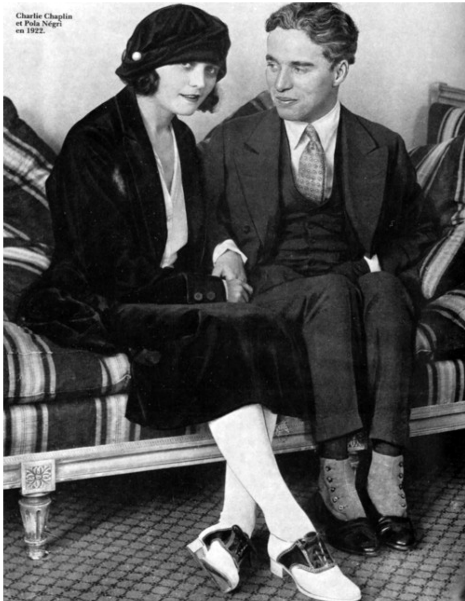
Pola Negri i Charlie Chaplin 1922 r.

czasach. W historię Hollywood Pola wpisała się filmem „Zakazany Raj” – ukazującym losy Katarzyny Wielkiej. To uderzyło w strunę amerykańskich sufrażystek. Krytyka uznała „Zakazany Raj” za czołowy film 1925 roku.