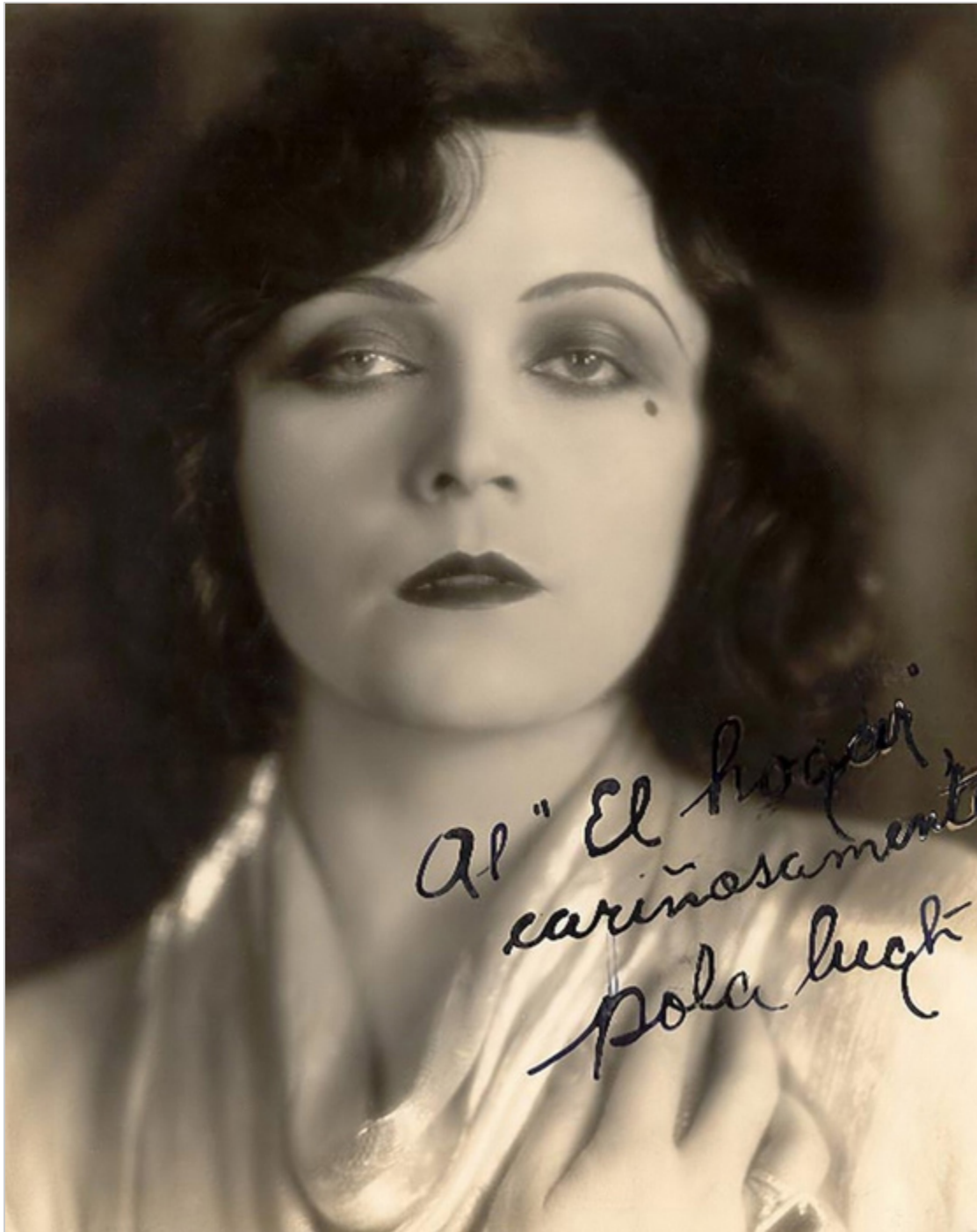
Pola Negri, 1920 r.