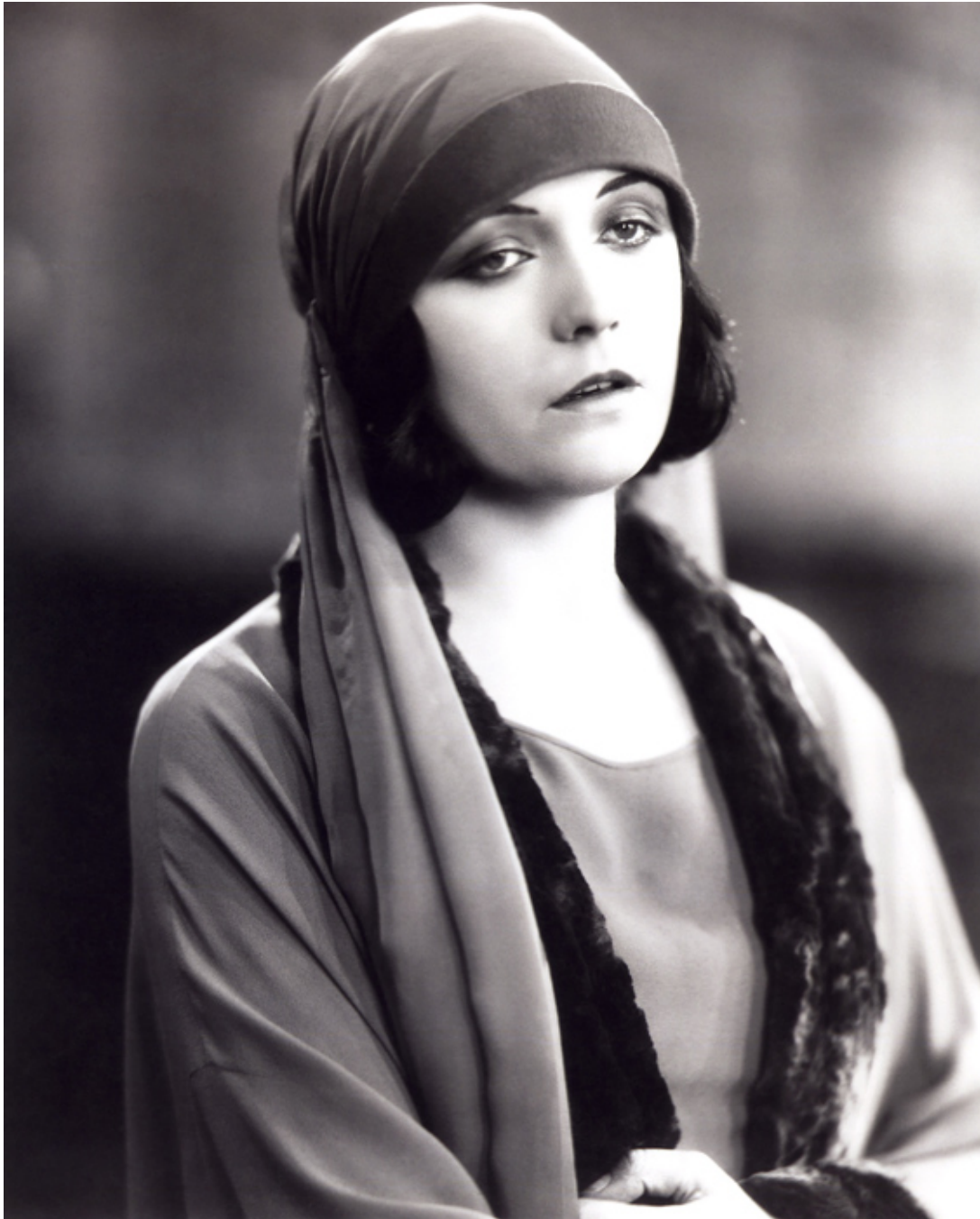
Pola Negri, 1920 r., fot. theredlist.com

- To była absolutna ironia losu - pisała Pola. - Ja, która nie zabiłabym muchy grałam role demonicznych kobiet, o perwersyjnych charakterach, będących synonimem zła i grzechu.