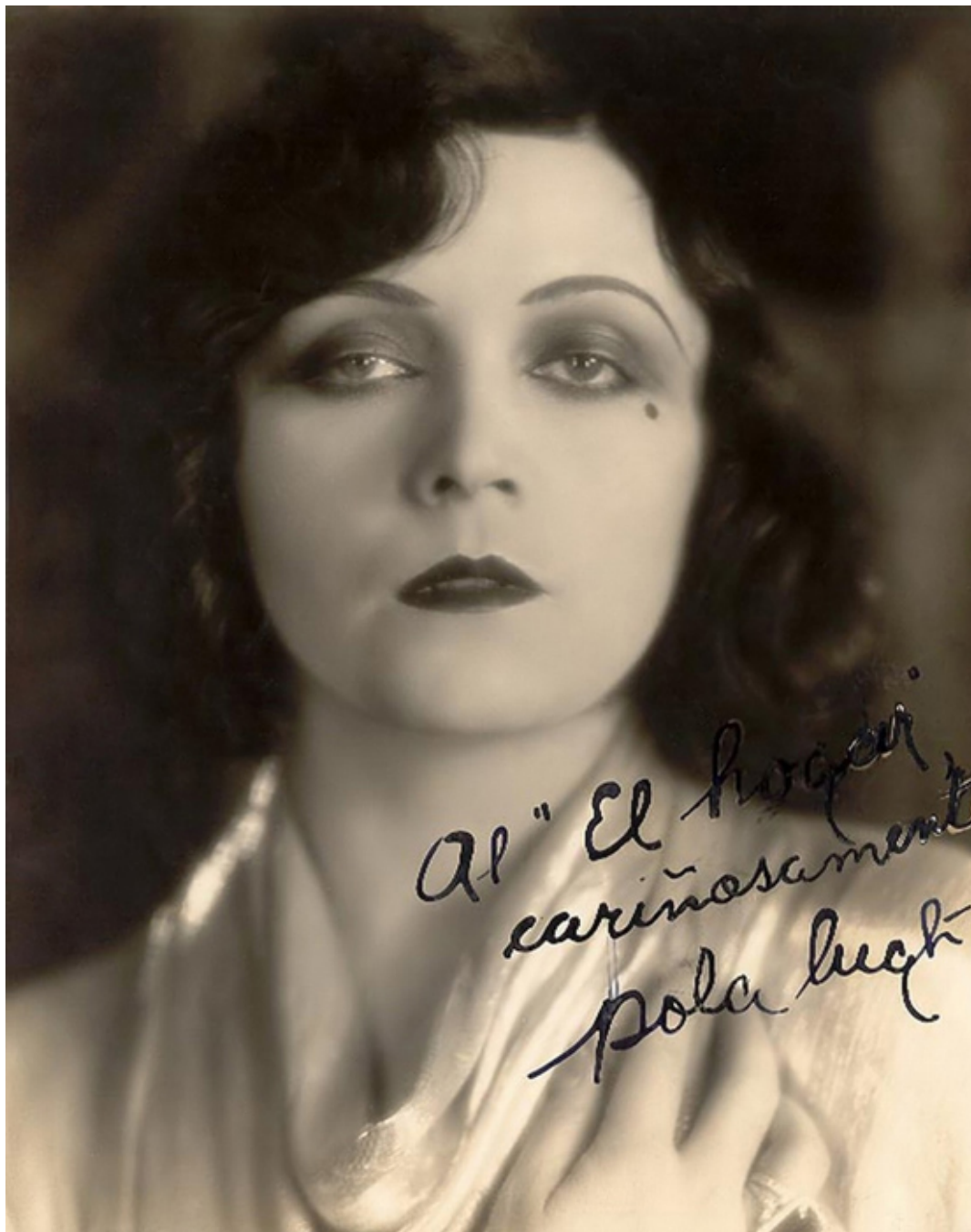
Pola Negri, 1920 r.