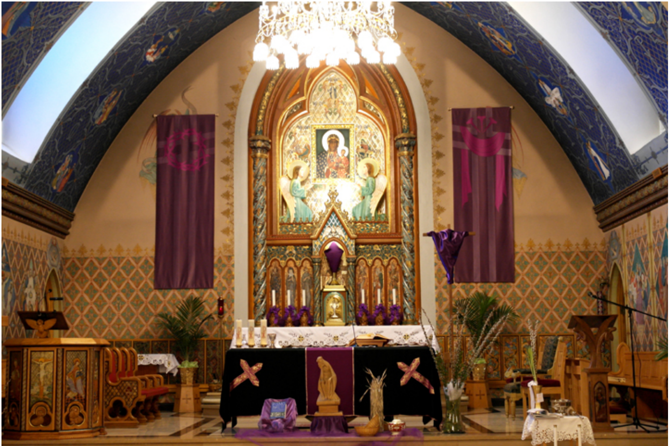
Kościół pod wezwaniem Matki Boskiej Częstochowskiej w Montrealu.