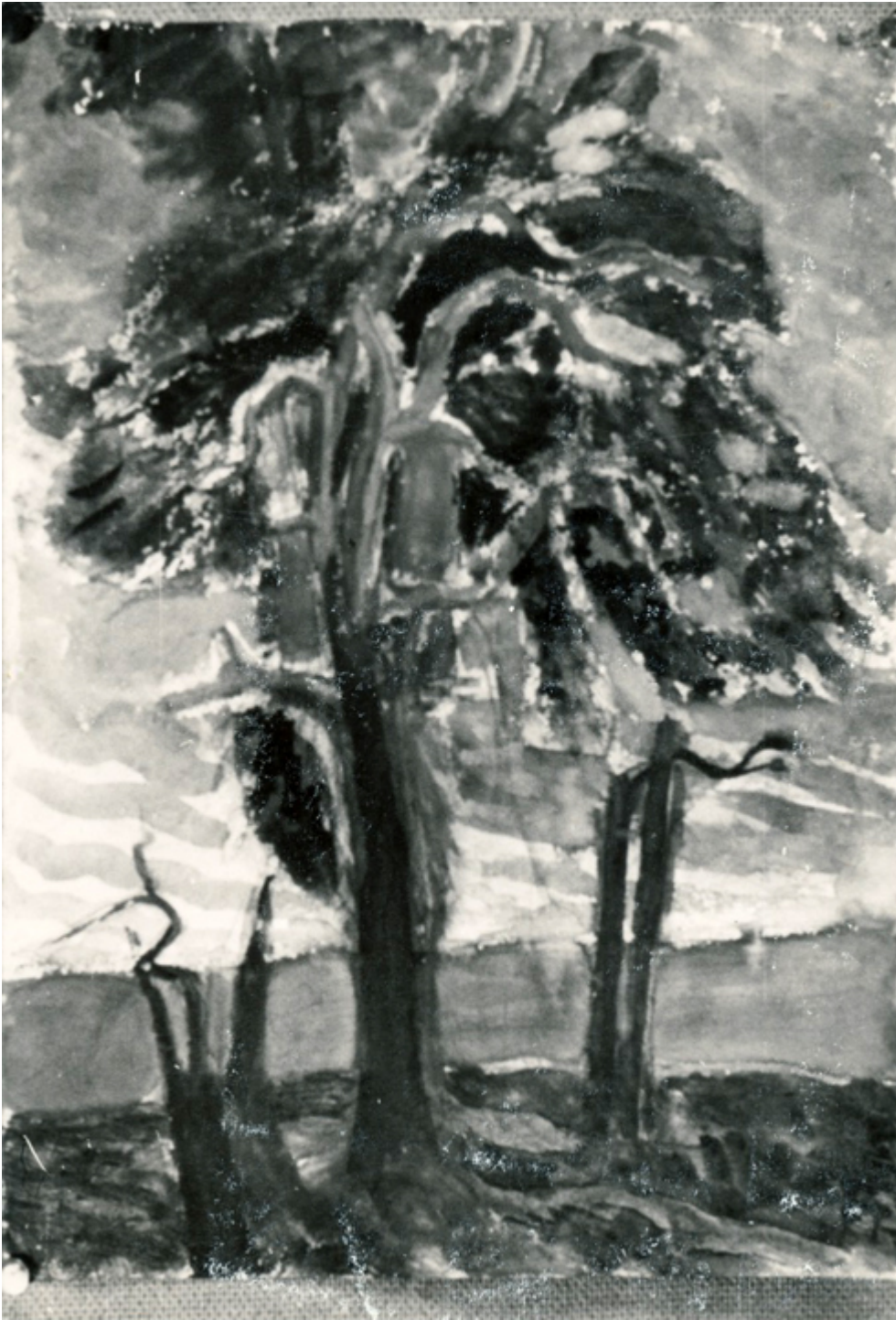
Wojciech Jastrzębowski, Pejzaż z drzewem, olej, ok. 1947 r., fot. arch. Haliny Jastrzębowskiej-Sigmunt.