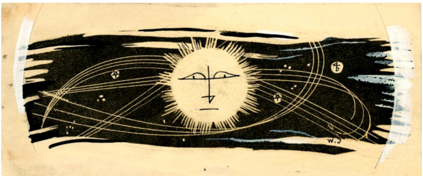
Przerywnik - „Słońce”, rysunek tuszem