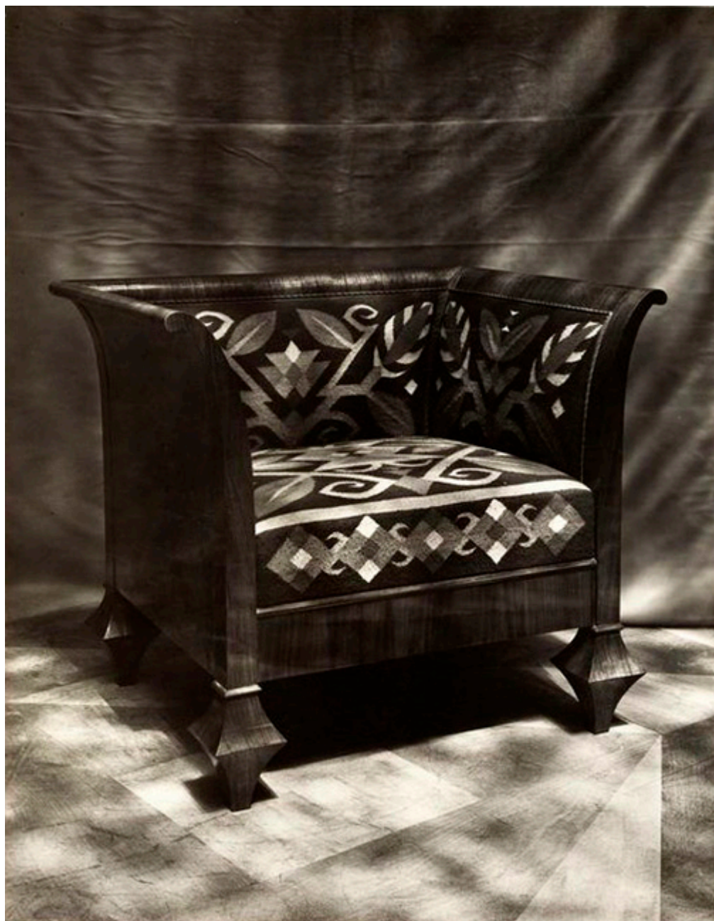
Międzynarodowa Wystawa Sztuk Dekoracyjnych i Nowoczesnego Przemysłu