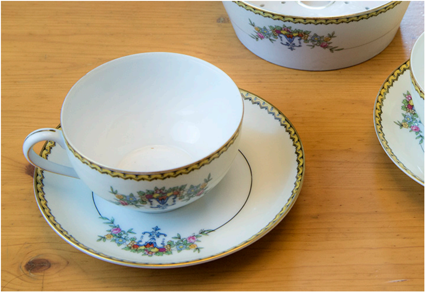
Porcelana Modjeska, kolekcja własna