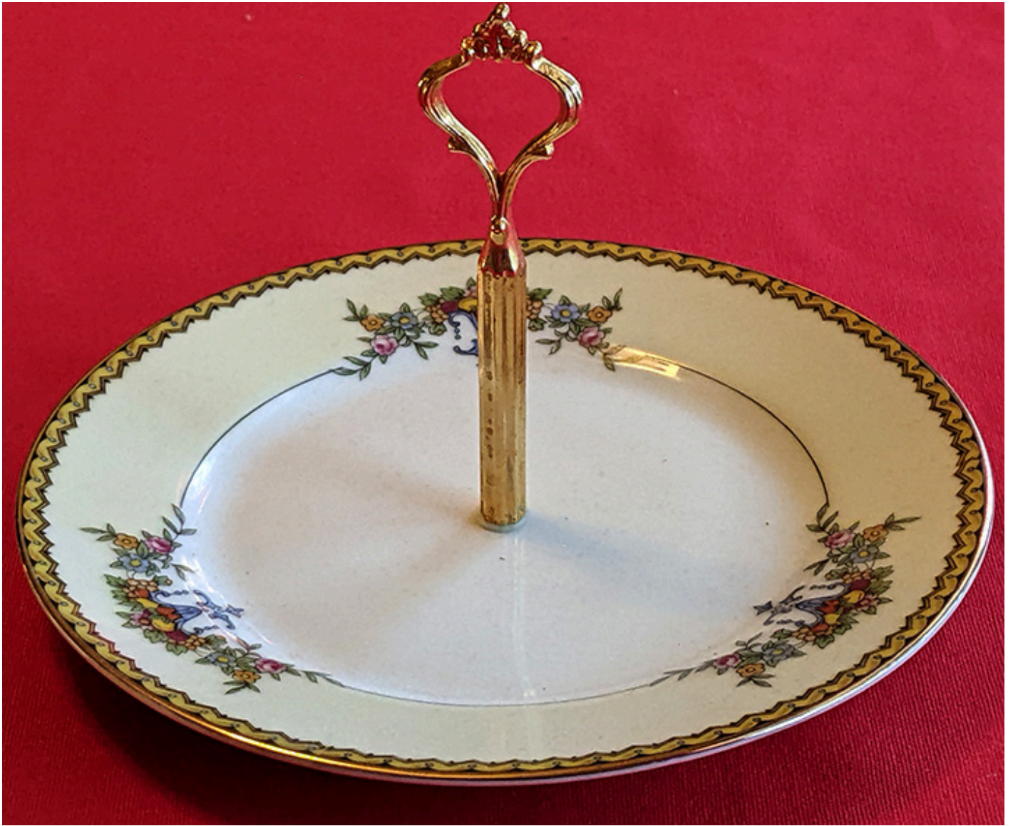
Mały talerzyk z rączką na owoce