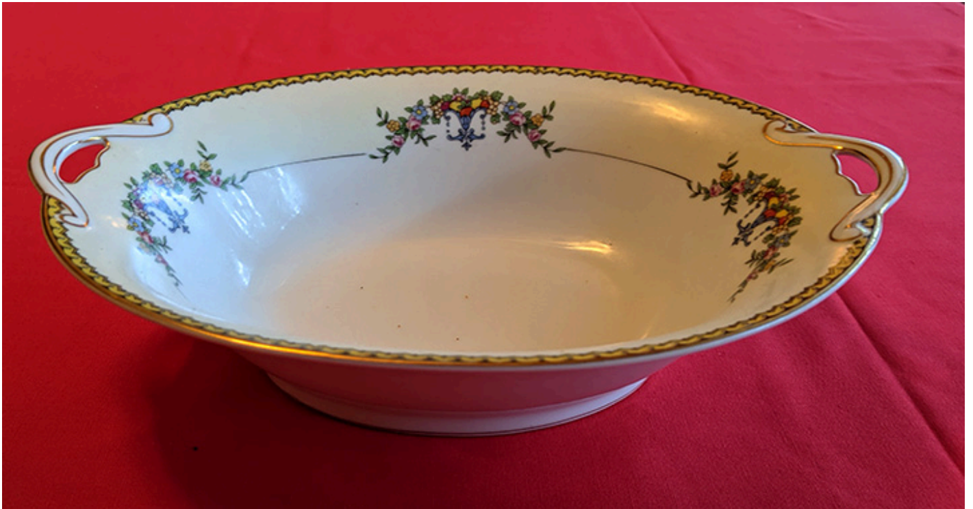
Owalna misa z rączkami do podawania