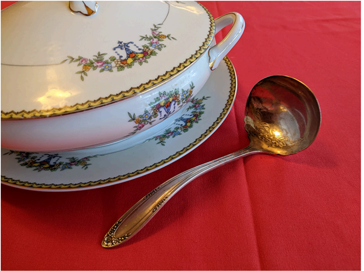
Waza do zupy z łyżką wazowa