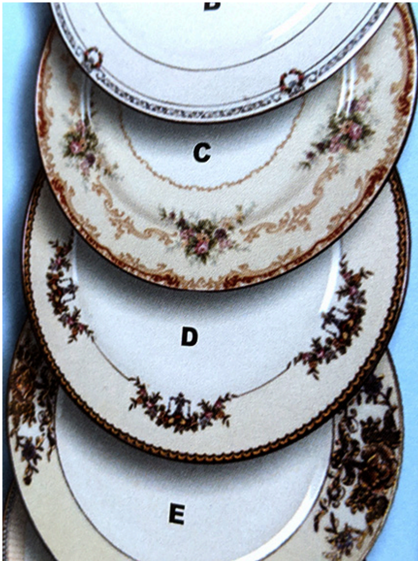
D - „Modjeska”