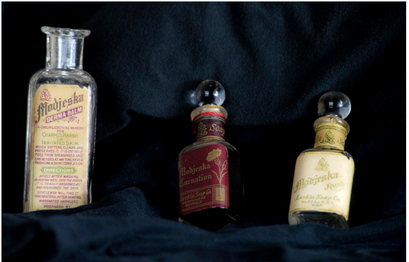
Opakowania po kosmetykach Modjeska, kolekcja własna