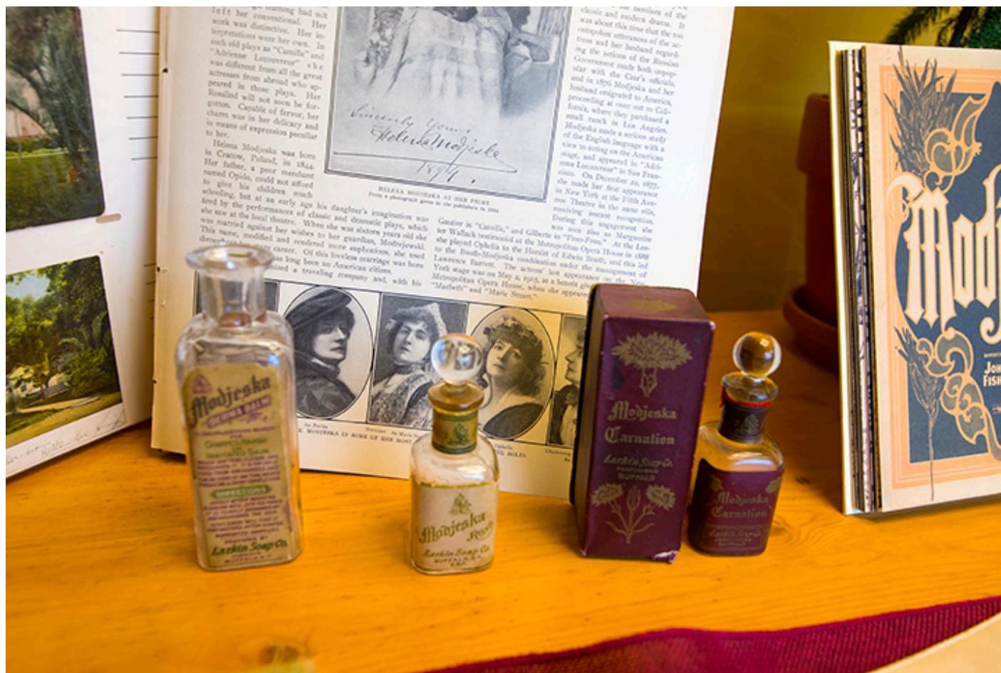
Kolekcja własna przedmiotów związanych z Heleną Modrzejewską