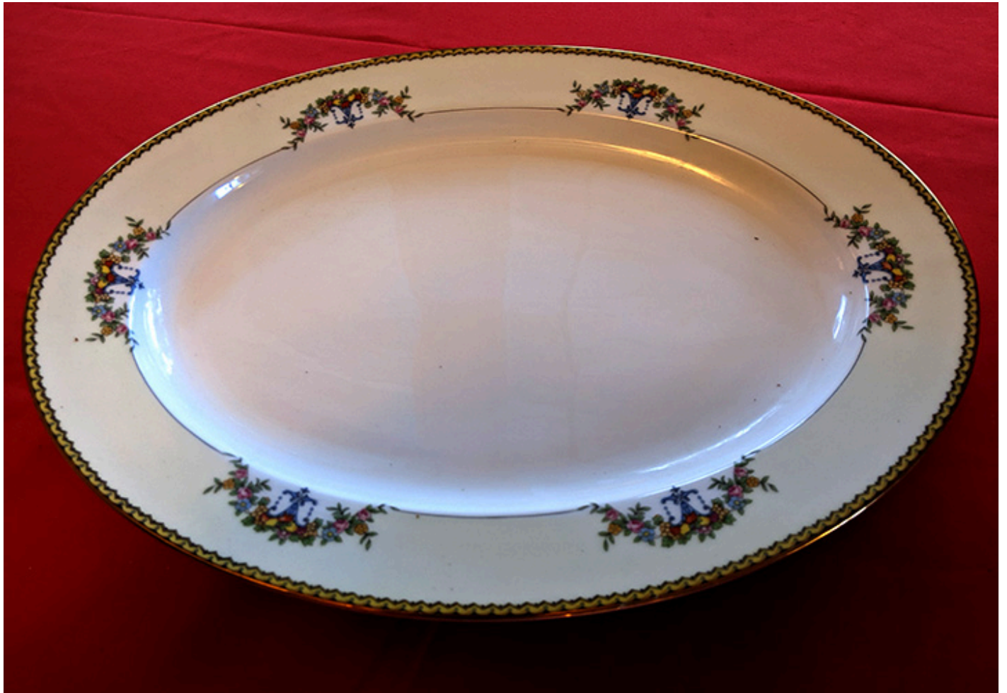
Duży półmisek do podawania