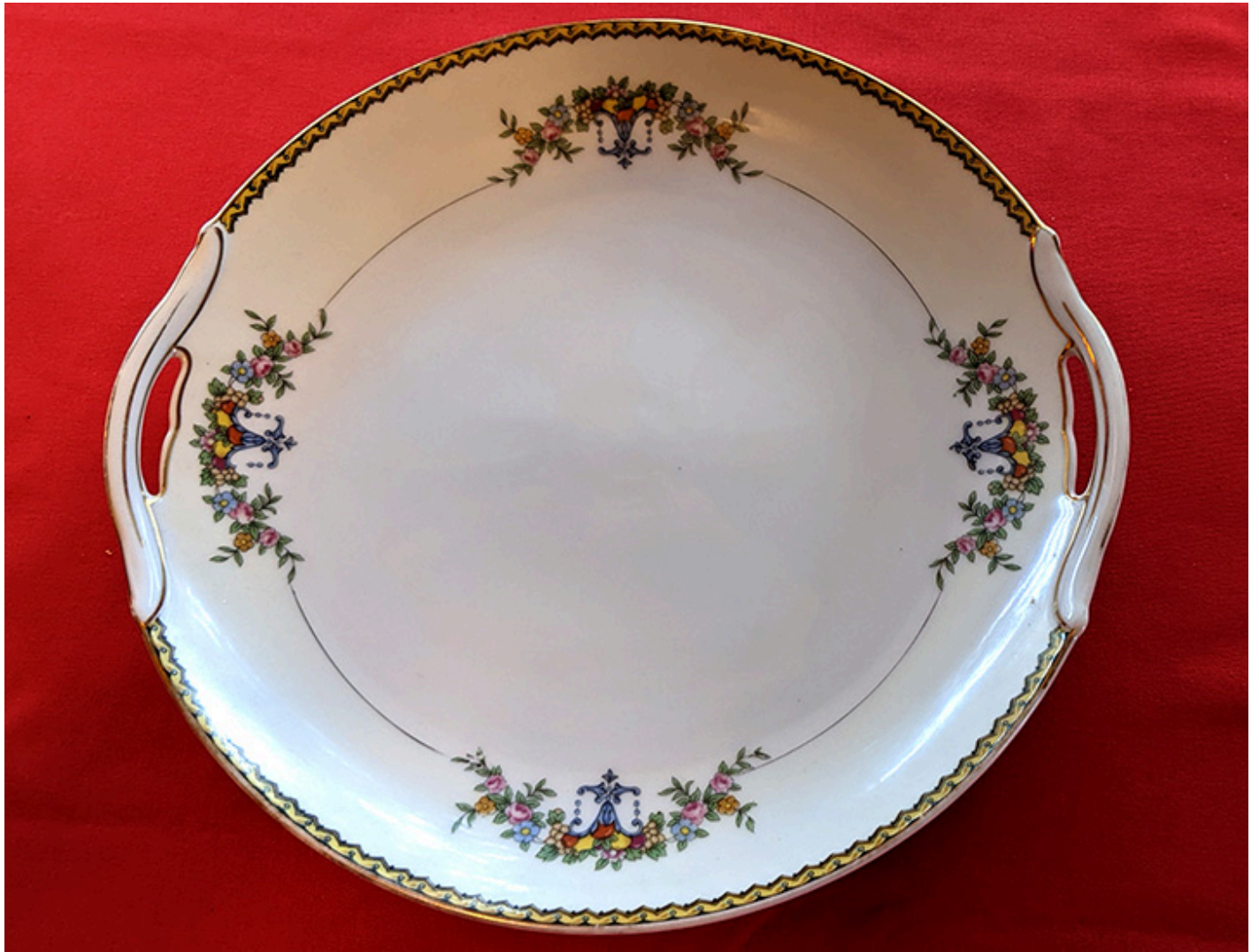
Talerz z rączkami do podawania