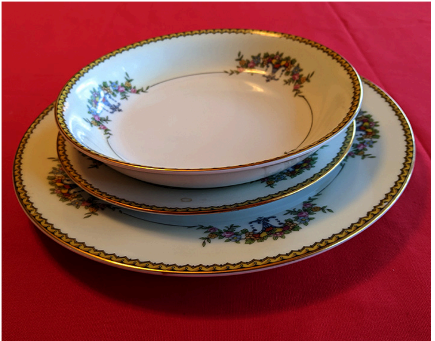
Zestaw obiadowy - talerz do zupy, talerz na drugie danie i talerzyk deserowy