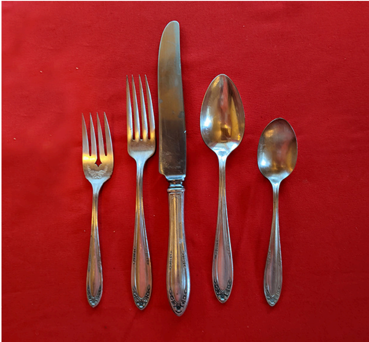
Zestaw obiadowy srebrnych sztuc c w Oneida Community „Modjeska”