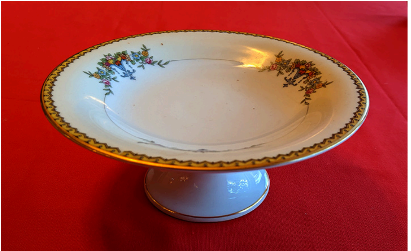
Mała taca z nóżką na ciasteczka