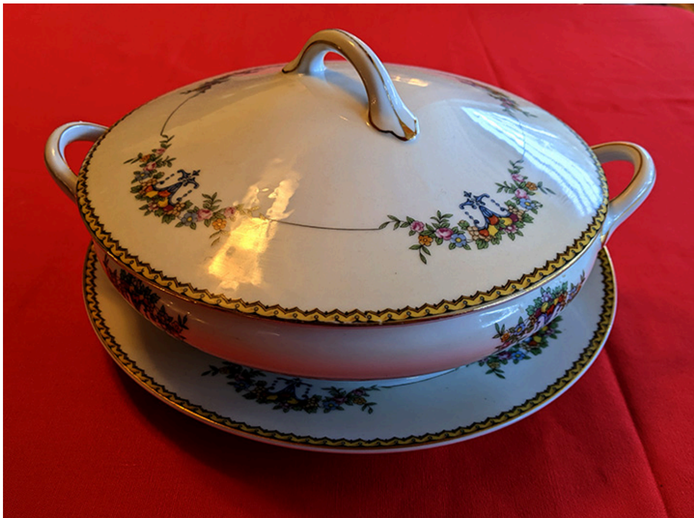
Waza do zupy