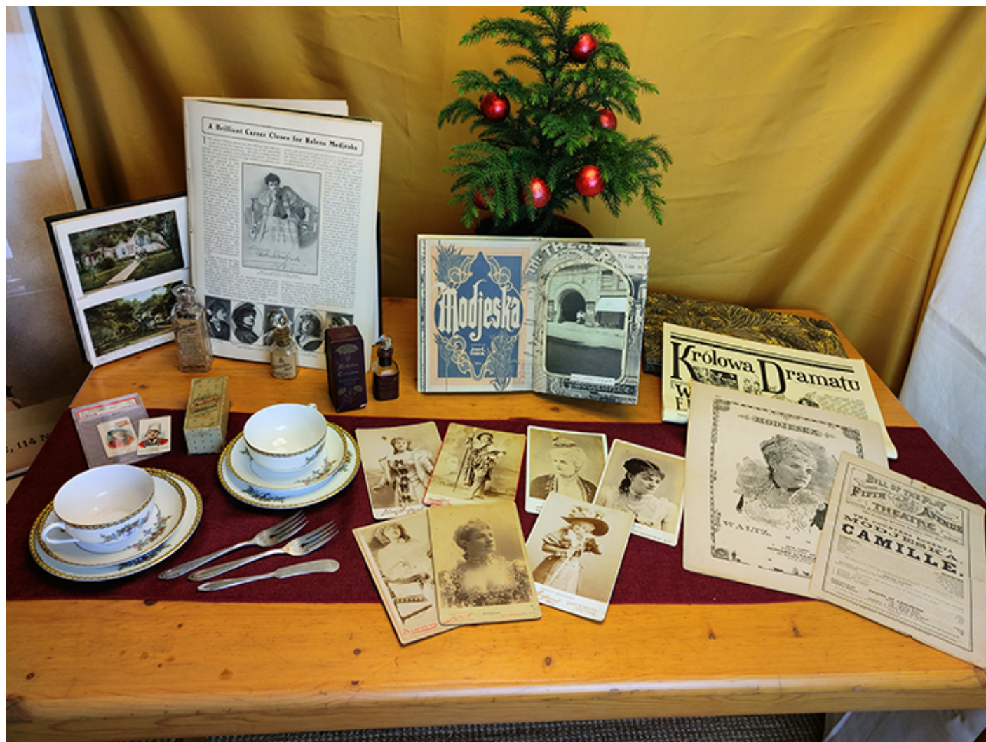
Kolekcja własna przedmiotów związanych z Heleną Modrzejewską