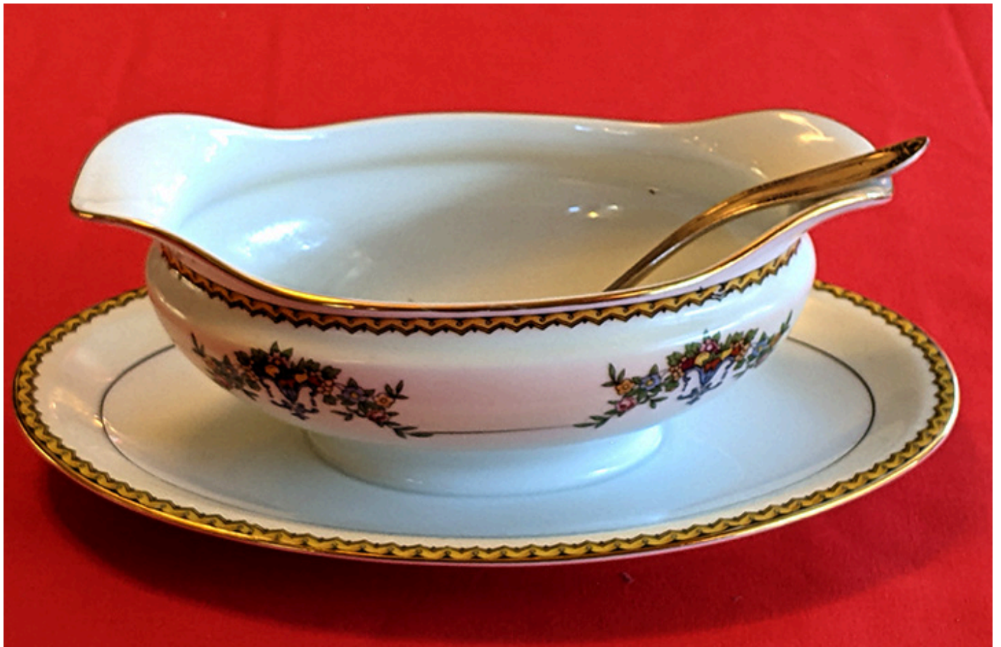
Sosjerka z łyżeczką do sosów