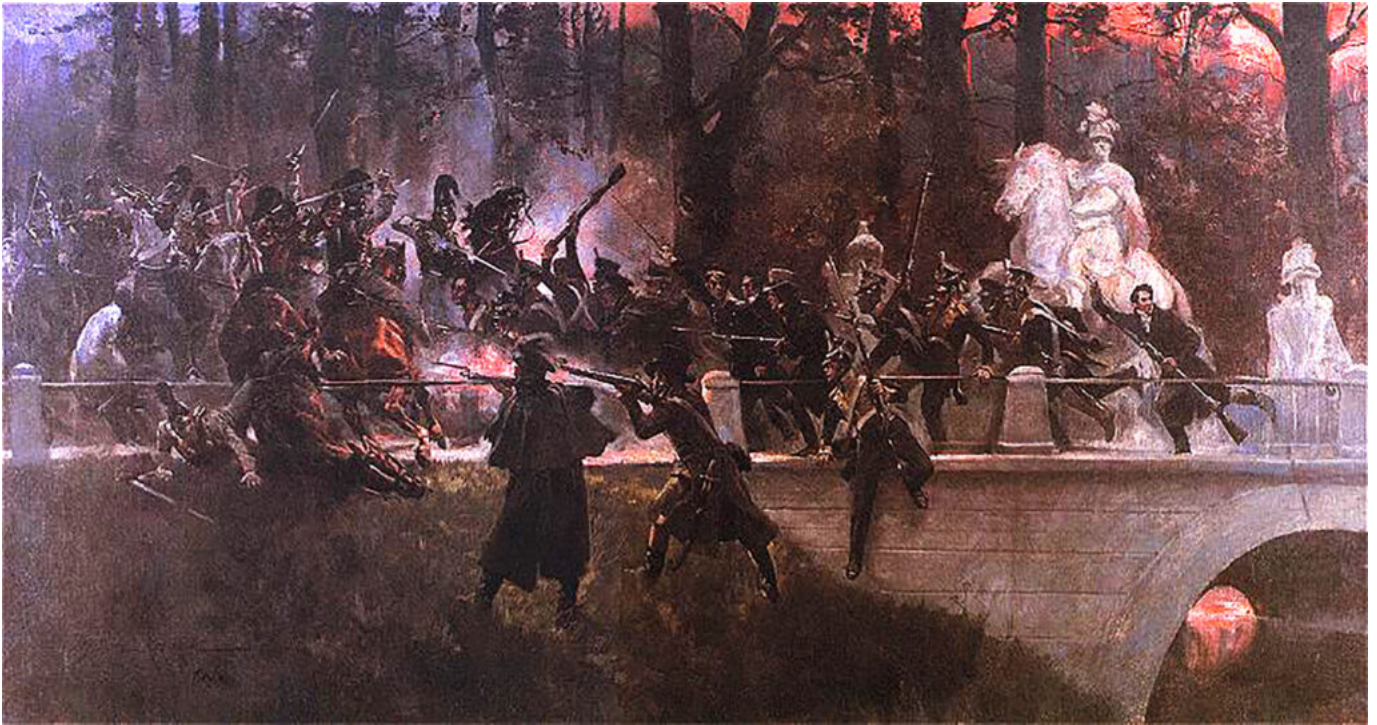
Wojciech Kossak, Noc Listopadowa