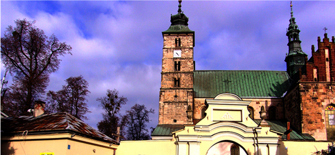
Kolegiata pod wezwaniem świętego Marcina w Opatowie