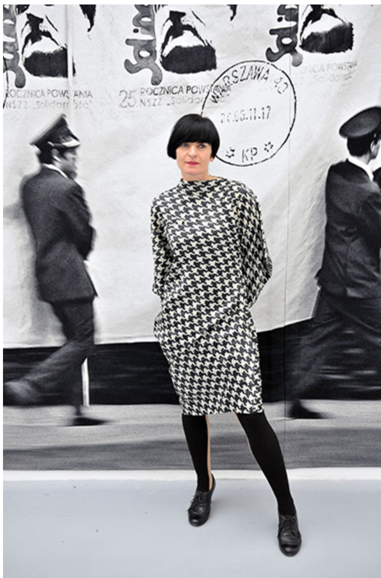
Goshka Macuga, wystawa w Zachęcie, Warszawa 2011 r.

Na szczególną uwagę zasługuje urodzona w Warszawie oraz artystycznie wykształcona w Wielkiej Brytanii Goshka Macuga .