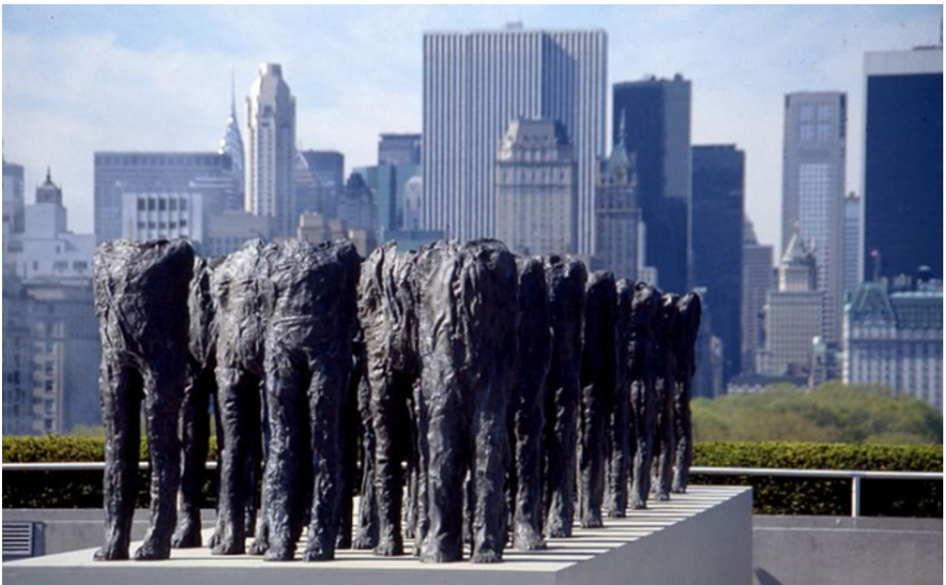
Magdalena Abakanowicz, Bambinii, 1998-1999. brąz, wystawa na dachu Metropolitan Museum of Art, Nowy Jork, USA

Scenerię wzmocniała panorama Nowego Jorku obramowująca pole naszego widzenia. Podobnie jak orszak rzeźb na pierwszym planie tak i w oddali rozciągały się szeregi niebotycznych budynków Manhattanu. Wielkie bryły w ponumerowanych rzędach, megality czekające na rozkaz, BACZNOŚĆ! SPOCZNIJ! BACZNOŚĆ! NA PRZÓD MARSZ!