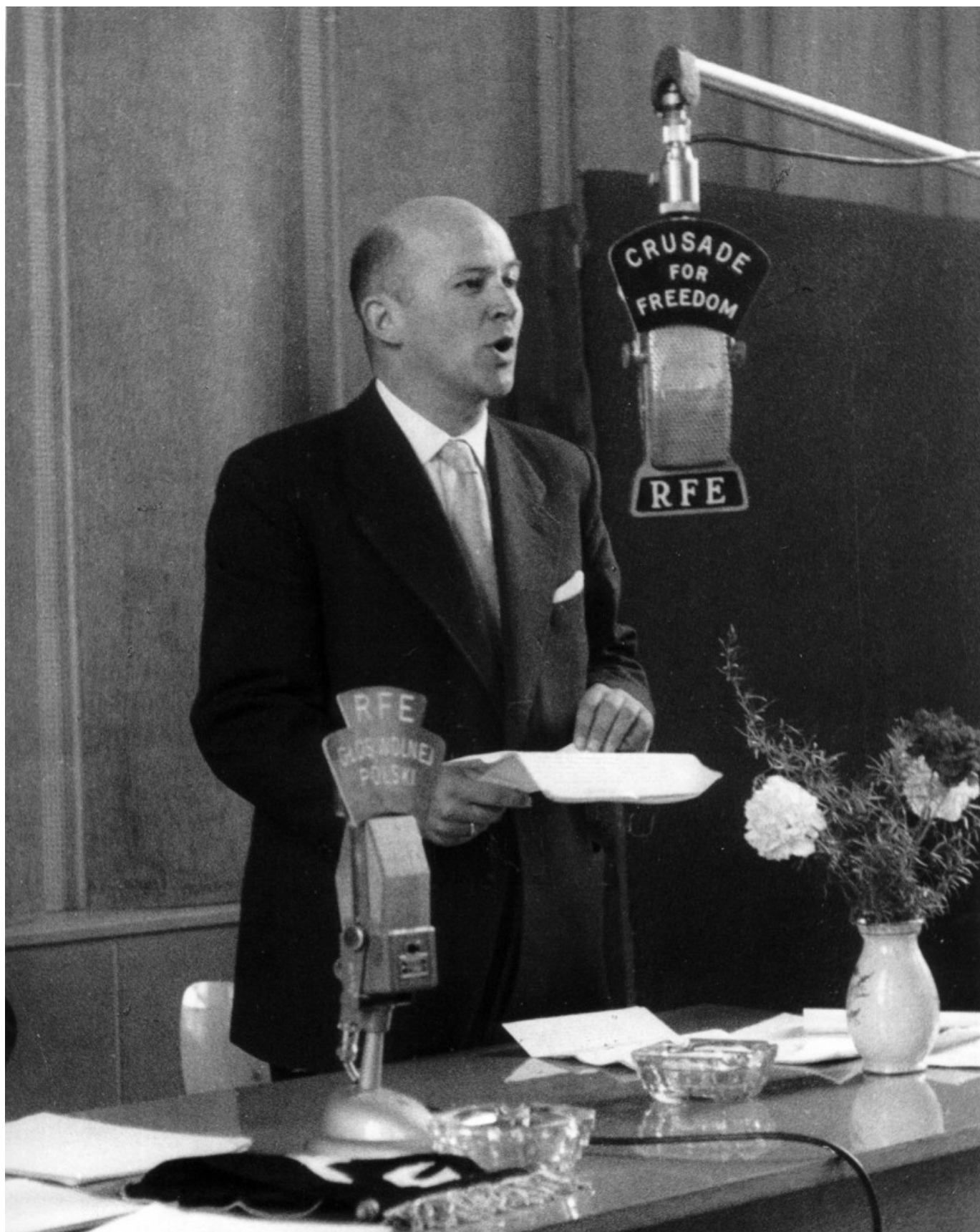
Jan Nowak-Jeziorański w 1957 r.