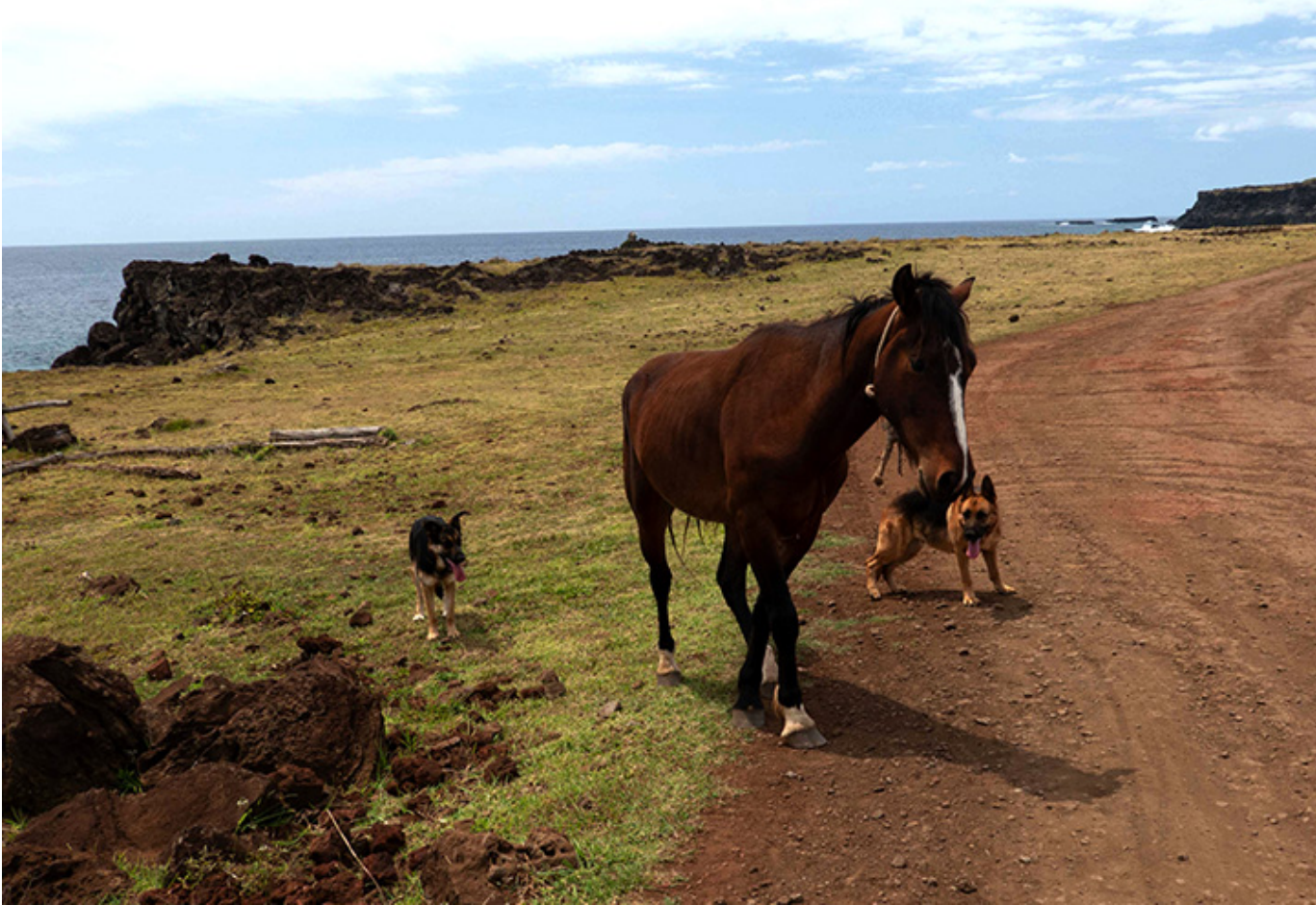
Koń i psy, fot. Czesław Sornat