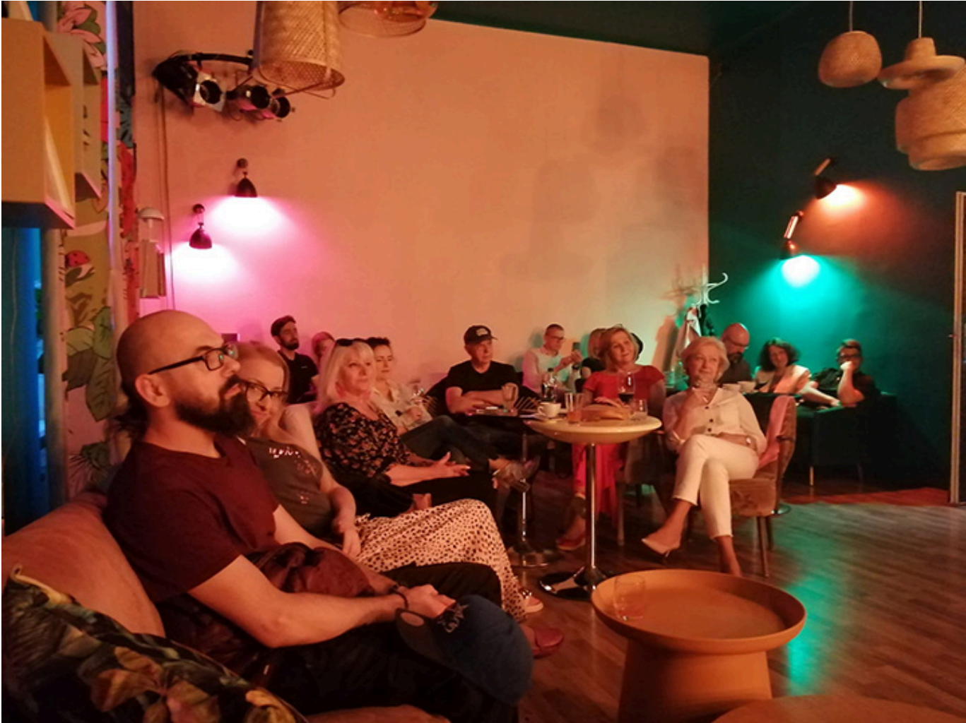
Publiczność podczas promocji płyty w Krakowie