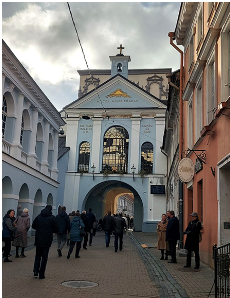
Wilno, Ostra Brama, fot. arch. Doroty Górczyńskiej-Bacik