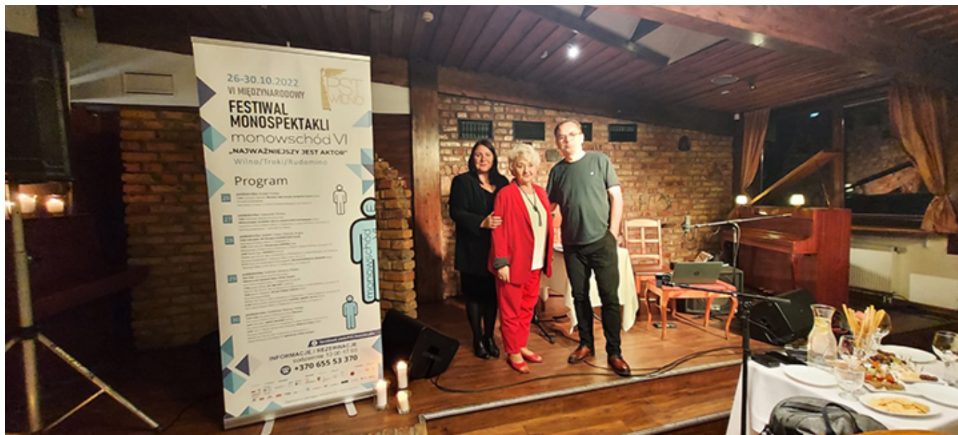
Festiwal Monospektakli w Wilnie