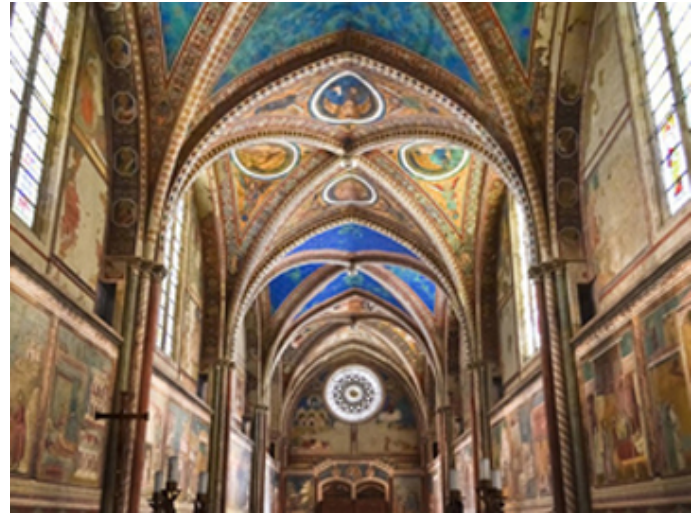
Kościół Santa Maria delle Grazie.