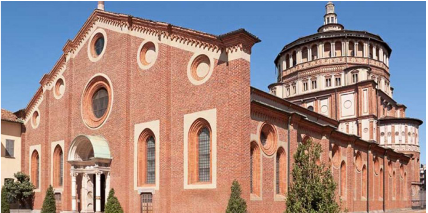
Kościół Santa Maria delle Grazie.

przełomie lutego i marca każdego roku, tuż przed wzmożonym ruchem turystycznym, który zalewa Włochy już przed Świętami Wielkiej Nocy, można, bez wcześniejszej rezerwacji, dołączyć do jednej, z limitowanych do kilkunastu osób, grup chętnych do zobaczenia Ostatniej Wieczery . Zdarza się jednak, że w okresie turystycznego szczytu, mając wcześniej zarezerwowane miejsce w kolejce, trzeba czekać ponad sześćdziesiąt dni, na moment wejścia do mediolańskiego refektarza.