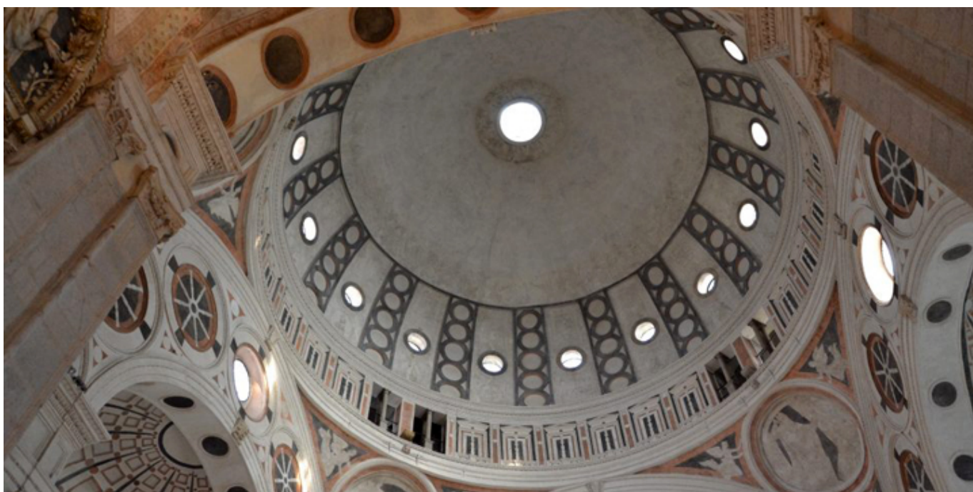
Kościół Santa Maria delle Grazie.

które dzięki temu nie konkurują pomiędzy sobą. Ukrzyżowanie Donato Montorfano, tak interesujące, nasycone całym szeregiem właściwie samodzielnych przedstawień, rozgrywających się w jego poszczególnych partiach, pełne wielobarwnie ubranych postaci z epoki, ciekawie skomponowanego pejzażu i umieszczonej w nim architektury, przegrywa (chyba najbardziej przez sam fakt obecności w refektarzu) z Ostatnią Wieczerzą . To ona, jej magiczna siła, jej Mistrz i twórca, Leonardo da Vinci, są powodami, dla których, po raz kolejny odwracamy się plecami do Ukrzyżowania , by jeszcze raz, z bliska i z daleka, obserwować i kontemplować atmosferę ostatniego, przed Ukrzyżowaniem, spotkania Chrystusa ze swoimi uczniami.