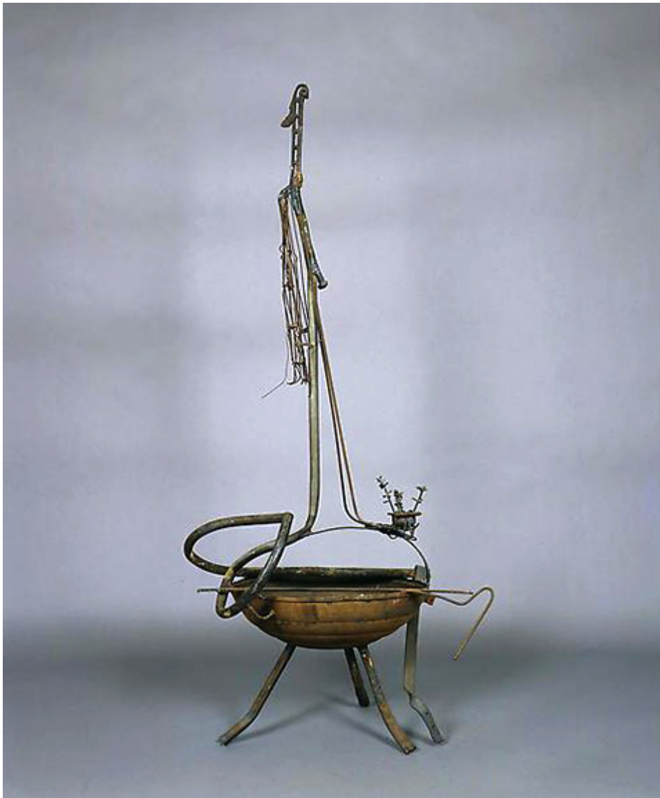
Richard Stankiewicz, Seated Lady , 1954 r., spawany metal, 49" x 23" x 17".

artystę nominacją do udziału w Biennale w Wenecji. Stankiewicz występował jako twórca reprezentujący Amerykę. Niedługo później, w 1959 roku zaproszony został przez Dorothy Miller, do udziału w organizowanej przez kuratorkę wystawie Sixteen Americans (Szesnastu Amerykanów) , odbywającej się w Museum of Modern Art. Oprócz Stankiewicza pokazano prace takich sław jak Jasper Johns, Ellsworth Kelly, Robert Rauschenberg, czy Frank Stella.