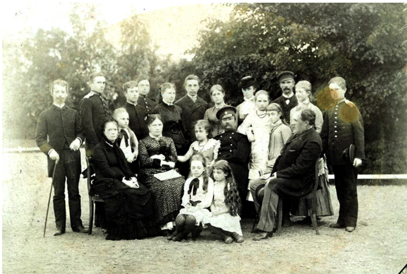
Rodzina Tyszkiewiczów, 1880-1882 r.