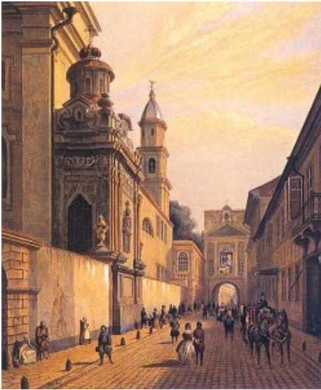
Wilno. Kaplica w Ostrej Bramie.

Codziennie wędrował autor Zielonej Gęsi swoimi drózkami, bądź przez Ogród Bernardyński, Plac Katedralny do kawiarni „Literackiej”, bądź do Oddziału Wileńskiego Związku Literatów Polskich na Ostrobramskiej 9, bądź do Rozgłośni Polskiego Radia. Spotykał się z wieloma Wilnianami, rozmawiał, obserwował, pisał, również sporo dla „Smorgonii”, radiowego kabaretu satyrycznego w Wilnie – cotygodniowy felieton. Dla Rozgłośni Wileńskiej napisał słuchowisko Taniec elfów – satyrę na stosunki szkolne, której tekst zaginął.