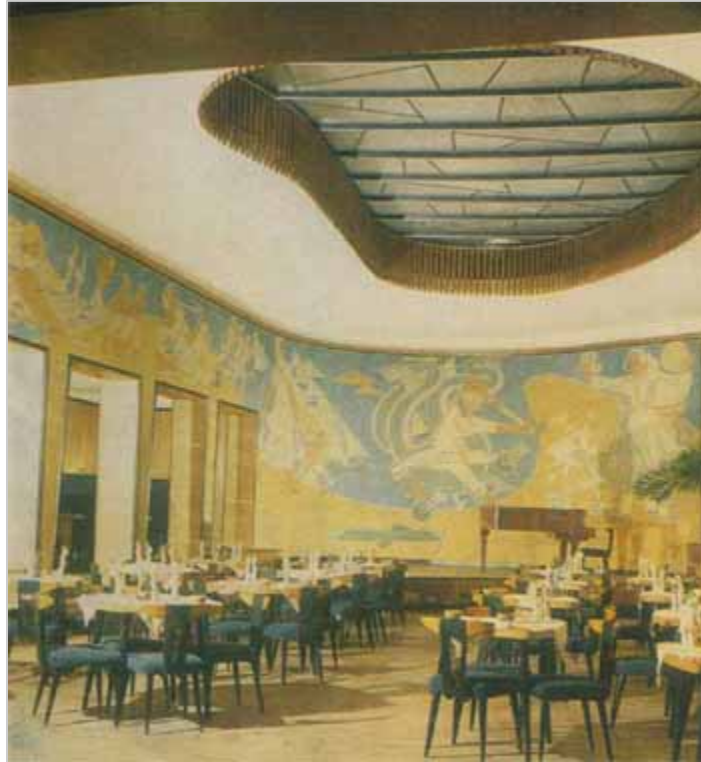
Cafe Neringa w Wilnie

Artykuł opublikowany w „Liście oceanicznym”, dodatku kulturalnym „Gazety” z Toronto w 2004 r.