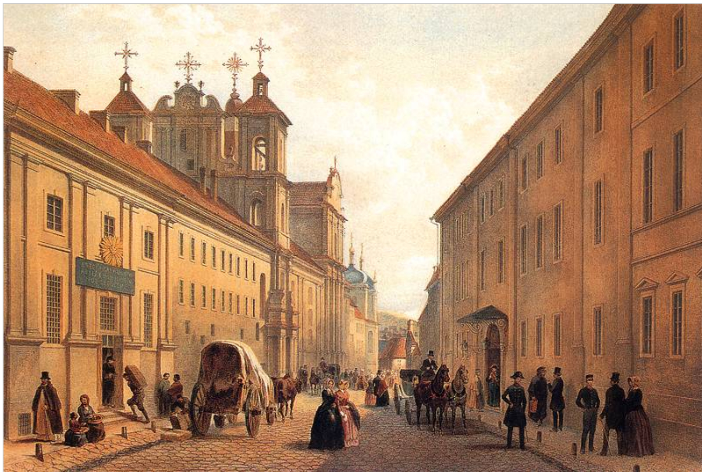
Zygmunt Vogel, Ulica w Wilnie. XIX w. Muzeum Narodowe, Kraków.