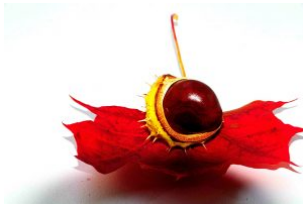
Wileński kasztan, fot. Tadeusz Szostak.

Trudno było określić po latach, gdzie stał dom jego rodziny, gdyby nie kasztan, zasadzony dziecięcą ręką. Stary człowiek podchodzi, głaszcząc drzewo, jak relikwie zbiera z trudem z ziemi kasztany. Czasem wydaje się, że Henryk słyszy głos matki: "Przeżyje on nas, przeżyje".