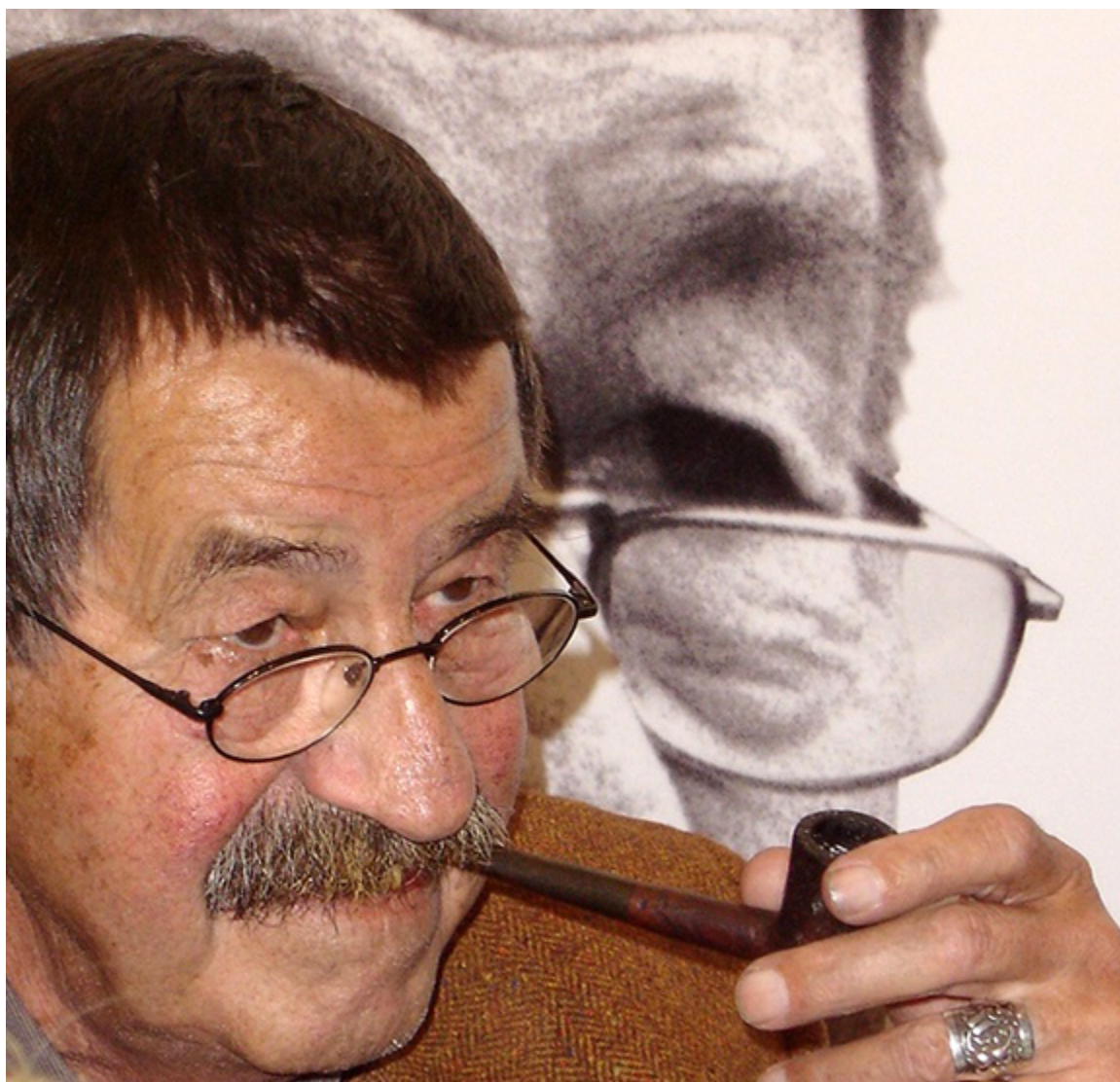
Günter Grass, 2004 r.