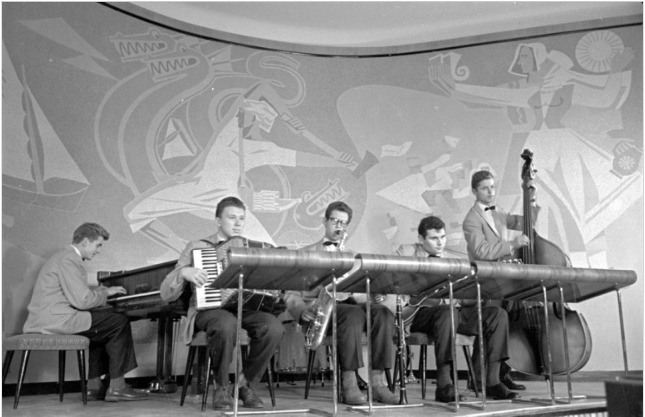
Cafe Neringa w Wilnie

Czas wchodzi do Wilna poprzez drzwi kawiarni.