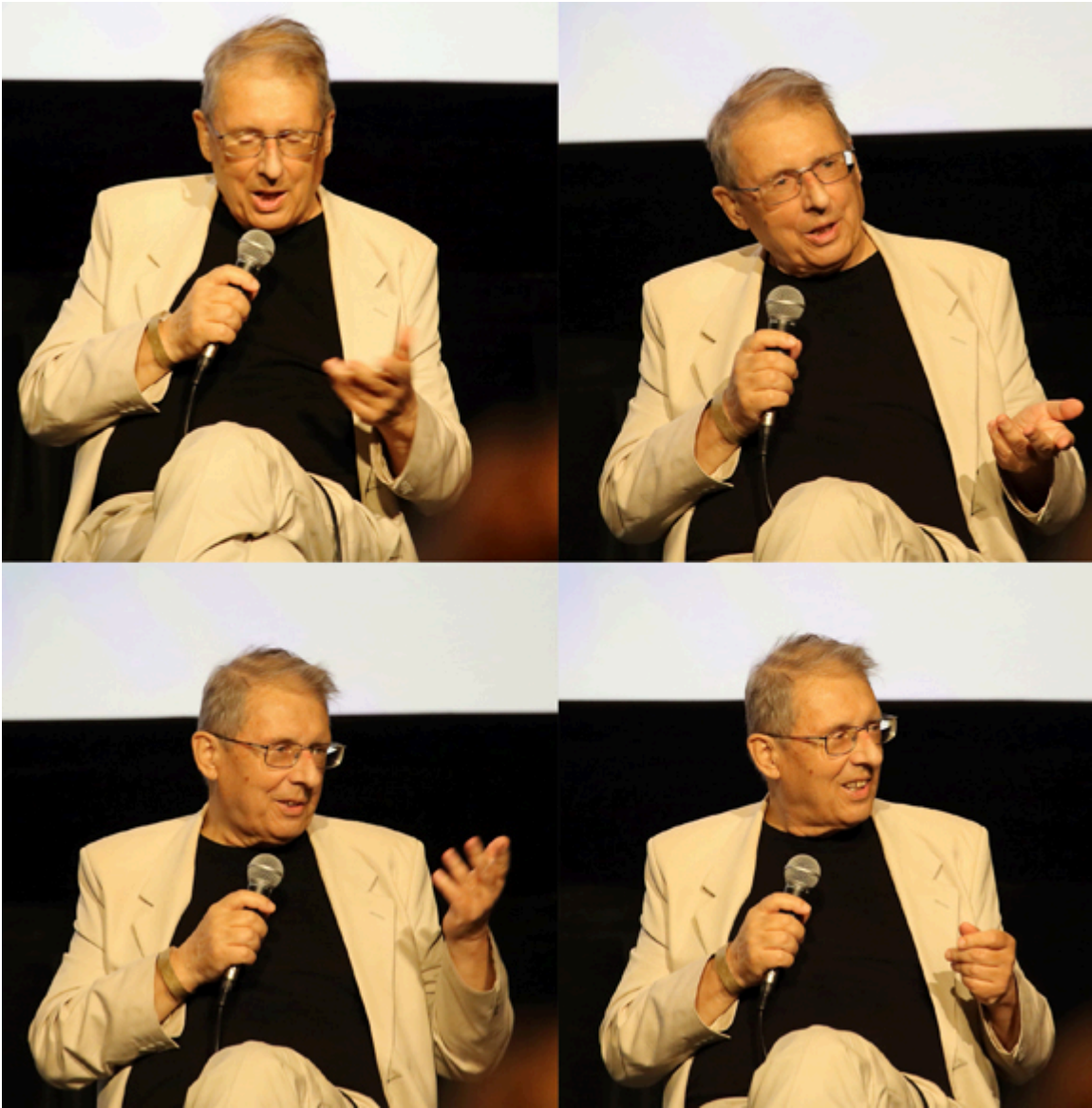
Ryszard Bugajski