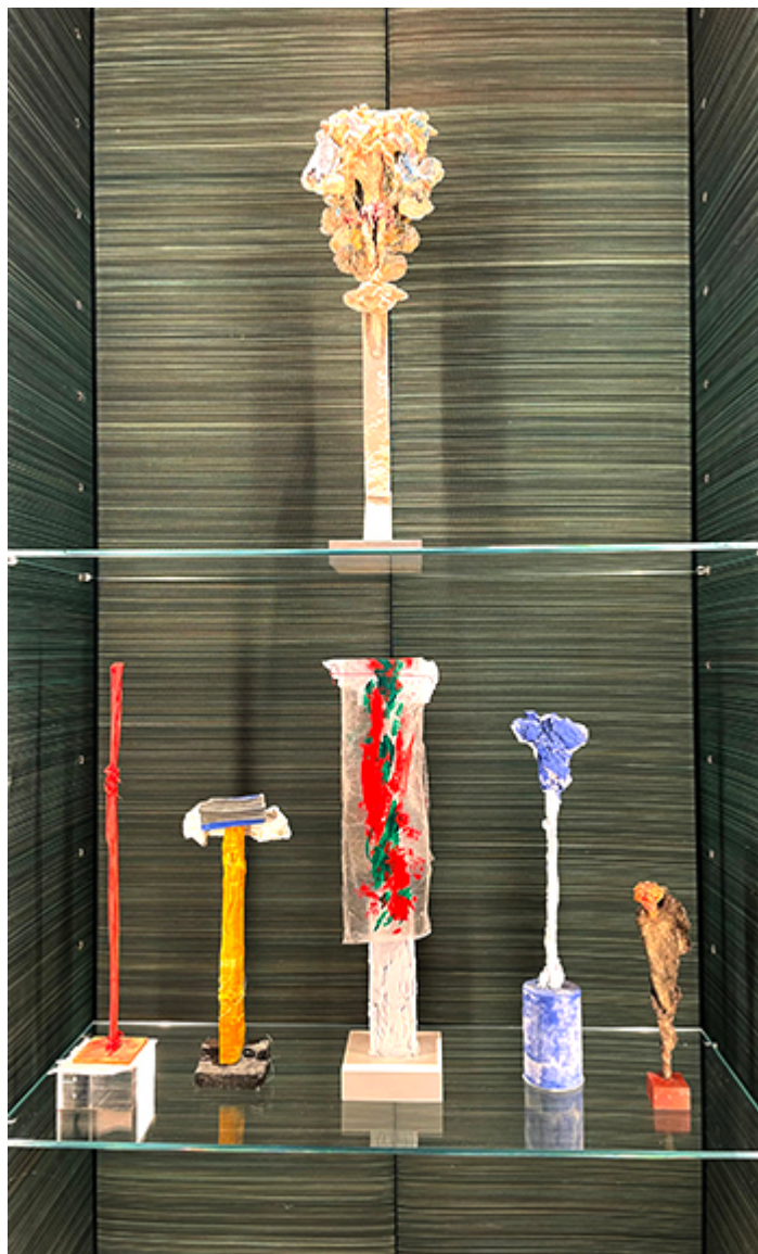
Wystawa w kościele St. Johns Waterloo w Londynie