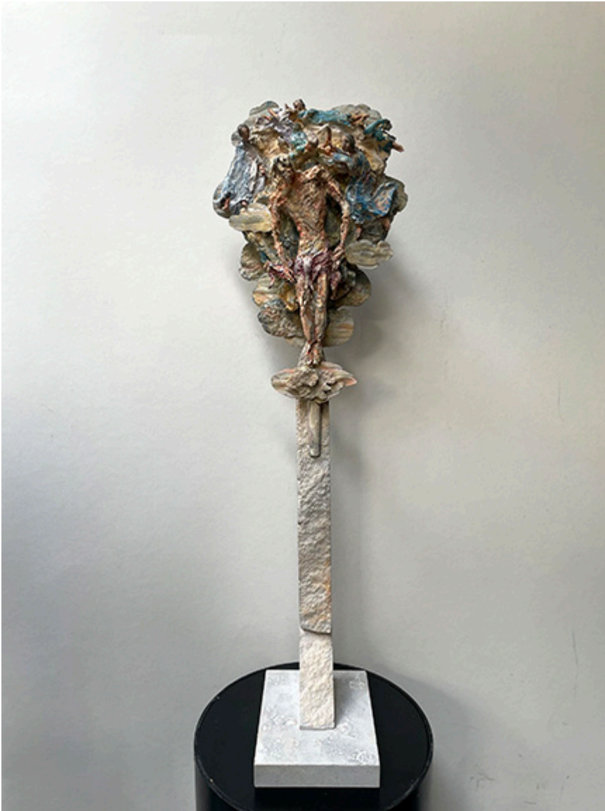
Christ ascending into heaven aided by angels (Chrystus wstępujący do nieba w asyście aniołów), 54 cm