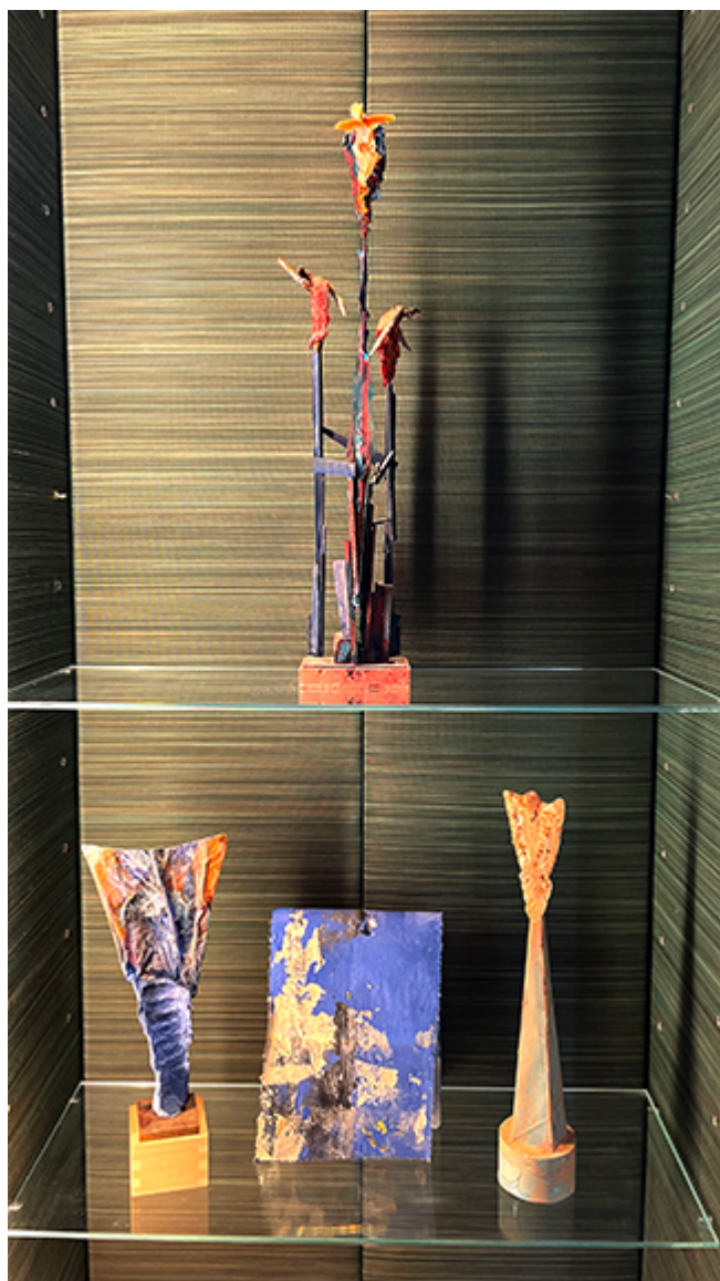
Wystawa w kościele St. Johns Waterloo w Londynie