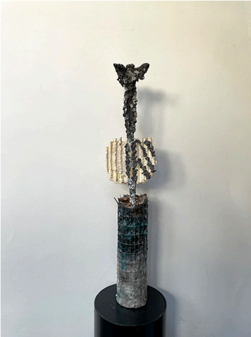
Transfiguration (Transfiguracja), 67 cm