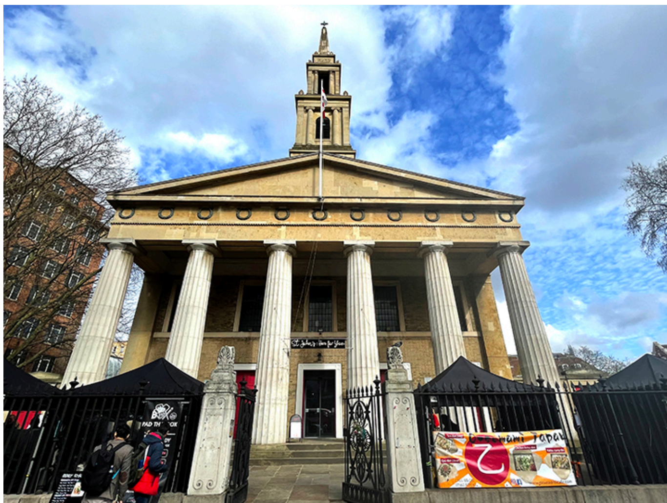
Kościół St. Johns Waterloo w Londynie