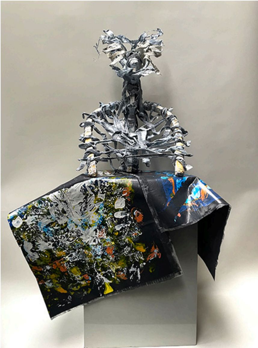
Blind Face of violence - dedicated to suffering Ukraine (Ślepe oblicze przemocy - poświęcone cierpiącej Ukrainie) 125x80x60 cm