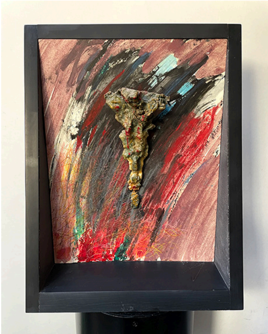
Resurrection (Zmartwychwstanie) 39xw31x10 cm