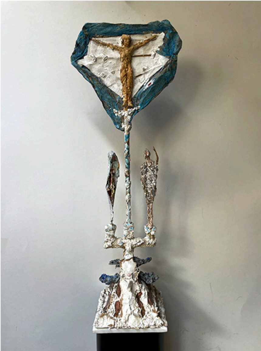
Christ in heaven - mixed technique (Chrystus w niebie, technika mieszana), 83 cm