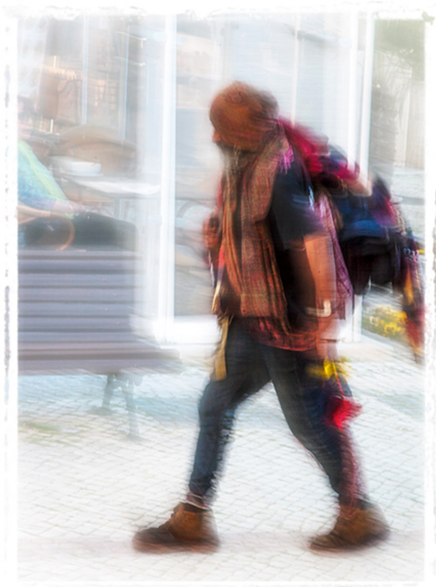
Portugalia 2019 r.