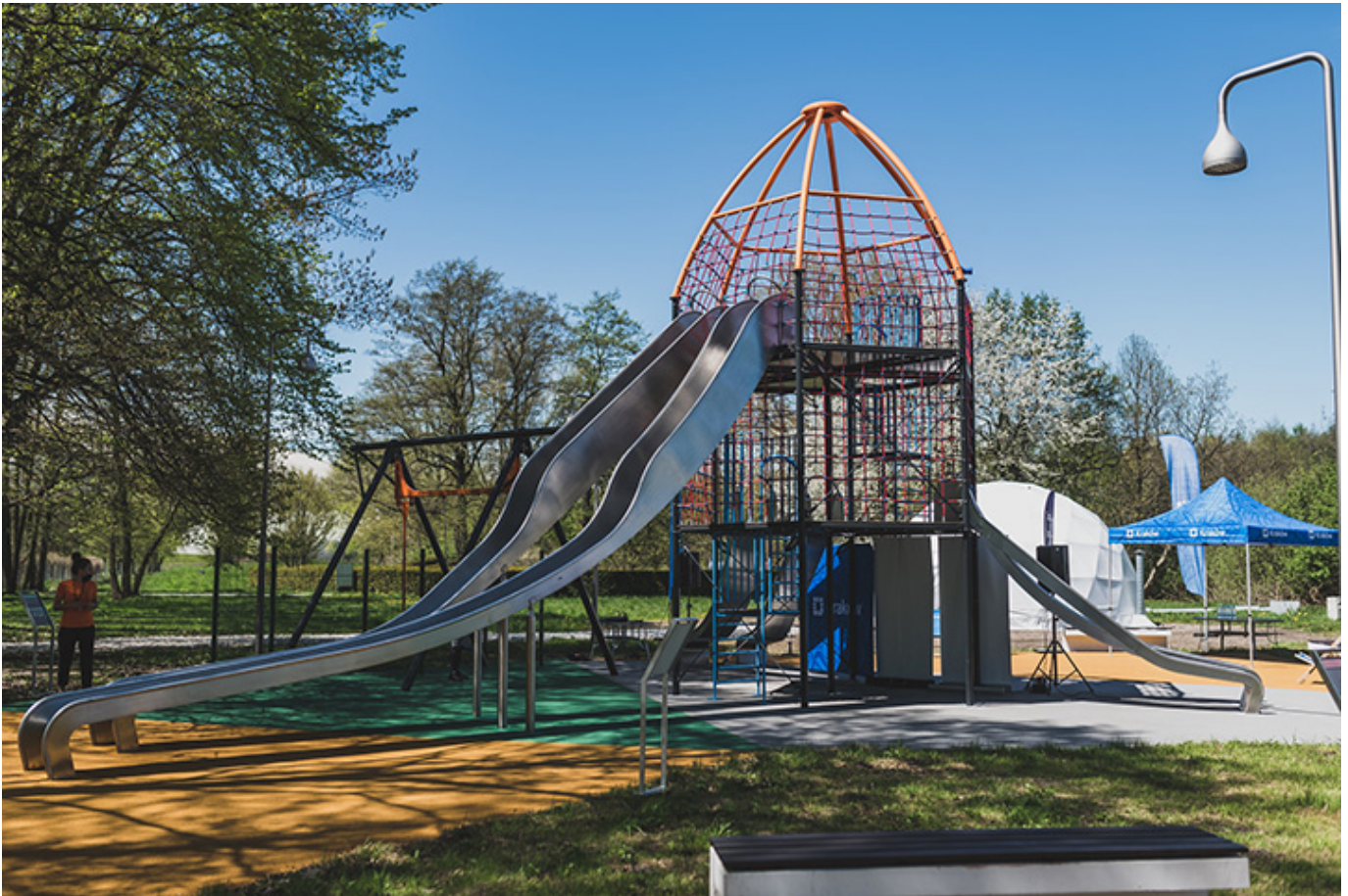
Rakieta, fot. Muzeum Inżynierii Miejskiej w Krakowie