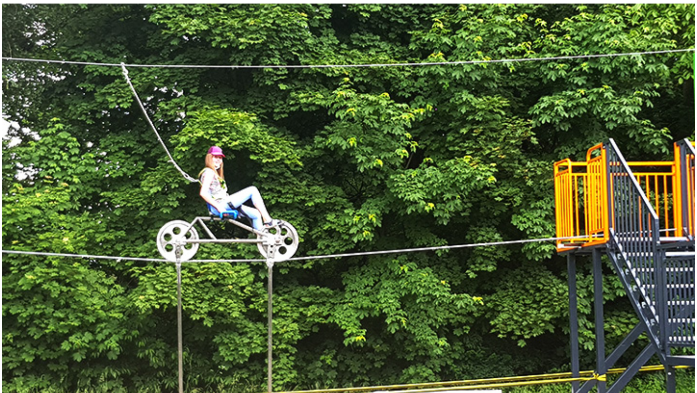
Wiszący rower

- Pod rowerem zawieszony jest ciężar, który powoduje znaczne obniżenie środka ciężkości i przez to zapewnia stabilność całego układu. Osoba jadąca na rowerze nie jest w stanie ani z niego spaść, ani go przewrócić. Zresztą podwieszamy ją wcześniej na linie, ale tylko na wypadek, gdyby w pewnym momencie sama zechciała zeskoczyć.