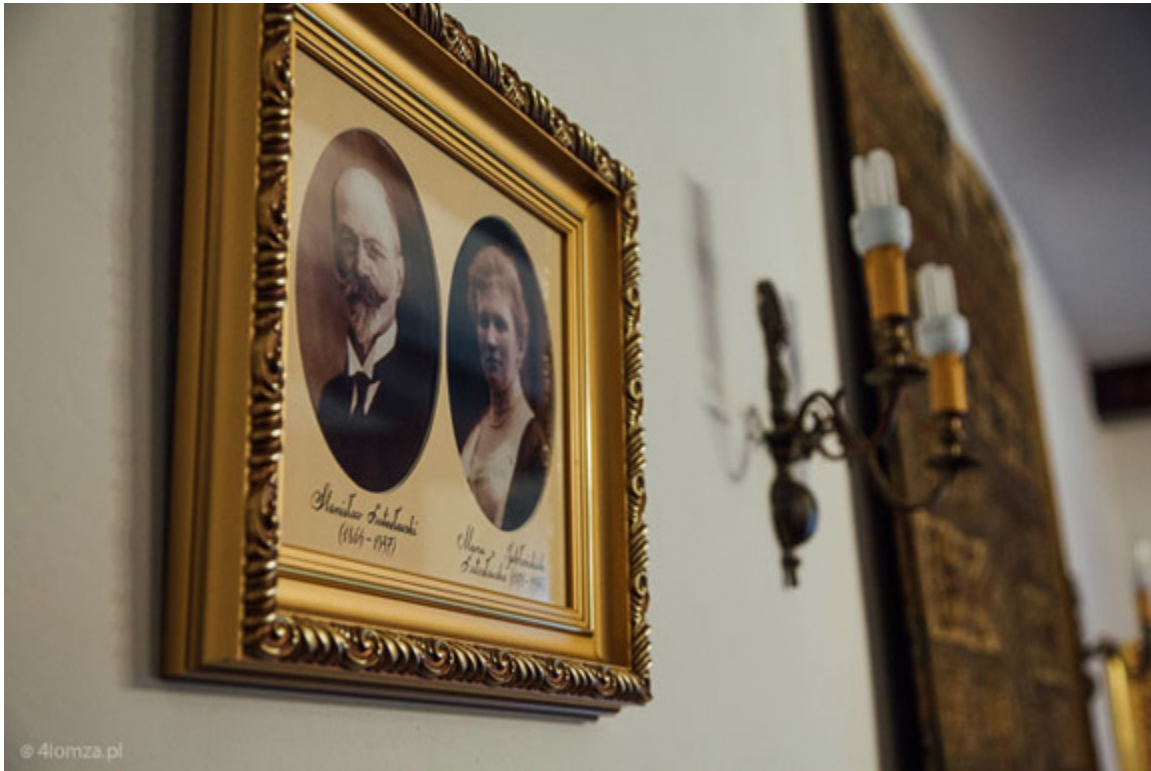
Dwór Lutosławskich w Drozdowie, koło Łomży.