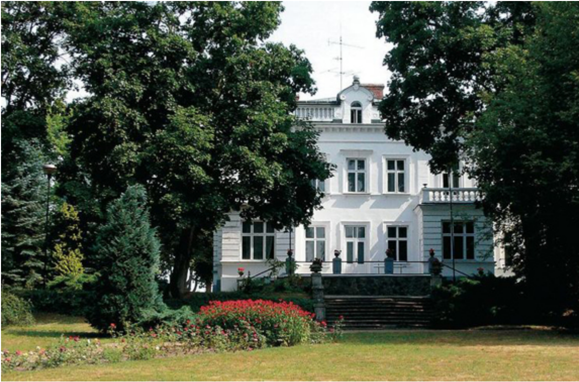
Dwór Lutosławskich w Drozdowie, koło Łomży.