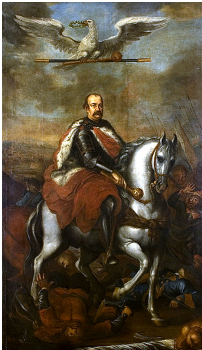
Alegoryczny portret Jerzego Sebastiana Lubomirskiego, ojca panny młodej, autor nieznanym

Nie sposób wymienić wszystkiego, co znalazło się wtedy na łańcuckich stołach, ale już kilka pozycji daje wyobrażenie o wielkości przyjęcia.