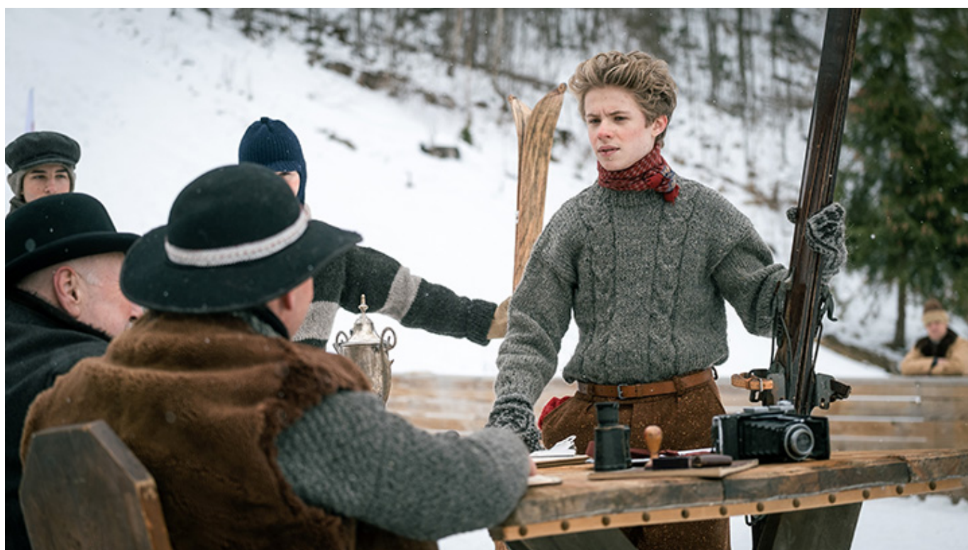
„Marusarz. Tatrzański orzeł”, reż. Marek Bukowski, wyk. Mateusz Janicki, Olga