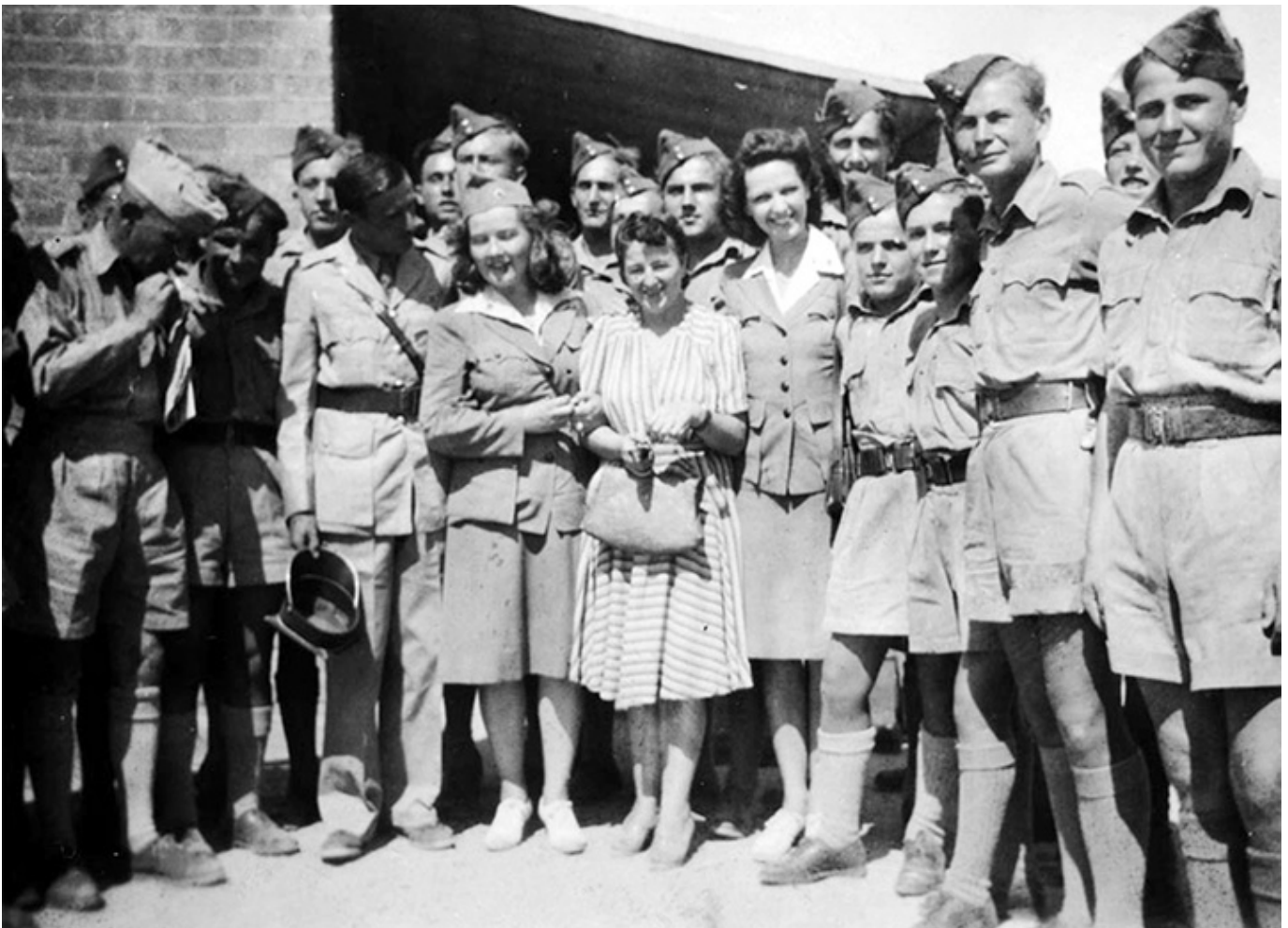
Pamiętna wizyta: Polki z Amerykańskiego Czerwonego Krzyża przyjechały z darami