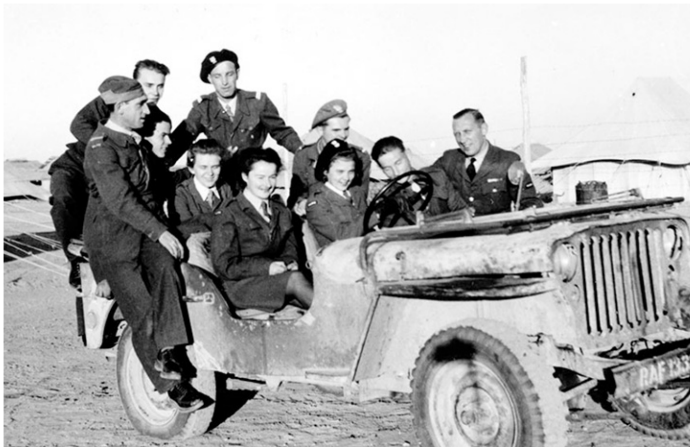
Wizyta zespołu teatralno-kabaretowego w Heliopolis.