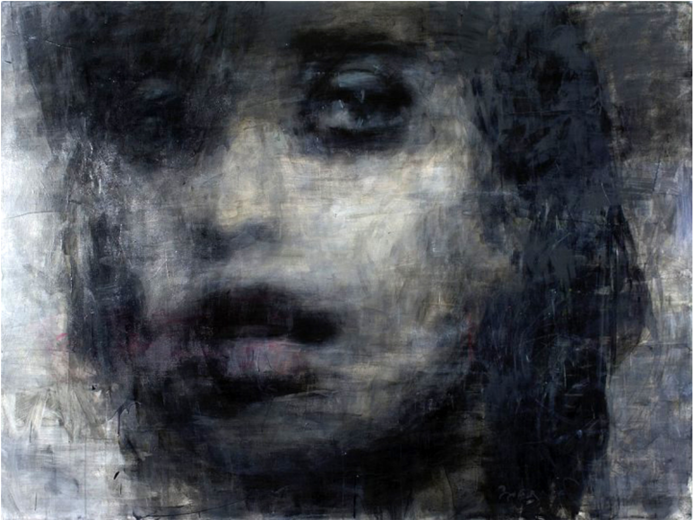
Nadine Labaki, acrylic, pastel, olej na płótnie, 201 x 151 cm.