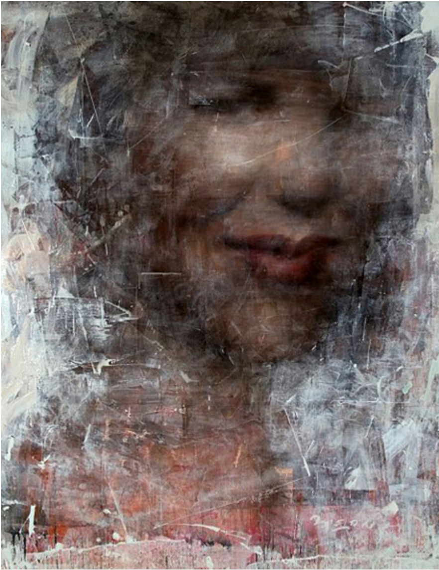
Adrienne Pieczonka, acrylic, pastel, olej na płótnir, 151 x 196 cm.