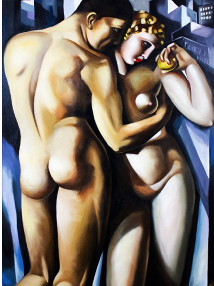
Tamara Łempicka, Adam i Ewa, 1932 r.

Wielką sensację wywołała aukcja z 1994 roku, kiedy w domu aukcyjnym Christie's w Nowym Jorku obraz Tamary Łempickiej „Adam i Ewa” z 1931 roku, należący do kolekcji Barbary Streisand, został sprzedany za dwa miliony dolarów.