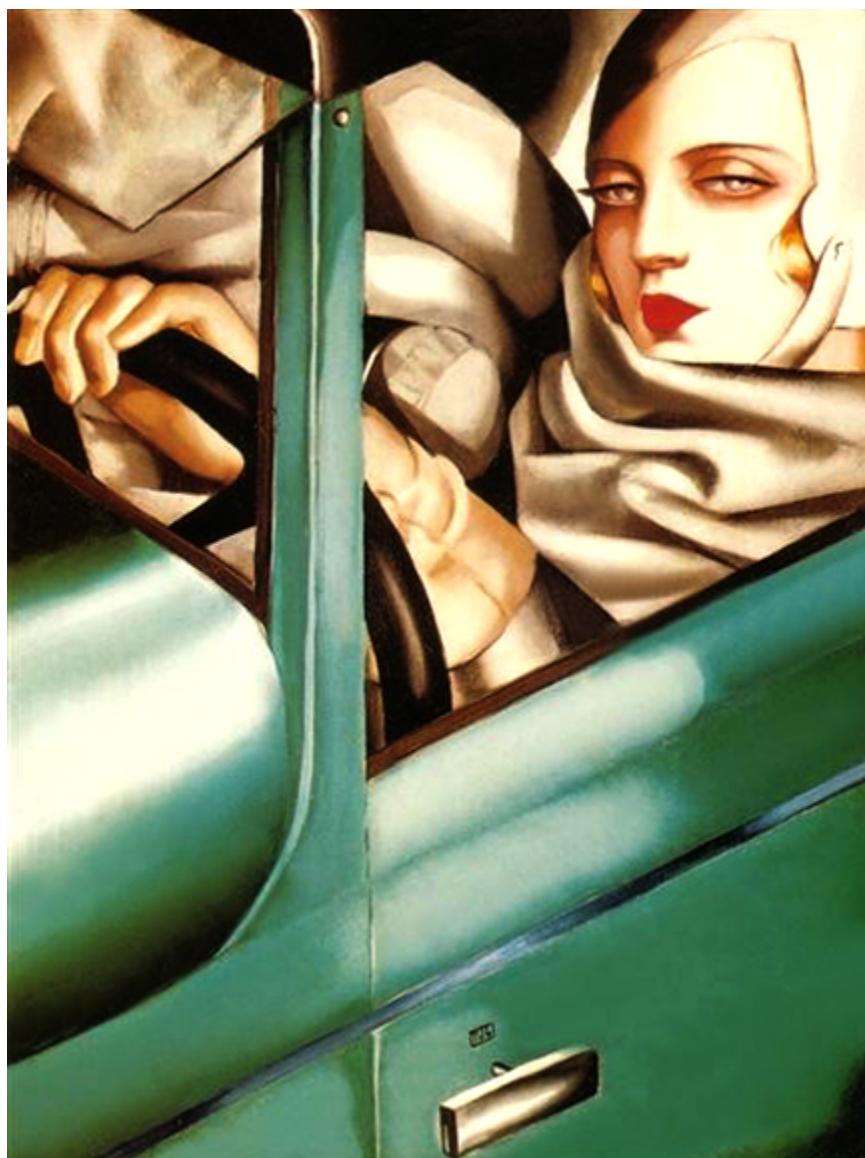
Tamara Łempicka, Autoportret w zielonym bugatti, 1925 r.

„Matka przełożona” została wystawiona dopiero w roku 1939, kiedy Tamara już na stałe przyjechała do Stanów. Malarka uważała, że nie oferuje jej się za niego dość pieniędzy, dlatego podarowała obraz Musee de Nantes , które pierwsze zakupiło jedną z jej prac z lat 20. Obraz ten miał dla niej duże znaczenie, a praca nad nim była oczyszczeniem duszy i mózgu.