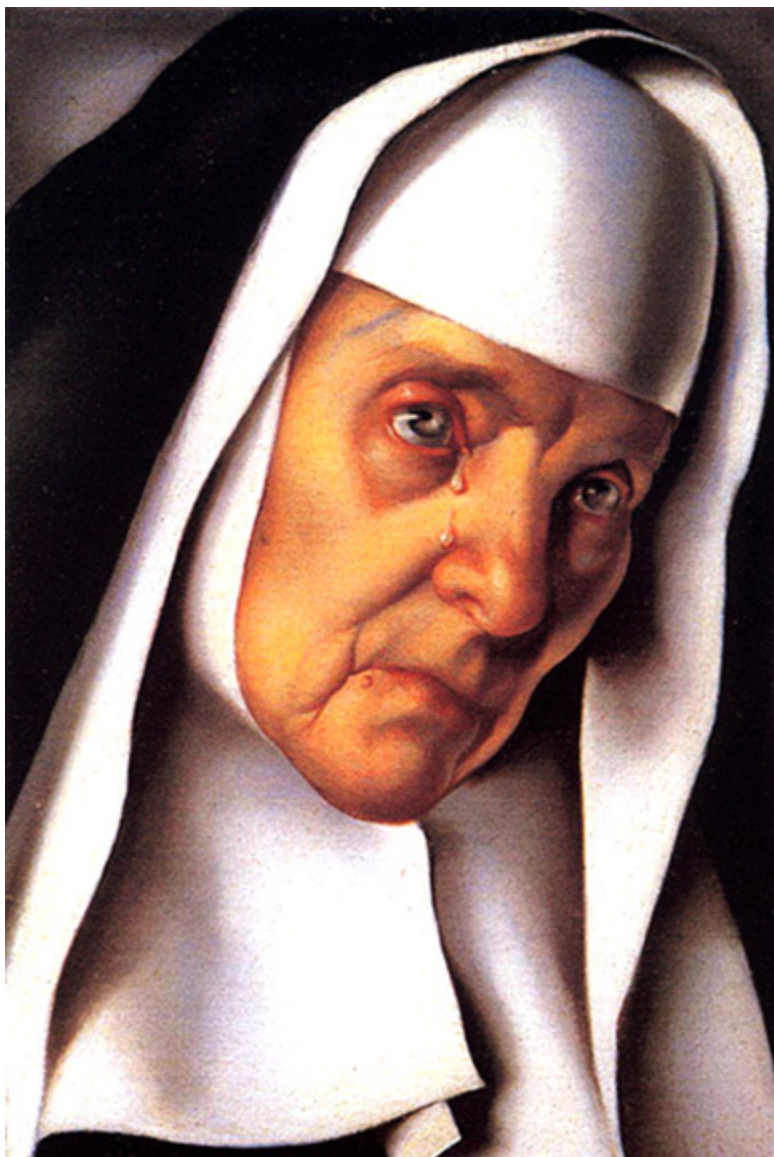
Tamara Łempicka, Matka Przełożona, 1935 r.

Obrazem, który nawiązuje do tematu religijnego i różni się od innych prac artystki to „Matka przełożona”. Tamara Łempicka, będąca u szczytu sławy i kariery przeżyła poważny kryzys. Uciekła więc na jakiś czas od świata i zamknęła się w klasztorze. W lutym 1979 roku Tamara Łempicka udzieliła wywiadu japońskiej dziennikarce, na temat powstania obrazu „Matka przełożona”.