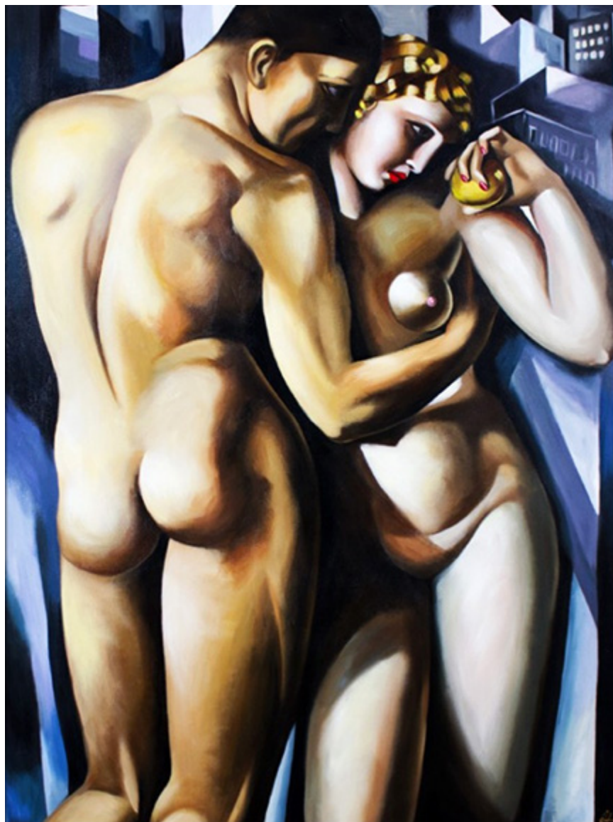
Tamara Łempicka, Adam i Ewa, 1932 r.

Wielką sensację wywołała aukcja z 1994 roku, kiedy w domu aukcyjnym Christie's w Nowym Jorku obraz Tamary Łempickiej „Adam i Ewa” z 1931 roku, należący do kolekcji Barbary Streisand, został sprzedany za dwa miliony dolarów.