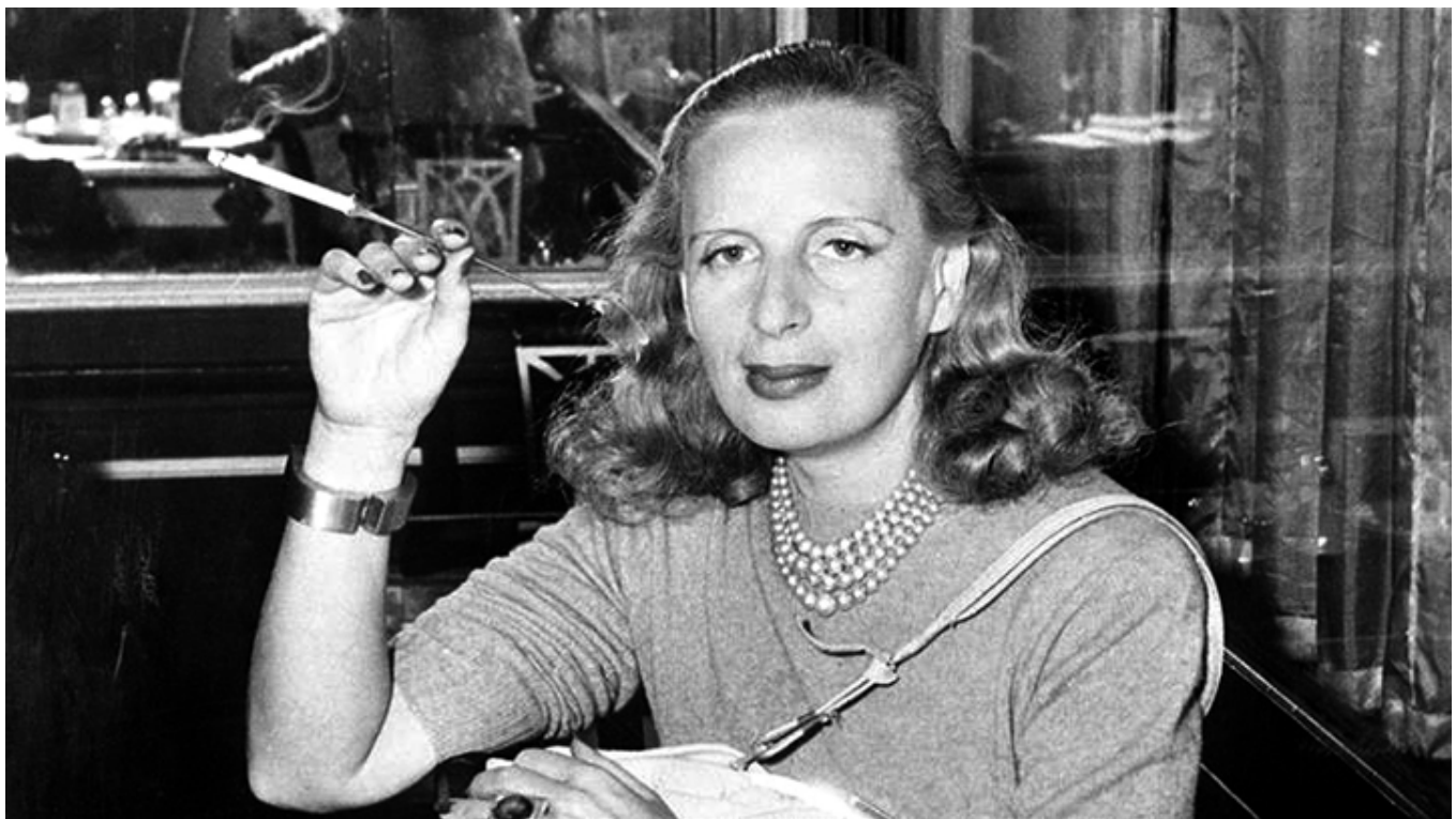
Tamara Łempicka