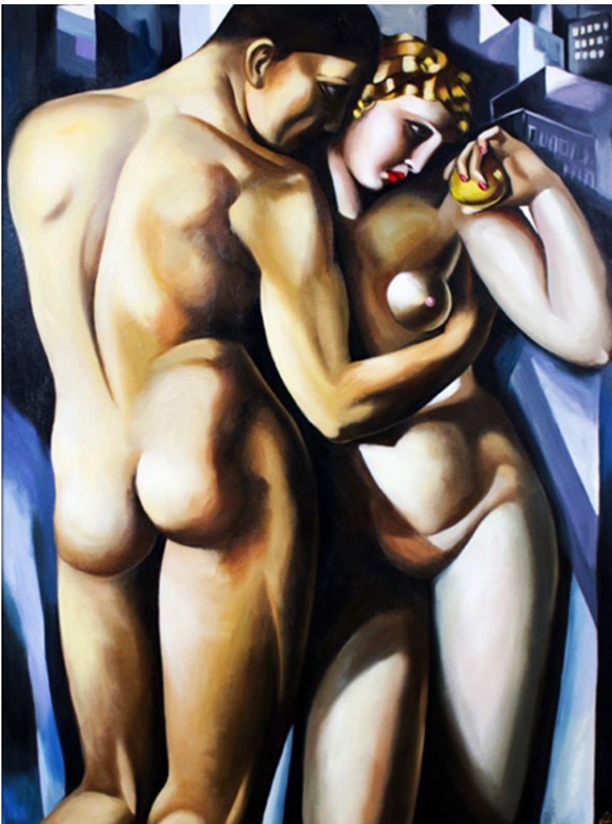
Tamara Łempicka, Adam i Ewa, 1932 r.

Wielu z aktorów hollywoodzkich kolekcjonowało obrazy Tamary. Jedną z największych kolekcji miał Jack Nicholson, który interesował się późniejszym okresem w twórczości artystki, malarstwem abstrakcyjnym. Zafascynowana Łempicą, była także Madonna, wielka wielbicielka i kolekcjonerka jej obrazów. Madonna wykorzystwała pomysły Łempickiej do stworzenia swojego image'u , a także wielokrotnie w swoich wideoklipach opierała się na stylu stworzonym przez malarkę.