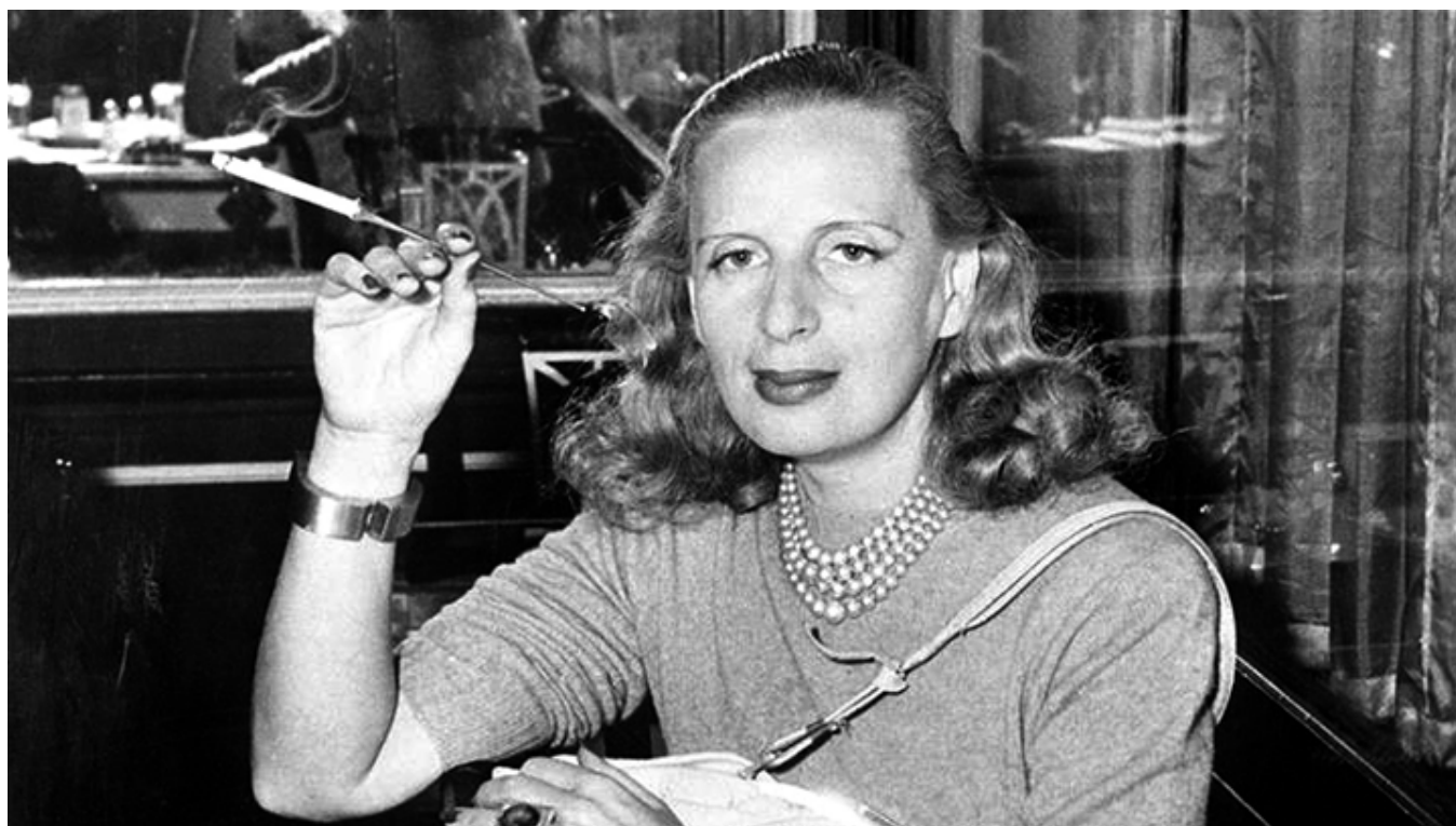
Tamara Łempicka