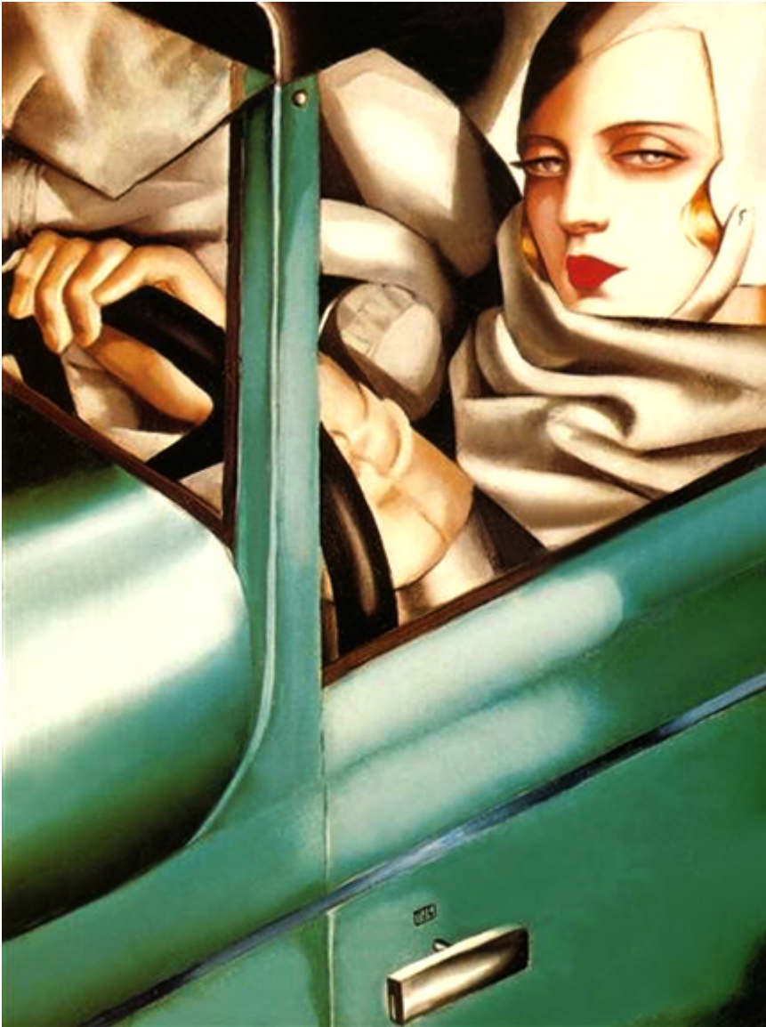
Tamara Łempicka, Autoportret w zielonym bugatti, 1925 r.

„Autoportret” z 1929 roku, na którym artystka siedzi w pilotce za kierownicą bugatti to kolejny bardzo znany i często reprodukowany obraz Tamary Łempickiej. Jest on symbolem dynamicznego rozwoju malarki, jej nieprzeciętności i odwagi w tworzeniu nowego. W ówczesnym świecie panował stereotyp myślenia, mówiący o tym, że sztuka kobiet różni się od sztuki mężczyzn, z racji różnic biologicznych i sposobu widzenia świata. Sztuka kobieca jest dekoracyjna i estetyczna, a męska – filozoficzna, głębsza, bardziej wartościowa. Symboliczne przedstawienie siebie w roli męskiej miało być protestem przeciwko takiemu podziałowi. Po burzliwej dyskusji Marinettiego z grupą studentów w paryskiej kawiarni, podczas której twórca „Manifestu futurystycznego” namawiał do zniszczenia przeszłości i do „podpalenia Luvru”, Tamara tak bardzo chciała stać się częścią chwili, że zaproponowała, iż ma niedaleko zaparkowany samochód, więc może entuzjastyczną