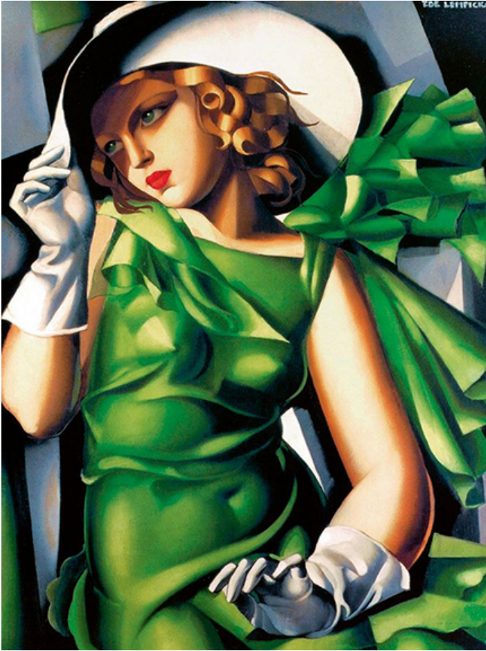
Tamara Łempicka, Młoda dziewczyna w zielonej sukience.