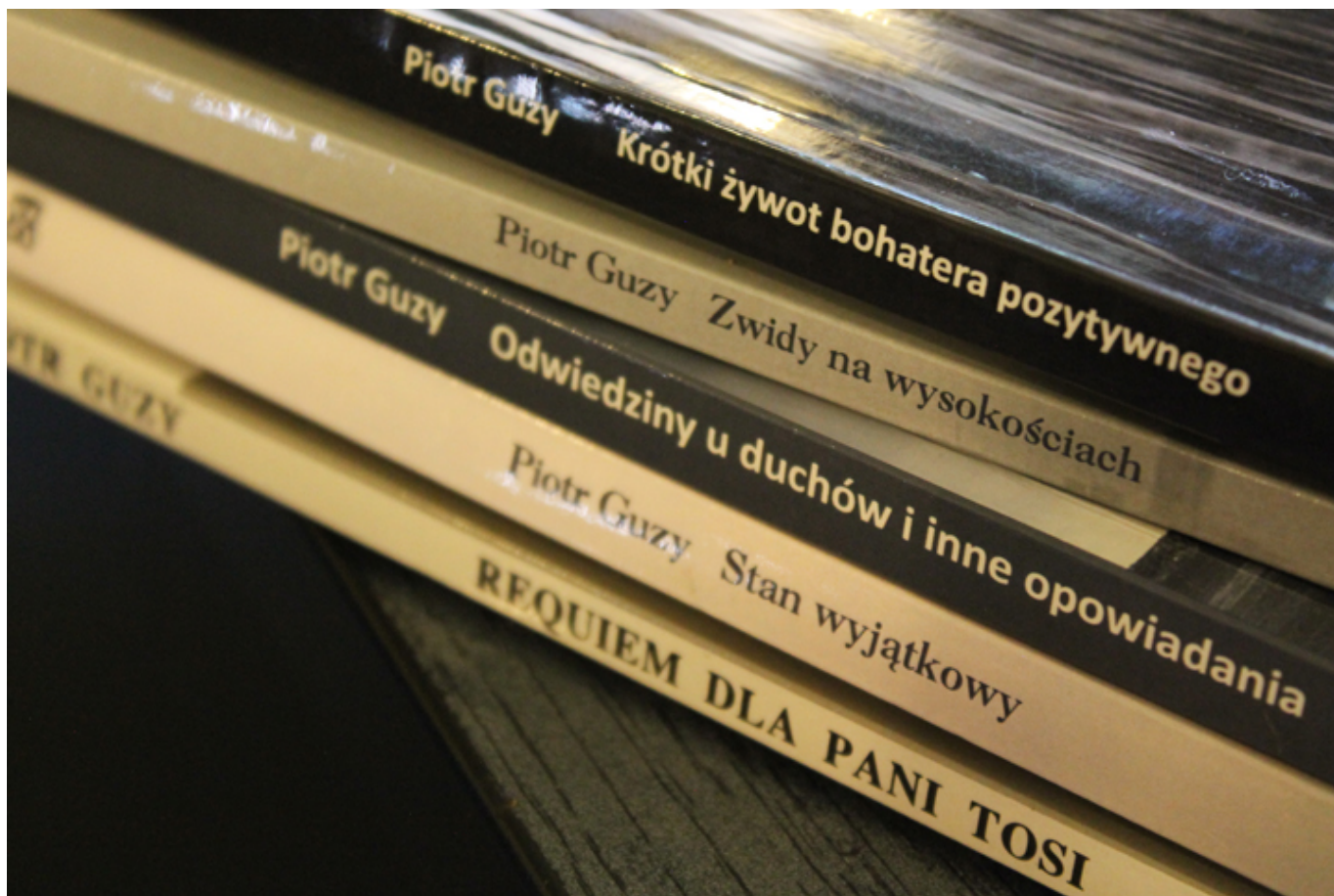
Książki Piotra Guzego, fot. Pola Vesper.