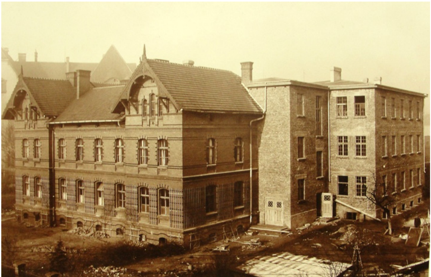
Konwikt Biskupi w Tarnowskich Górach, fot. wikipedia.

Przy ulicy Powstańców stał duży budynek z czerwonej cegły, dwupiętrowy z kaplicą. To w nim, w dwu dużych salach urządzono sypialnie dla starszych i młodszych uczniów, w dużym pomieszczeniu, zwanym studium, stało kilkadziesiąt pulpitów do odrabiania lekcji po południu i wieczorem. W refektarzu podawano posiłki, które przygotowywały cztery zakonnice także opiekujące się całym gospodarstwem domowym. W piwnicy stały szafki z butami, tam przewidziane było po kolacji powszechne czyszczenie butów.