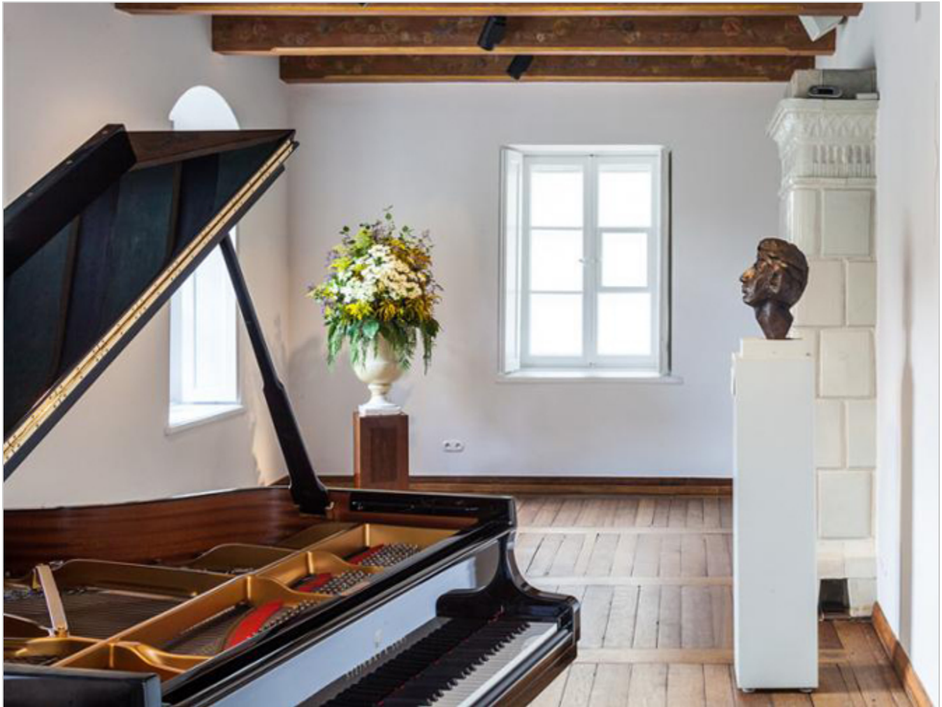
Wnętrze dworku w Żelazowej Woli.