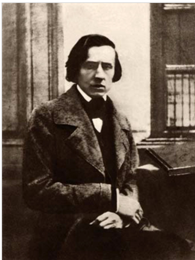
Fryderyk Chopin

atmosferę azylu i wspomnienie szczęśliwych chwil oraz ślady po licznych spotkaniach i częstych wizytach nieprzeciętnych gości.