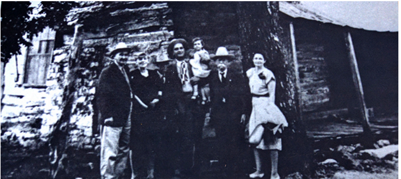
Przed domem za czasów Johnsonów