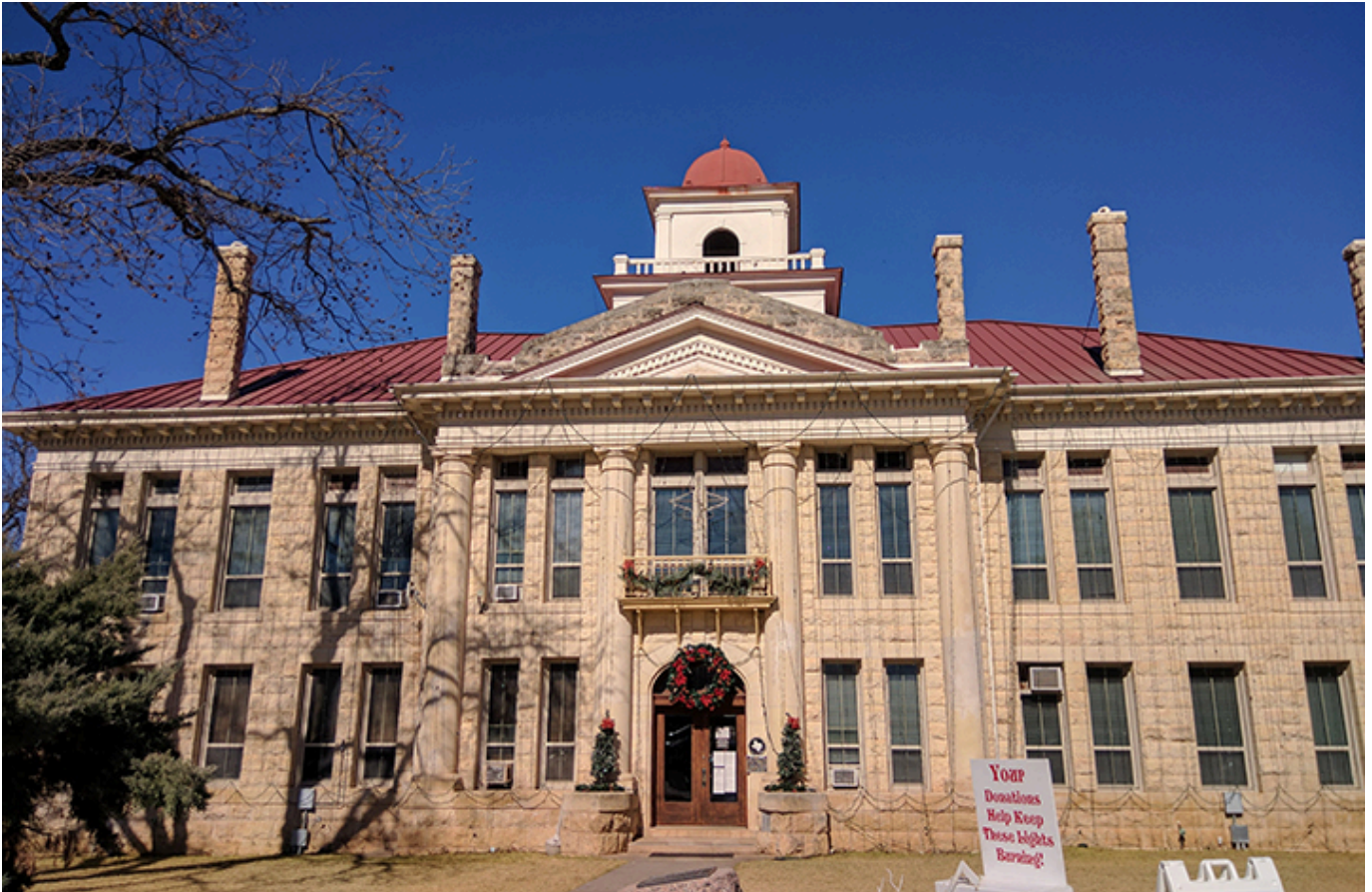
W centru miasta znajduję się budynek sądu