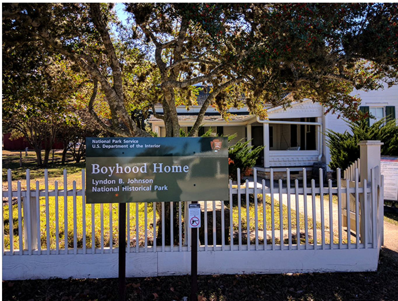
Dom Johnsonów w Johnson City