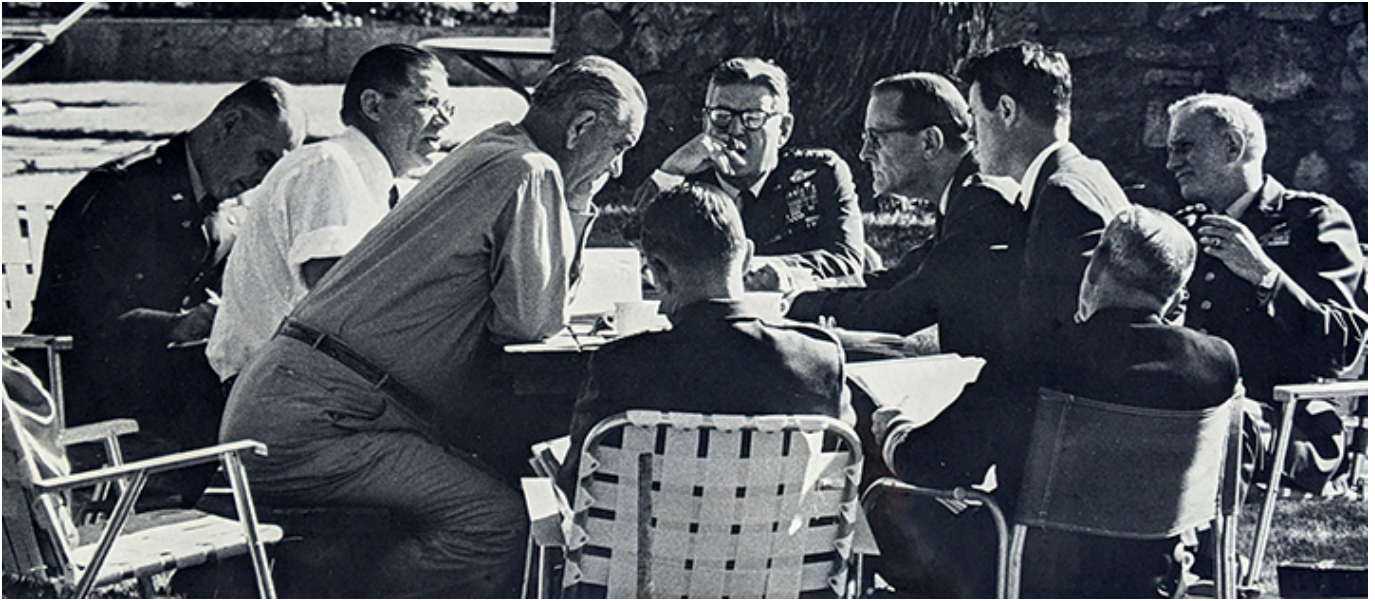
Słynne orzyjęcia w Teksaskim Białym Domu