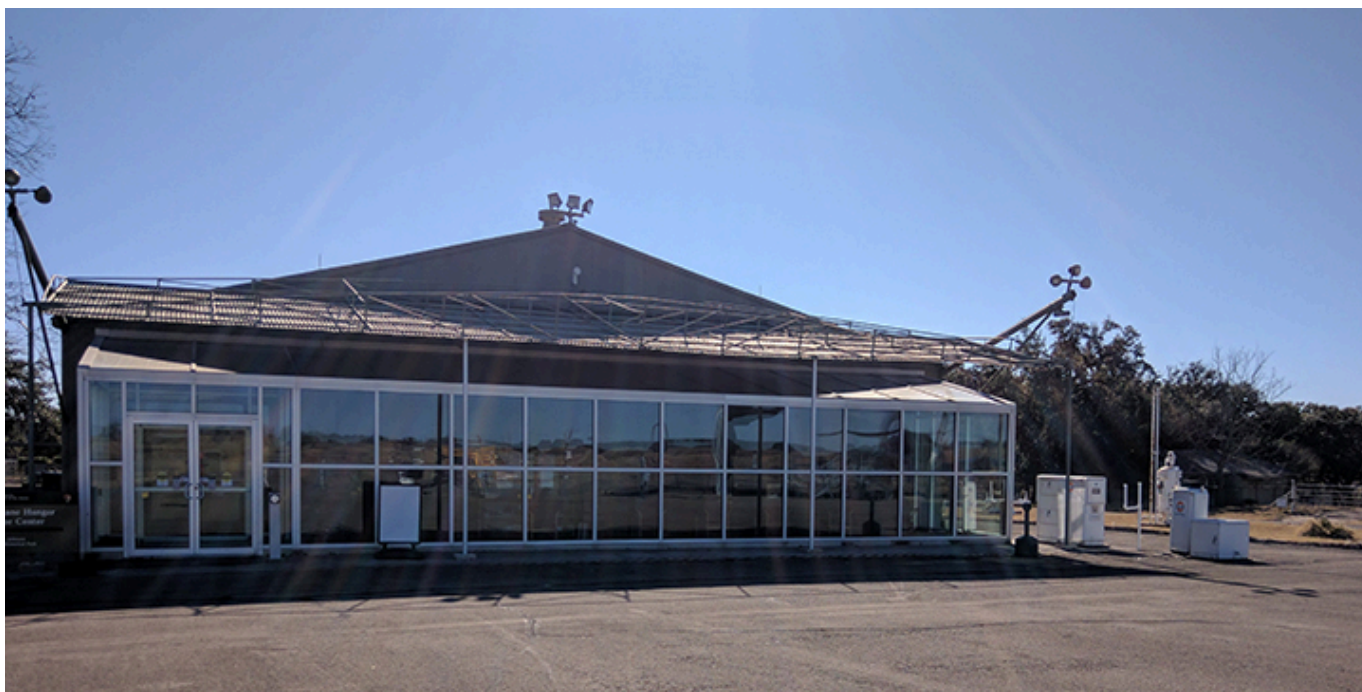
Miejsce garażowania samochodów Lady Bird Johnson