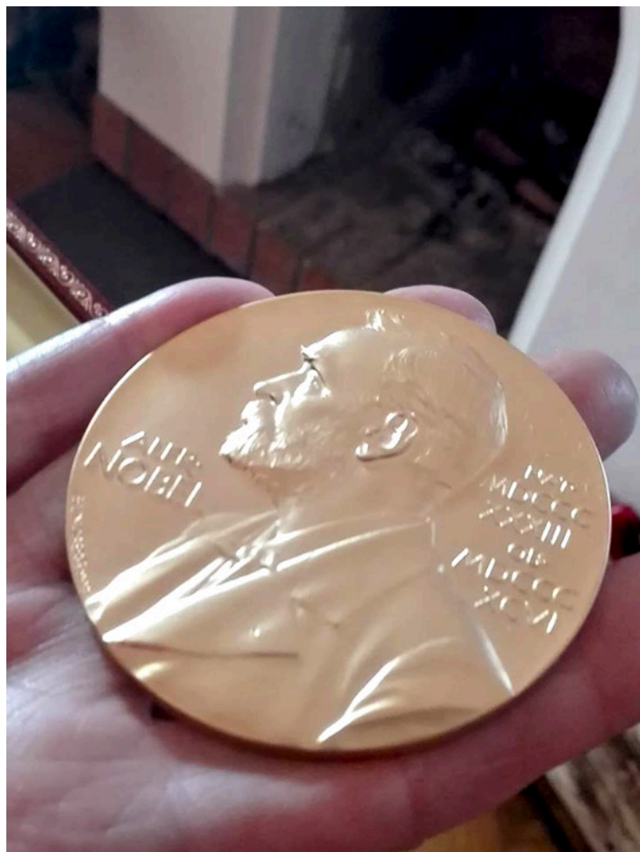
Medal noblowski, który Tomas Tranströmer dostał w 2011 r.

W pokoju Tomasa wszystko jak za życia. Tylko już ponad dwa lata nikt nie otwierał leżących na fortepianie nut Bacha i Brahmsa do grania lewą ręką.