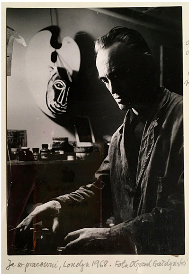
Je w pracowni, Londyn 1968.