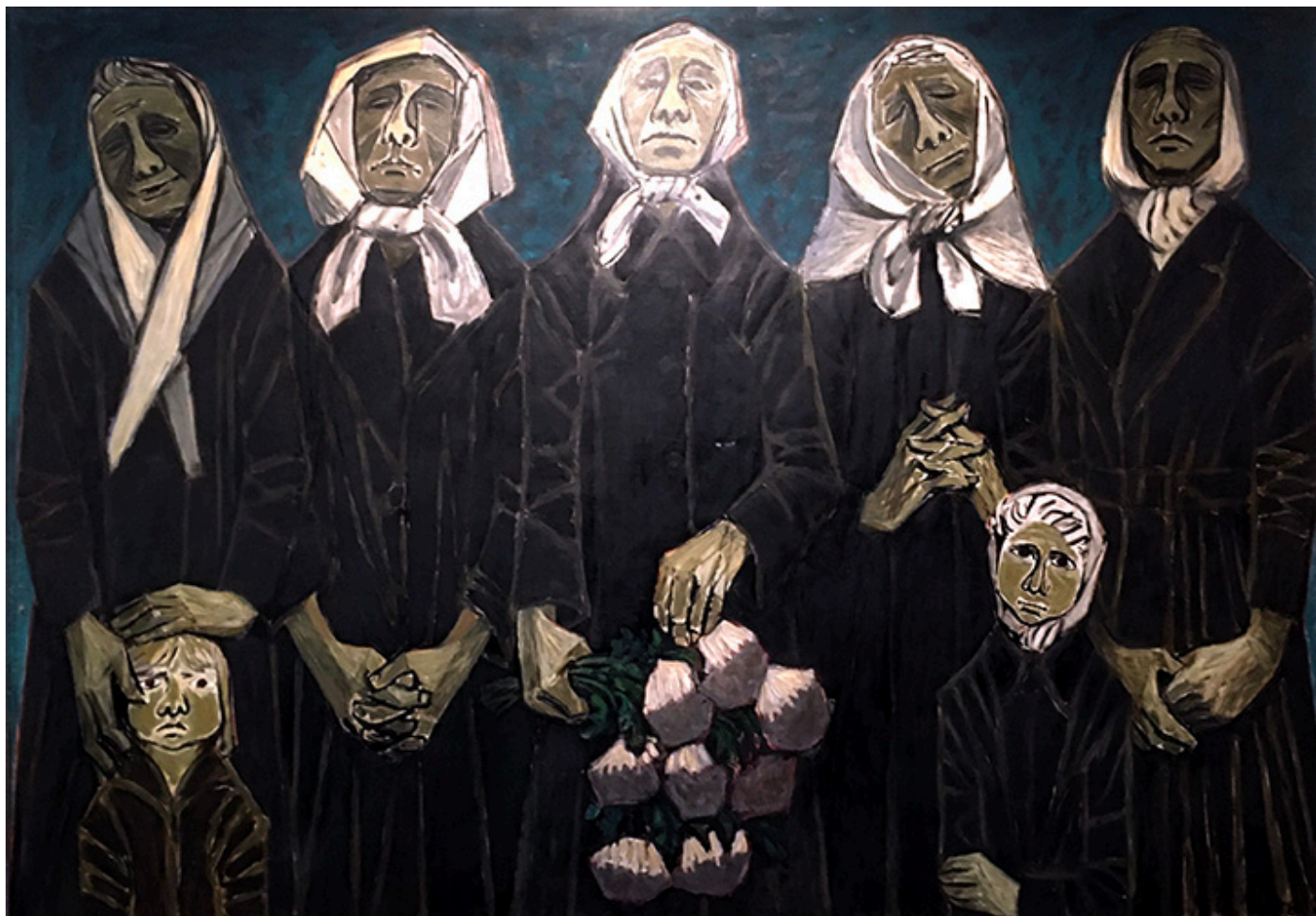
Węgierskie kobiety u grobu poległych, 1956/57 r., olej na płótnie, 152×215,5 cm

Obok „węgierskich kobiet” zawisł obraz mężczyzny z dramatycznie uniesioną do góry ręką – „Stój, zanim będzie za późno”(1958). Tragiczny gest ostrzega przed katastrofą. Którą?... Może tą atomową, pod piętnem której żyło Żuławskiego pokolenie i my wszyscy do tej pory. Dalej widnieje obraz wieśniaczki hiszpańskiej wracającej z pracy przy żniwach. W jednej ręce trzyma grabie, a druga dźwiga ciężki tobół. Twarz przeorana trudami kończącego się dnia. Patrzą i myślę o wsi, na której wyrastałem w dzieciństwie i znam dobrze jak wyglądają ręce zniszczone ciężką pracą.