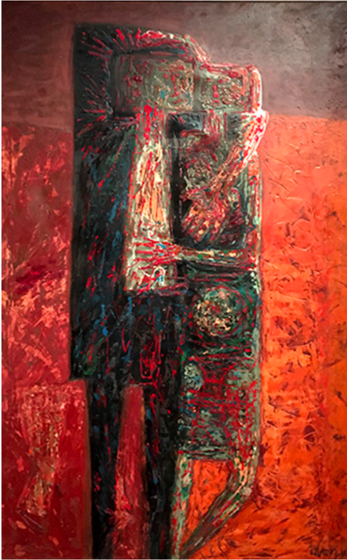
Kochankowie IV, 1962, akryl i olej na płótnie, 167×105,5 cm