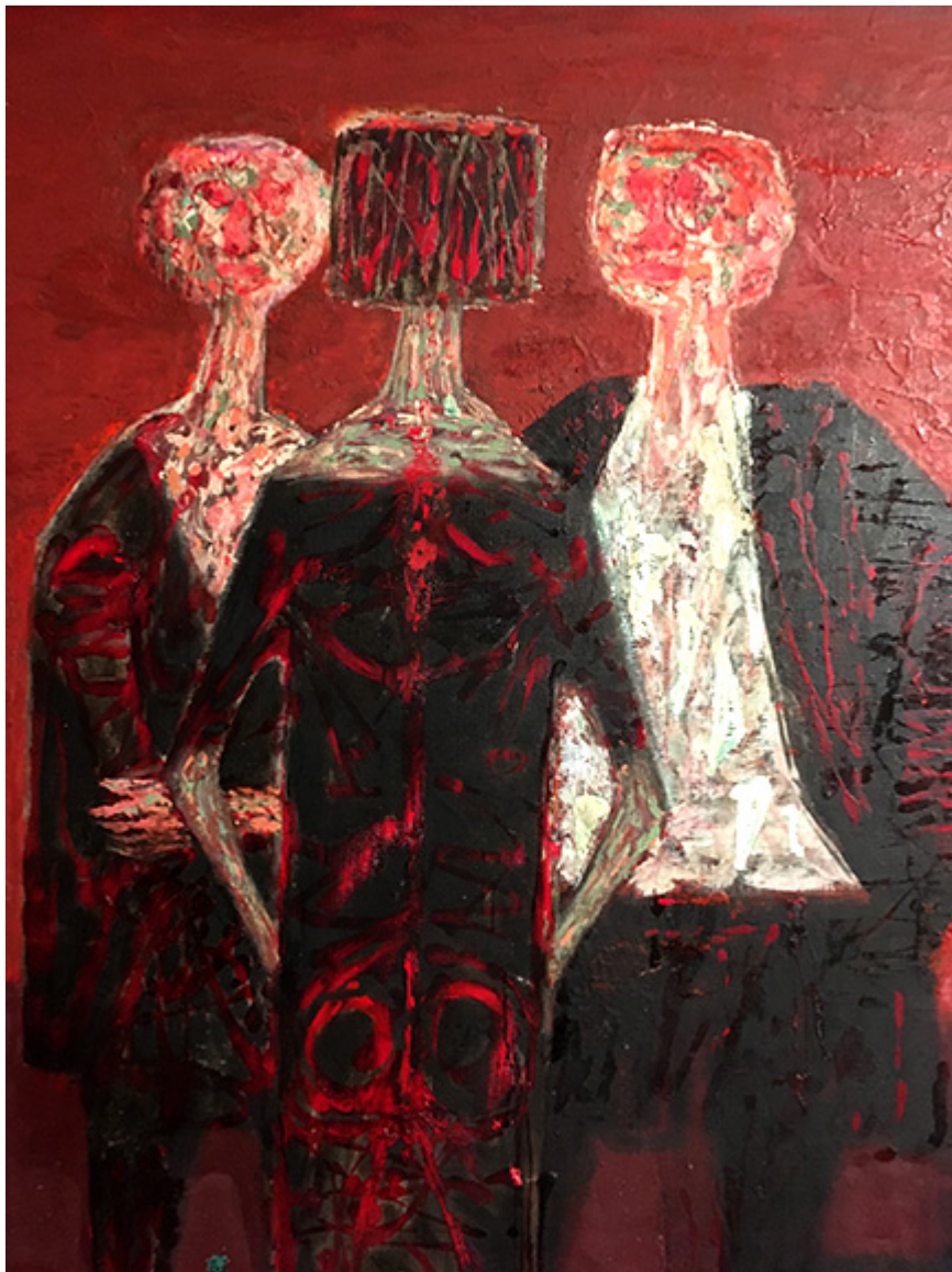
Malarstwo Marka Żuławskiego na wystawie w Toruniu