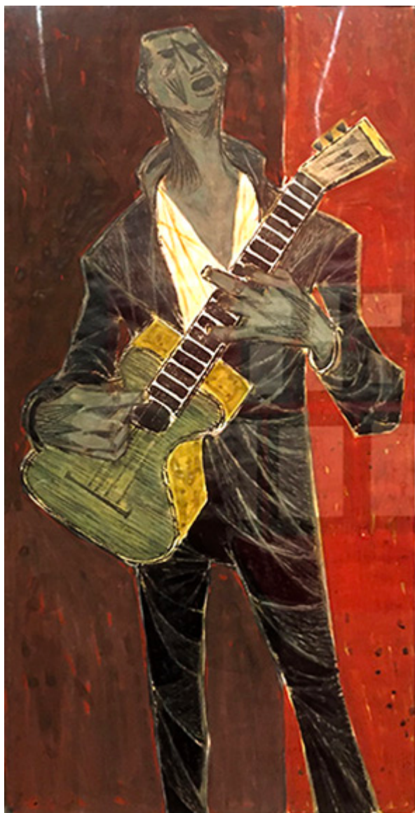
Gitarzysta, 1956-58, gwasz, tusz na papierze, 51×26,5 cm

Kiedy rozmowa zesłała na żyjących polskich artystów najważniejszym z wymienionych, według wuja, był Marek Żuławski. Żałuję, że wtedy nie mogłem go poznać, a była ku temu szansa. Znałem jego prace tylko fragmentarycznie – czy to z doniesień polskiej prasy, czy też później ze ścian londyńskiego POSK-u.