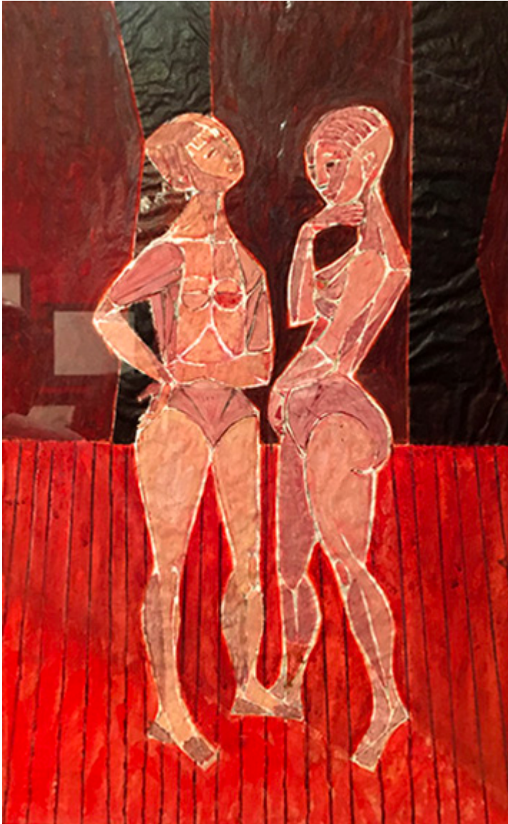
Tancerki za kulisami, 1956, litografia, kredka i gwasz na papierze, 56×38,5 cm