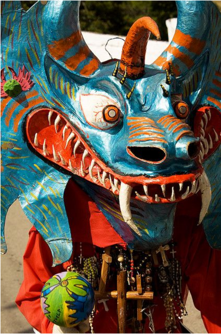
Diabeł z Yare