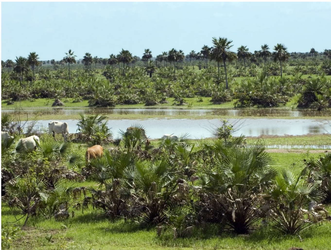
Rozlewisko na Równinach

Nie tylko noce były uciążliwe. Oczywiście, nie było tam żadnej studni ani toalety. Byliśmy skazani na picie wody z rzeki i mycie się w następujący sposób: czerpało się wodę z rzeki przy pomocy dużej totumy , czyli połówki wydrążonej tykwy Crescentia Cujete , bacząc, czy przypadkiem nie pływa w tej wodzie jakaś pirania czy płaszczka i tak zaczerpniętą wodą polewało się głowę, plecy. Oczywiście, ta „kąpie