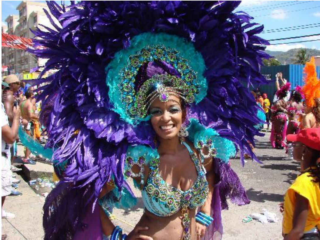
Karnawał na Trynidadzie