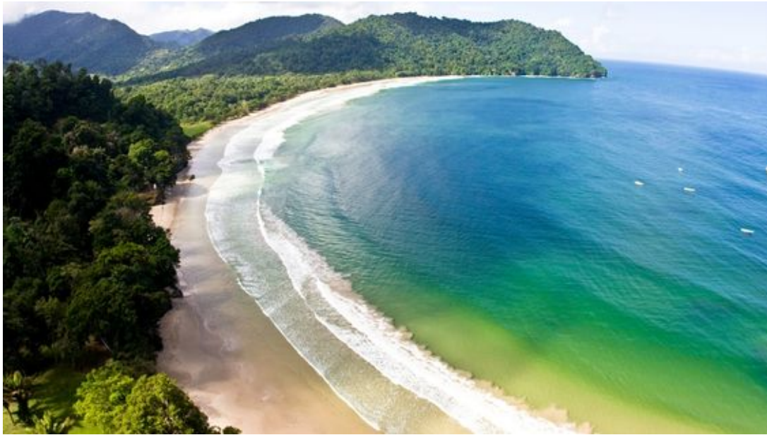
Plaża Las Cuevas