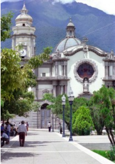
Katedra w Meridzie

Kolejną okazją do wyjazdu z Caracas był Wielki Tydzień i Wielkanoc, która wypadła wówczas 22 kwietnia. Postanowiliśmy tym razem odwiedzić przeciwny kraniec Wenezueli, a mianowicie Andy Wenezuelskie i ich stolicę, miasto Mérida, odległe od Caracas o 680 km na południowy zachód. O ile pamiętam, poleciliśmy tam samolotem. Założona w 1558 roku Mérida leży u stóp najwyższych gór Wenezueli, Sierra Nevada de Mérida (Śnieżne Góry Méridy), z najwyższym szczytem Pico Bolívar (5007 m. n.p.m.). Góry te stanowią najdalej na północ wysunięty łańcuch wysokich Andów. Samo miasto Mérida, choć tak dawno założone, nie może się pochwalić, niestety, żadnymi ciekawszymi zabytkami z okresu kolonialnego, może z wyjątkiem katedry i kilku domów w jej pobliżu. Przecina je rwąca górską rzeka Chama, która nadaje miastu swoisty urok. Na północno-wschodnim skraju miasta odwiedziliśmy Ogród Zoologiczny Wodospady Milla ( Parque Zoológico Chorros de Milla ), gdzie największą atrakcją były dla nas owe wodospady, dość wysokie, spadające dwoma segmentami. Andy są tak potężne i wyniosłe, że zamykają całkowicie wszelką perspektywę i stanowią de facto ogromny, czarno-biały, zwarty masyw tuż za południowo-wschodnimi obrzeżami miasta. W prostej linii najwyższe szczyty dzieli od miasta zaledwie około 10 km. Na szczytach widoczne są wieczne śniegi i lodowce.