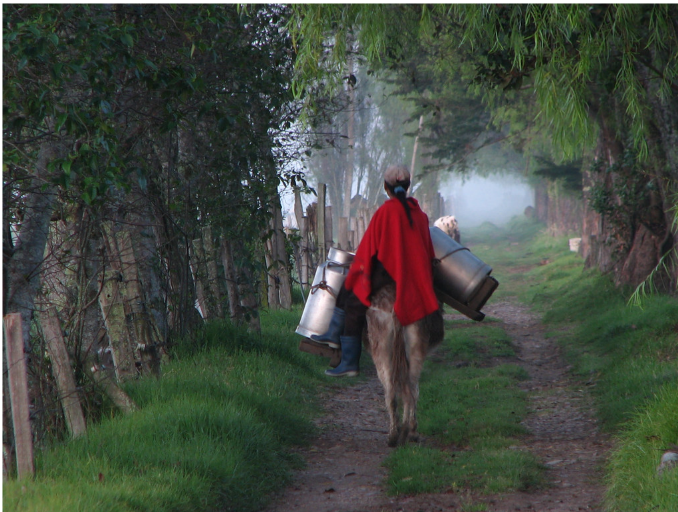
Ruana. Ponczo w Andach wenezuelskich

Warto powiedzieć parę słów na temat budownictwa, strojów i upraw w tym regionie. Otóż to wszystko wygląda zupełnie inaczej, niż w innych częściach Wenezueli. Wydawać by się mogło, że w istocie jesteśmy w innym kraju, a wszystko dlatego, że to Andy, kraina zamieszkała przez Indian andyjskich lub tutejszych Metysów, a więc ludy zupełnie inne etnicznie, niż na nizinach. Ubierają się zgodnie z panującym tu chłodem w czerwone poncza zwane ruanas . Domy także dostosowane są do klimatu, mają grube ściany z kamienia, a dachy kryte czerwoną okrągłą dachówką są bardziej strome z uwagi na częstsze opady deszczu. Wysokogórskie hale, pola i skraje dróg odgródzone są kamiennymi murkami. Uprawia się pszenicę, a spośród drzew dominują tu charakterystyczne dla Andów eukaliptusy. Jest rzeczą znaną powszechnie, że granice państw latynoamerykańskich wytyczono w sposób niezwykle sztuczny, dzieląc regiony stanowiące etniczną, kulturową i klimatyczno-geograficzną całość. Tak się stało i tutaj. Andy wenezuelskie to przedłużenie Andów