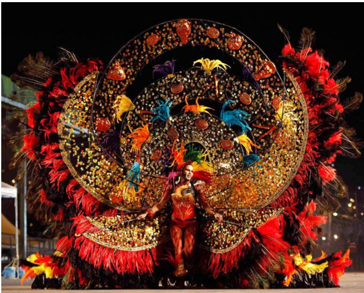
Karnawał na Trynidadzie

następnym razem niech mi się pan nie stawia!”