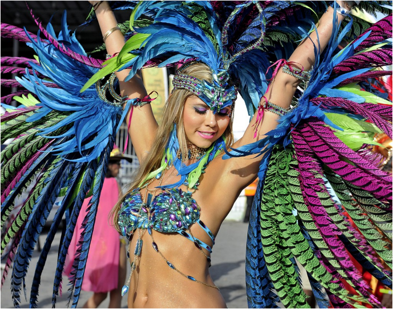
Karnawał na Trynidadzie