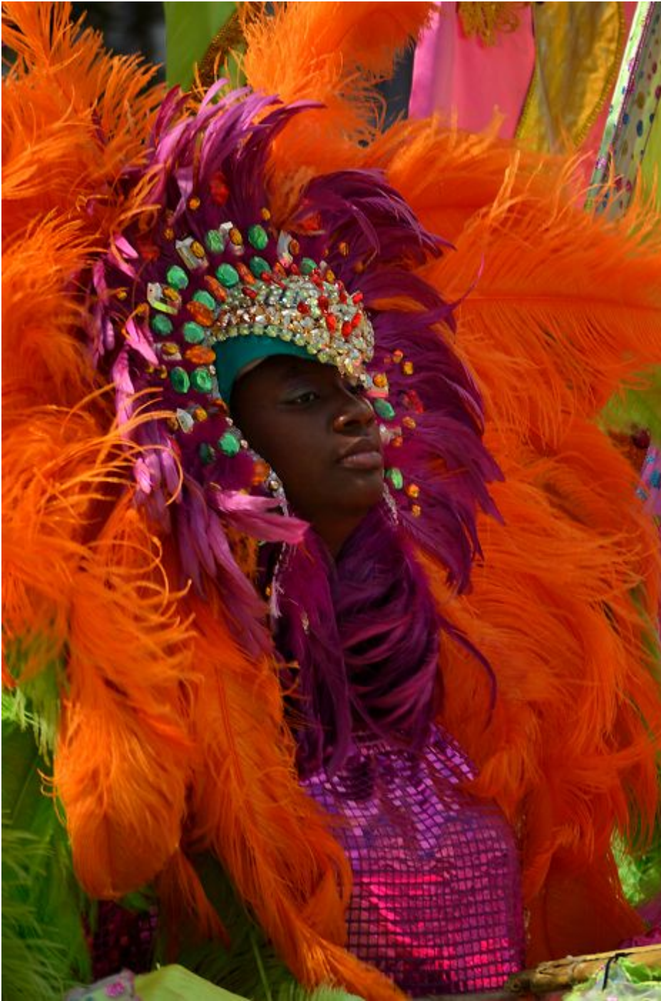
Karnawał na Trynidadzie