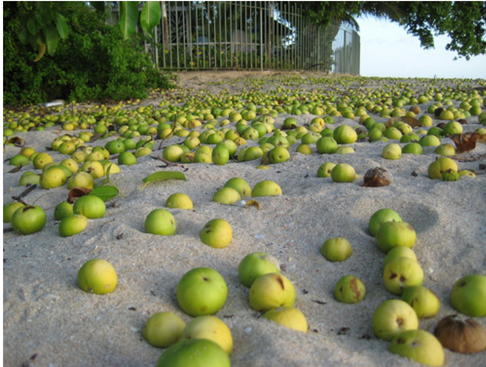
Niezwykłe trujące owoce manzanillo ( Hippomane mancinella )

Nazajutrz czujemy się wybornie, jakby nic się nie stało. Przypomniałem sobie karnawał na pobliskiej Wyspie Trynidad, z takim entuzjazmem opisany przez Olgierda Budrewicza. Jedźmy więc na Trynidad! Telefonuję do portu Güiria, skąd odpływają statki na tę wyspę i oto, co słyszę w słuchawce: “Ostatni statek już wypłynął, ale mogą Państwo popłynąć nielegalnie, wynajmując prywatnie łódź motorową”. Decyzja szybka i już wychodzimy na szosę, zatrzymujemy jakiś dżip. Jadą nim dwaj chłopcy właśnie do Güiria, gdzie mają odwiedzić brata, właściciela sklepiku. Twierdzą, że on zna tam wszystkich i z wynajęciem łodzi nie będzie kłopotów, a i oni chętnie popłyną na Trynidad, by zobaczyć ten wspaniały karnawał. Znakomicie!