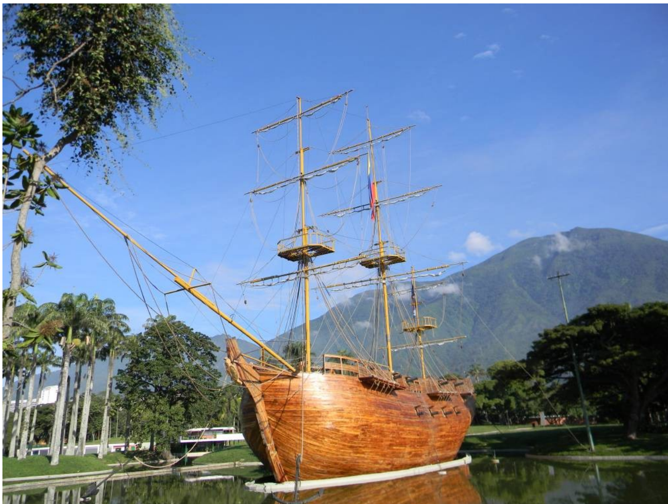
Fregata Leander w Parku Wschodnim