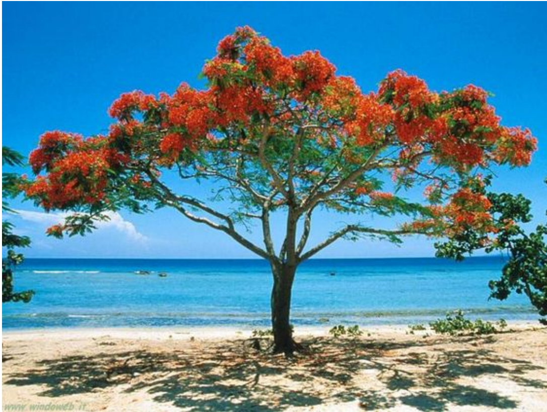
Akacja tropikalna (Framboyán) na Trynidadzie