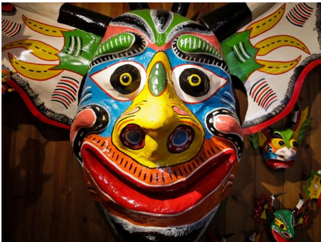
Maska diabła z Yare

Wszędzie dominuje kolor czerwony nawet na ołtarzach wzniesionych na trasie procesji: kwiatów czerwonych jest najwięcej, a znacznie mniej różowych, białych czy żółtych. Dom Diabła, mieszczący siedzibę tego stowarzyszenia o charakterze głównie dobroczynnym i mającego na celu wzajemną pomoc i wspieranie wszystkich jego członków, także jest cały czerwony, a nad drzwiami wisi wielka czerwono-niebieska maska o twarzy "krowio-ludzkiej". Diabły najpierw muszą w skupieniu wysłuchać mszy, ale nie wolno im wchodzić do kościoła: klęczą wszystkie na zewnątrz, a gdy msza się skończy, wychodzi ksiądz z kropidłem i święci diabły święconą wodą (sic!). Dopiero gdy są poświęcone, zaczyna się procesja uliczkami miasteczka. Idą tańcząc i potrząsając rytmicznie marakasami. Są to grzechotki zrobione z wydrążonych tykw i wypełnione nasionami. Zatrzymują się przed kolejnym ołtarzem i procesja kończy się przed Domem Diabła.