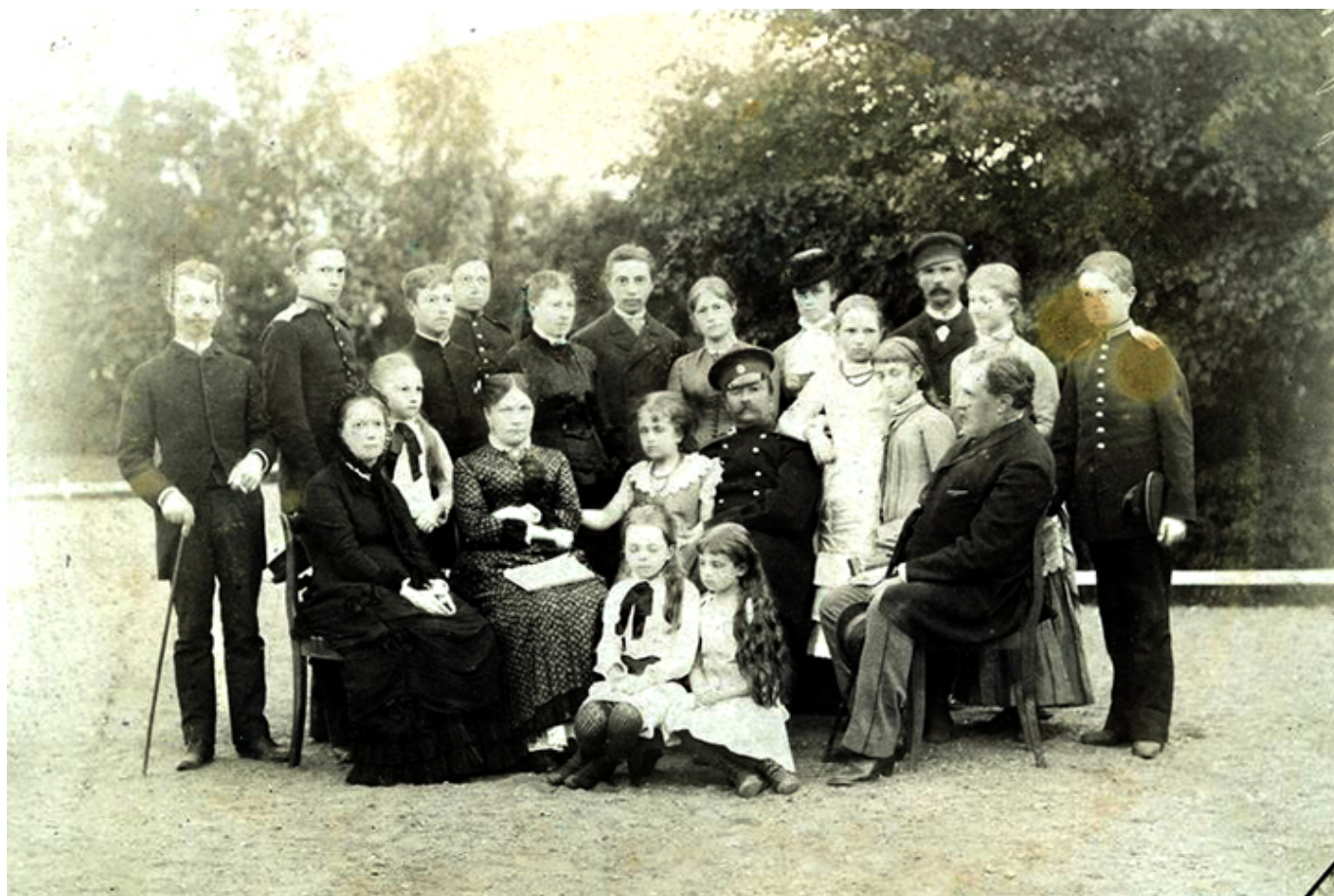
Rodzina Tyszkiewiczów, 1880-1882 r.