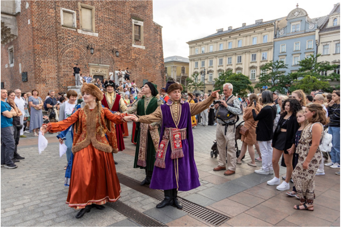
Polonez na Rynku Głównym w Krakowie, z udziałem mieszkańców miasta i turystów, pod kierunkiem baletu Cracovia Danza