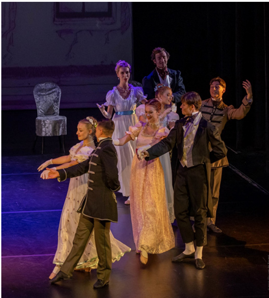
Polonez w wykonaniu baletu Cracovia Danza podczas spektaklu