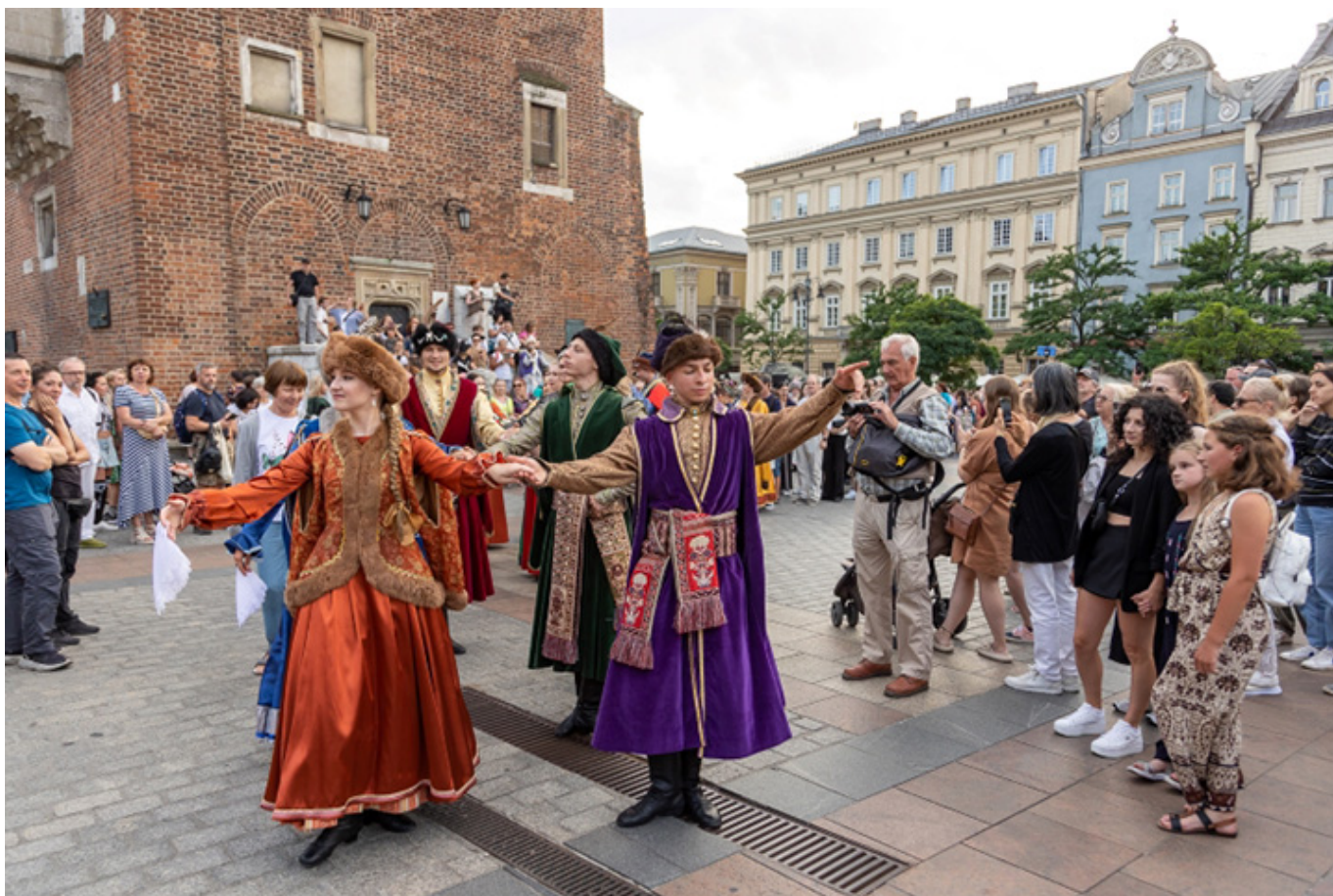
Polonez na Rynku Głównym w Krakowie, z udziałem mieszkańców miasta i turystów, pod kierunkiem baletu Cracovia Danza

jeżeli potem królował na dworach i salonach Europy. Ale związany jest z naszą polską tradycją, oczywiście tą szlachecką, dworską, ale też i wiejską, choć w tym przypadku nie było możliwości uwiecznienia jej na piśmie. Ale jak wiadomo, już w XIX wieku, w różnych regionach Polski tańczono „chodzonego”, który ma znamiona poloneza. Istniał też polonez krakowski, którego tradycję do dziś kultywuje się w naszym mieście.